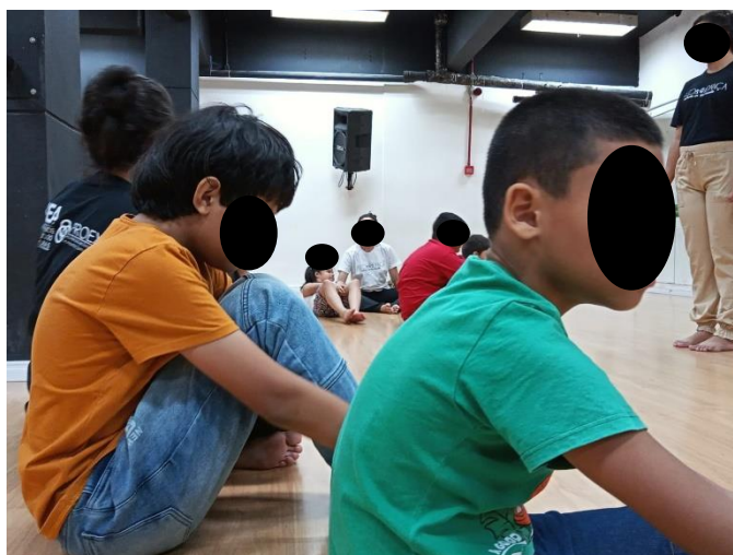
Figura 2. Volta à calma

Foi buscado falar com a criança verbalmente de forma atrativa, por exemplo: vamos lá com os outros coleguinhas; não parece tão legal essa dança? O que você acha de ir até lá?. Também havendo tentativas de levar as atividades até ele, na qual adaptávamos as atividades psicomotoras e separávamos materiais para ele usar sentado, como bola, figuras de mão e pés ou bambolês e incentiva-lo a fazer a atividade dentro de seu entendimento. Todas essas tentativas tiveram de certa forma sua utilidade para a conquista final, pois através do vínculo estabelecido com a criança e os monitores foi possível alcança-la, mas ao mesmo tempo foi observado que todas as tentativas tinham algo em comum: fazer a criança entender nossa forma de comunicação para assim compreender o que estava sendo pedido e executar seja a aula de Dança, ou as atividades psicomotoras. Mas para chegar até a criança precisamos tentar entender, o que dentro de universo do espectro e das especificidades da criança nós carecíamos de nos adaptar para então a comunicação avançar.