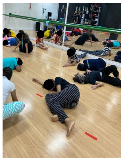
Figura 6. Aula Psicodança V