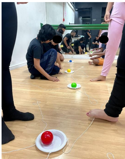
Figura 3 Atividades Psicomotoras

pensadas buscando narrativas e contextos concretos, devido à dificuldade de crianças autistas entenderem o abstrato, que incentiva as crianças a relacionarem a música e sua letra com os movimentos escolhidos para a Dança.