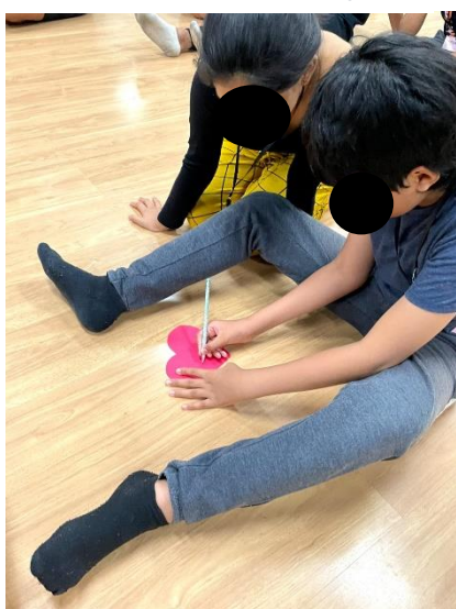
Figura 7. Aula Psicodança IV

se recusava a participar, permanecendo sentado em um canto da sala, depois, começou a participar somente da volta a calma, depois se abraçou e repetiu as palavras, depois começou a participar da Dança, depois demonstrava reconhecer os monitores e houve as primeiras tentativas de se comunicar para se expressar, pedindo para participar das atividades psicomotoras. Ficou nítido que quanto mais a criança parecia estar confortável em sala, mais ele se permitia participar, como pode ser observado nas figuras 7 e 6, na qual ele se encontra no meio das outras crianças e participando ativamente das aulas. Sendo essencial o acompanhamento com os monitores, pois a afetividade da criança cresceu bastante, demonstrando carinho pelos professores.