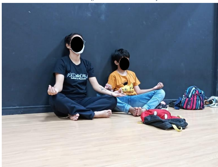
Figura 1. Aula PsicoDança I

Durante as aulas de Dança, foi observado que a criança, não só repetia palavras, mas também ficava irritada quando os monitores responsáveis demonstravam não entender, e por muitas vezes ela desistiu de participar das atividades, indo para os cantos da sala, assim foi necessário estabelecer um formato de ouvir essas repetições mas estimular para que houvesse outra forma de ela expressar o que queria ou sentia, portanto, os gestos (movimentos exagerados) se tornaram aliados.