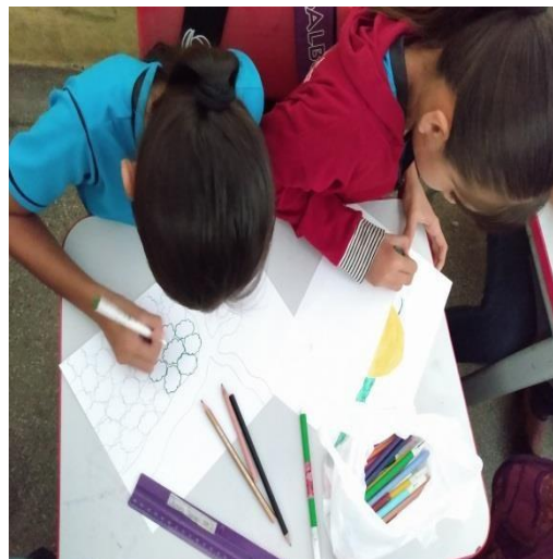
Figura 06: desenho na sala de aula.

Embora existam professores que utilizam os recursos didáticos diferenciados para aperfeiçoar suas aulas, há a necessidade de que os educadores revejam seus métodos de ensino na disciplina para que o educando venha sentir prazer em estudá-la. O professor é o mediador do conhecimento e no processo de formação de conceitos e na abordagem de temas relacionados ao ensino geográfico. Isso requer do professor conhecimento adequado e orientações específicas. Dentre tantos recursos utilizados pelo professor o livro didático ainda é um instrumento necessário.