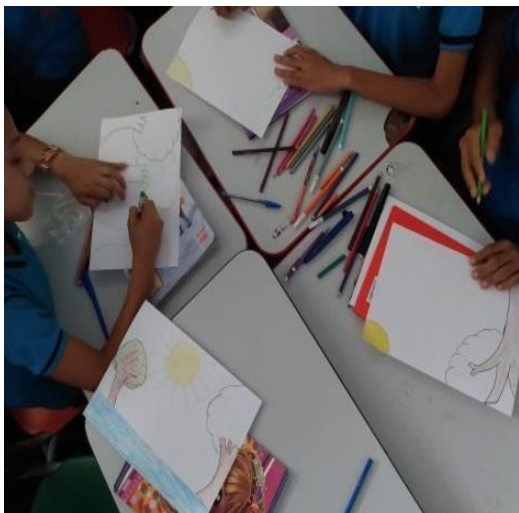
Figura 05: desenho na sala de aula.