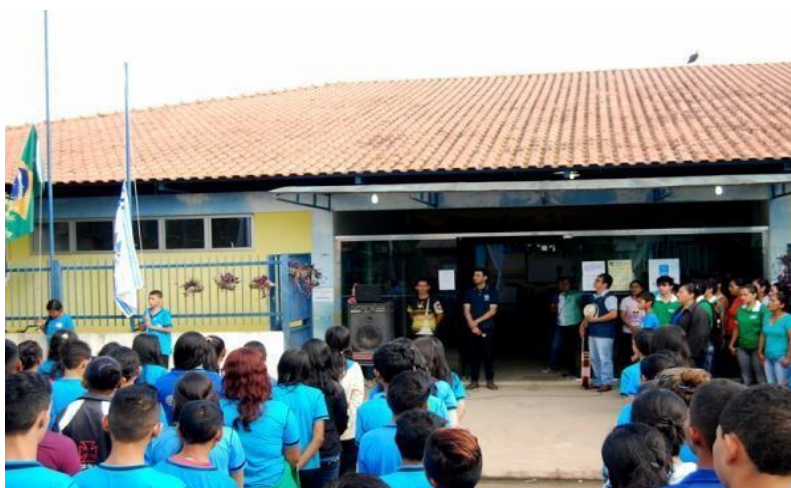
Figura 01: Escola Municipal Luz do Saber.

Nesse contexto, buscamos desenvolver a pesquisa na Escola Municipal “Luz do Saber”.