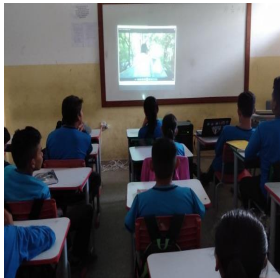
Figura 03: vídeo na sala de aula

Através dos recursos didáticos diferenciados, juntamente com a tecnologia, o educador pode desenvolver aulas dinâmicas que venham contribuir para o ensino e aprendizagem do aluno. Os recursos tecnológicos estão ao seu alcance e devem ser utilizados em sala de aula, pois são ferramentas que os professores devem usar a seu favor como recursos metodológicos para o ensino.