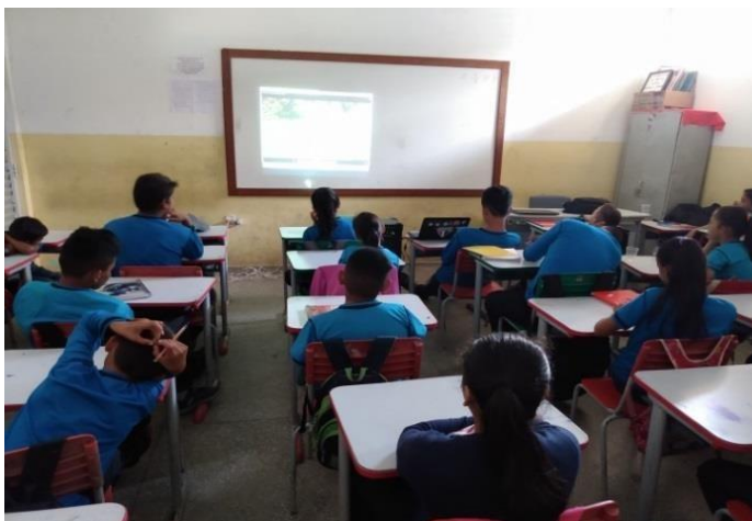
Figura 04: a música como recurso didático.

Outro método educacional de se trabalhar em sala de aula é a música, pois através dela podemos nos expressar de várias maneiras. A música ensina o individuo a ouvir, escutar de maneira ativa e reflexiva. Além de se ser uma atividade divertida que ajuda na construção do caráter, da consciência e da inteligência emocional do individuo. Na figura 04 podemos ver a exposição da música através de multimídia.