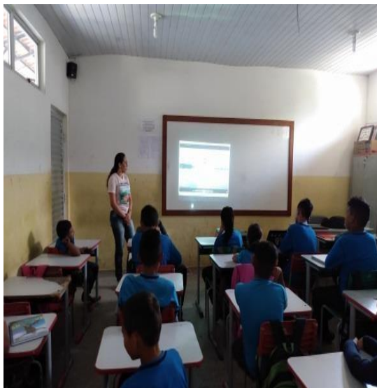
Figura 02: vídeo na sala de aula Santos, 2019.