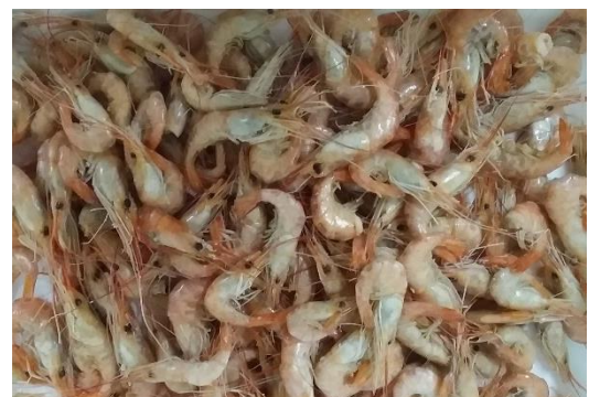
Figura 3 Amostra de camarão salmourado.