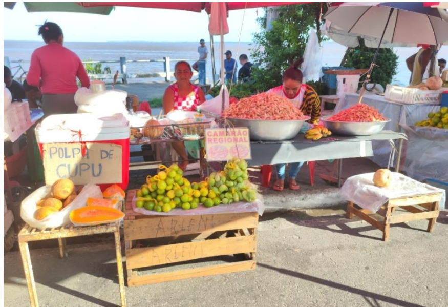
Figura 2 Feira Livre localizada na Rua Rui Barbosa, centro do Município de Parintins-AM.