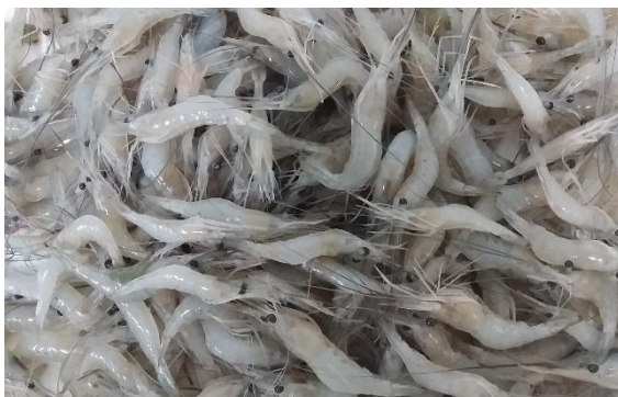
Figura 4 Amostra de camarão in-natura .

Cada amostra continha 1 Kg de camarão salmourado e 1 Kg de camarão in natura (FIGURA 3-4). Ambas foram encaminhadas ao Laboratório de Estudos de Crustáceos da Amazônia LECAM, localizado no Centro de Estudos Superiores de Parintins CESP, onde foram desmembrados e medidos em 200 gramas de cefalotórax e 200 gramas de abdome, mantidos refrigerados até o momento das análises. As amostras foram acomodadas separadamente em caixa térmica com gelo e transportadas ao Laboratório de Análises Clínicas Lupa, localizado na Capital Manaus, onde foram realizadas as análises.