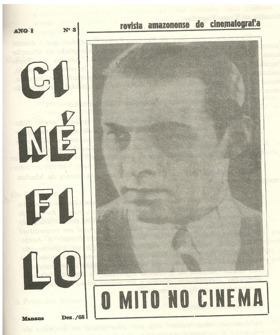
Figura 1. Capa da Revista Cinéfilo, produção local sobre cinema nacional e mundial Nº 3. 1968.

Acompanhando este processo de distribuição de filmes em Manaus, o crescimento populacional possibilitou além das salas de cineclubes e as outras já existentes nas décadas de 40, surge entre elas o Cine Odeon, inaugurado em 1953 e o Cine Ypiranga, em 1959, o que reforça o papel da popularização dessa linguagem cultural no Amazonas.