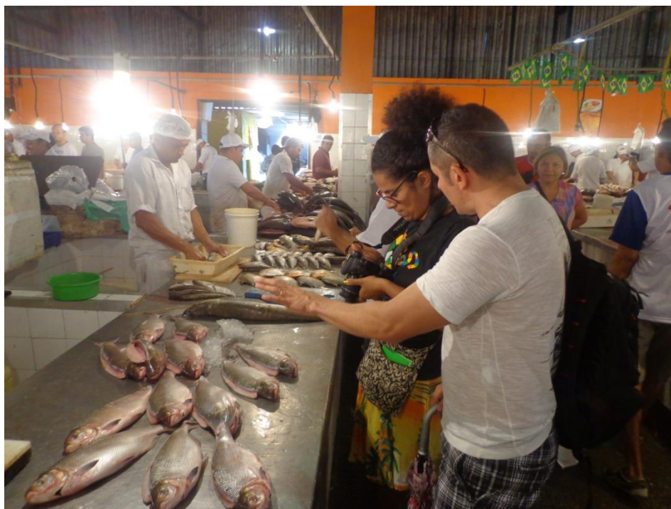
Imagem de gravação- Feira do Peixe -1ª Externa 23/06/2013