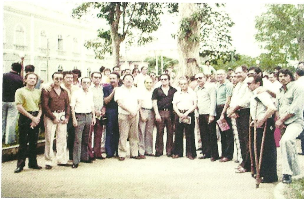
Figura 3. Membros do Clube da Madrugada na Praça Heliodoro Balbi (Praça da Policia).

Era a primeira vez que escritores, poetas e artistas plásticos identificavam, nessa natureza “flutuada” do intelectual amazonense, esta necessidade em optar por uma posição crítica em relação ao seu tempo.