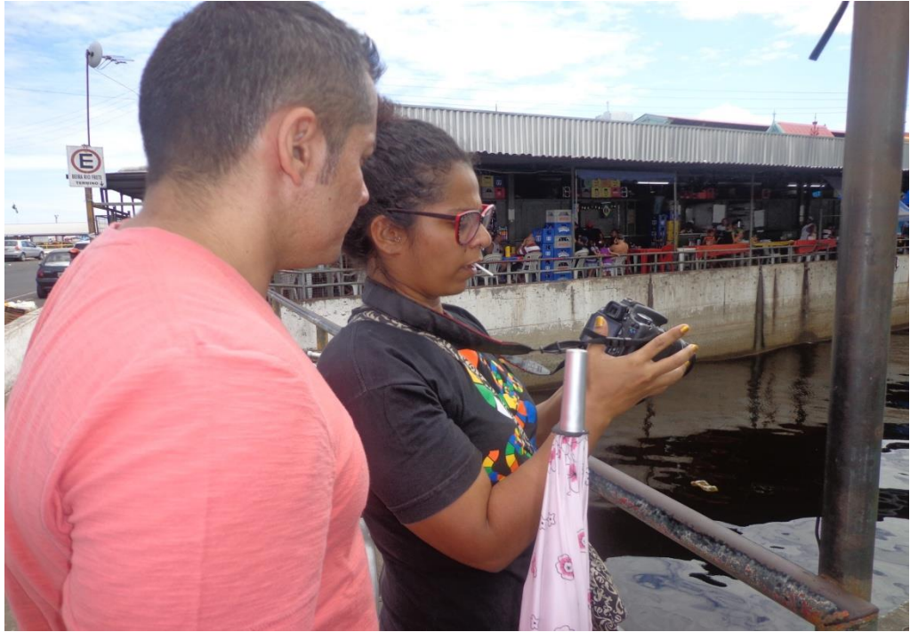
Imagem de gravação- Feira da Manaus Moderna -1ª Externa 23/06/2013