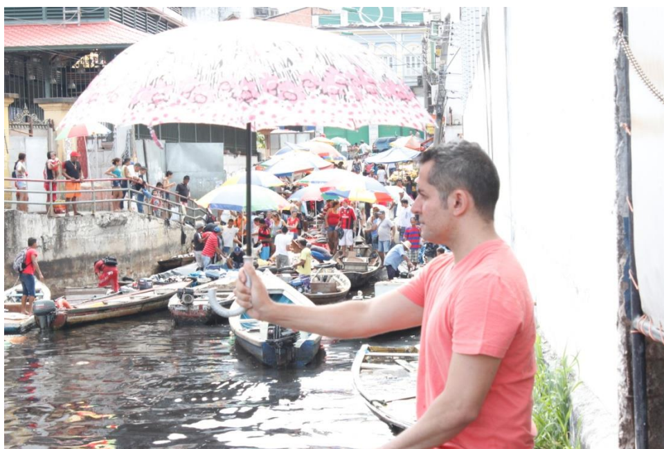
Imagem de gravação- Feira da Manaus Moderna -1ª Externa 23/06/2013