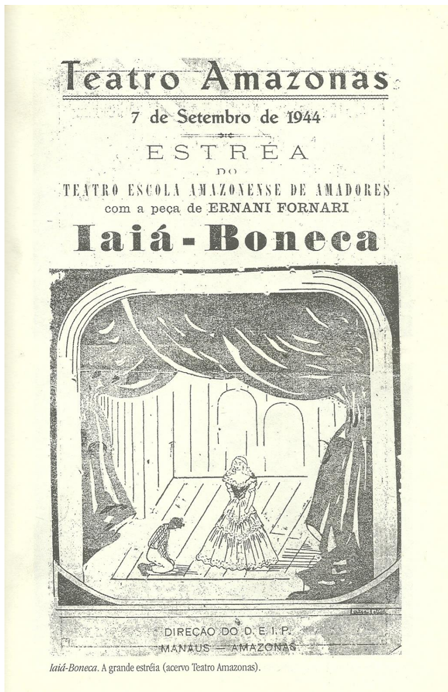
Figura 2. Iaiá- Boneca. A grande estréia. 1944.

Distante do que o teatro viveu, a literatura no Amazonas percorreu outros caminhos, buscando firmar-se dentro de uma regionalidade que pudesse acrescentar novos valores à cultura local, fato que encontramos na década de 1950, vinculados ao Clube da Madrugada.