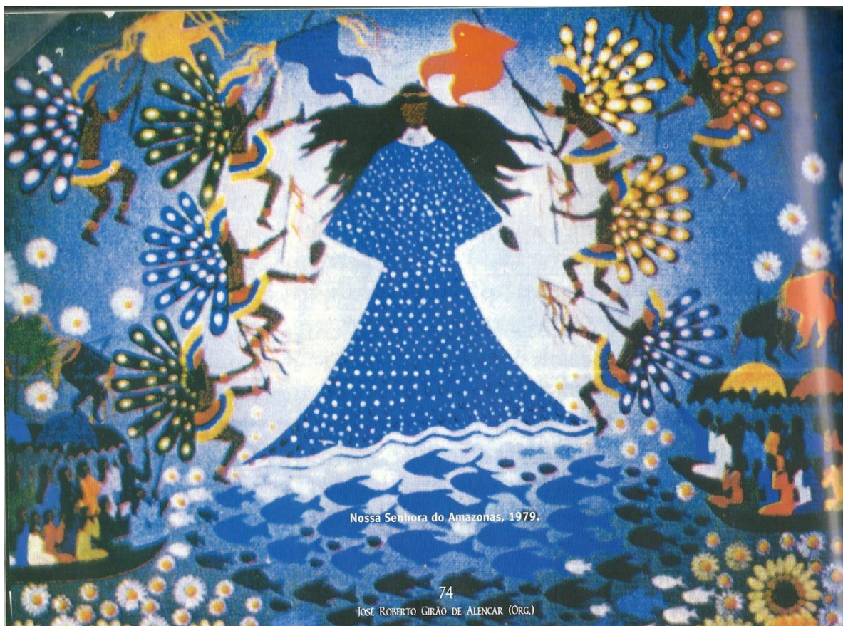
Figura 7. Nossa Senhora do Amazonas, de Moacir Andrade, 1979. Técnica de óleo sobre tela.

Iniciaremos nossa análise falando dos registros históricos e etnográficos sobre festas na Amazônia fazem referencia a um universo relativamente amplo, muitas delas relacionadas ao calendário festivo da igreja católica, enquanto datas alusivas aos santos católicos.