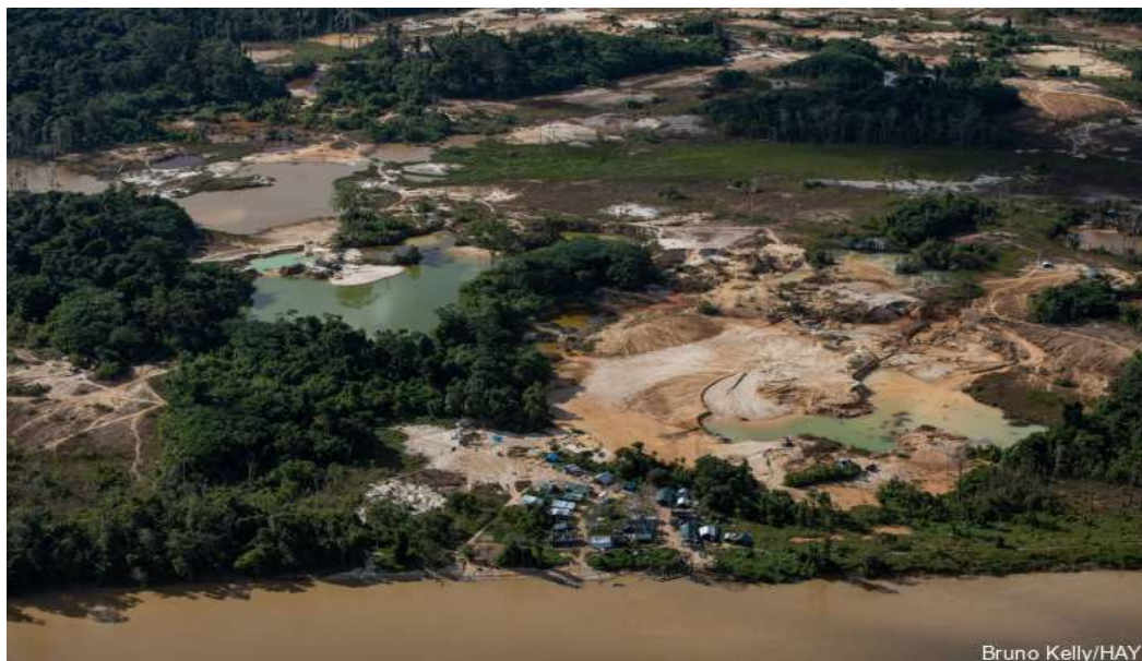
Figura 02- Cratera aberta pelos garimpeiros na tribo Yanomami, na região Uraricoera