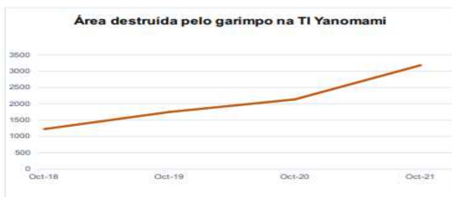
Figura 03 – Área da TIY devastada pelo garimpo de out de 2018 a out de 2021, SMGI

O gráfico demonstra que, desde o início do monitoramento, em 2018, a evolução do garimpo sobre o território do povo Yanomami atingiu mais 1.200 hectares, concentrando-se nas calhas dos rios Uaricoera e Mucajaraí. Posteriormente, essa degradação intensificou-se a partir do segundo semestre de 2020, dobrando-se em 2021, até alcançar o total de 3.272 hectares (HAY, 2022).