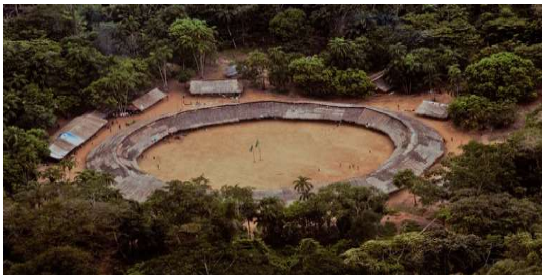
Figura 01 – Aldeia Yanomami (04.04.2023)

Na sociedade yanomami, há uma clara divisão de trabalho entre homens e mulheres. Tradicionalmente, os homens da tribo ocupam-se com atividades como caça e pesca, já as mulheres ficam mais restritas às atividades voltadas para a agricultura. Nas tribos yanomamis, não há uma clara divisão de poder hierárquico, de modo que as decisões são tomadas em conjunto pela sociedade local.