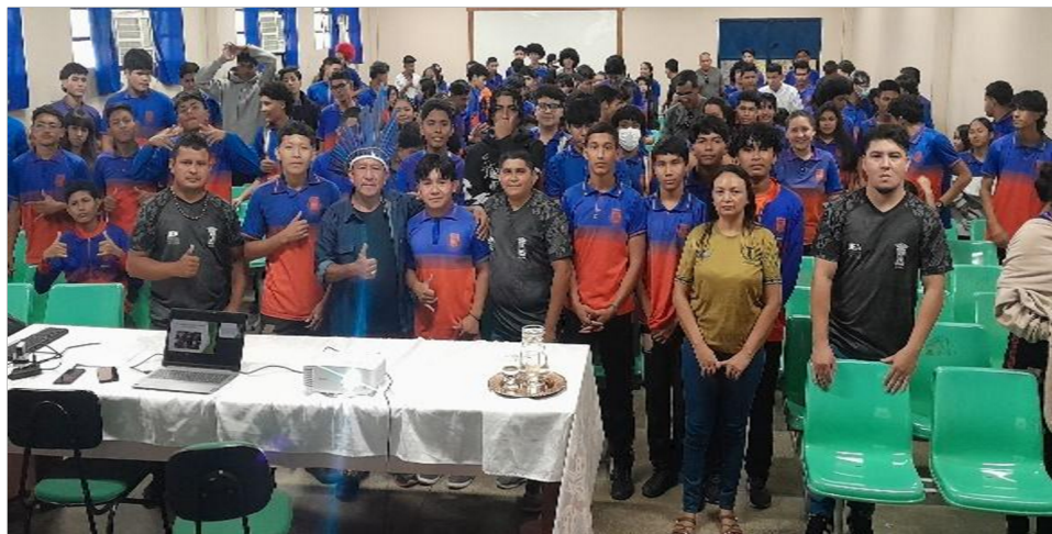
Foto 01: Participação dos alunos na Oficina Povos Originários, Saberes e Resistências”

Portanto, acredita-se que a aplicação da oficina, foi de grande relevância, sendo possível observar que os educandos se sentiram aguçados e engajados na apresentação e discussão da temática que fomentou a ampliação e construção de conhecimentos, reforçando a necessidade de ressignificar a data 19 de abril nas aulas de história, desmistificando narrativas arraigadas de preconceito e discriminação.