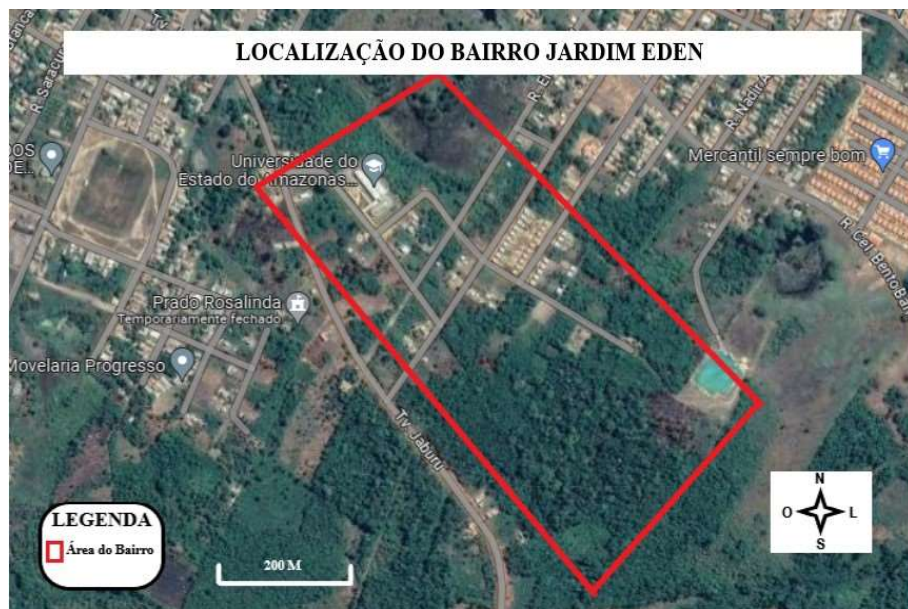
Figura 03: Bairro Jardim do Eden.

Fonte: Google Maps / Organizador: Paulo Duílio 2023.