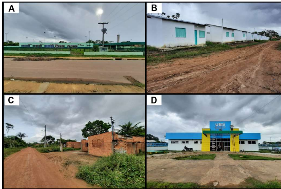
Figura 04: Mosaico Ilustrativo do Bairro Jardim do Eden.