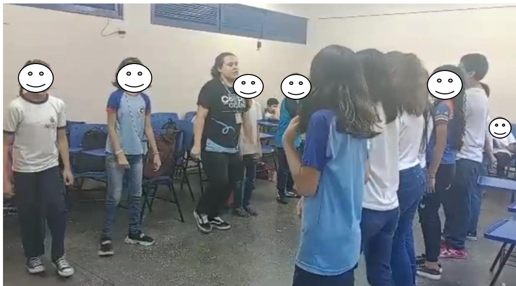
Imagem 4 – processo coreográfico

A dinâmica de início envolveu a todos que estavam em sala para um “telefone sem fio”, onde palavras relacionadas ao conteúdo abordado durante todos os encontros eram ditas até chegar no aluno da ponta algo parecido ou totalmente diferente do que foi dito. O suficiente para gerar risadas incessantes e um momento descontraído. Seguindo para a prática e composição final do que seria uma coreografia, a partir dos movimentos já passados nos encontros anteriores. A falta de atenção predominou durante todo o tempo restante, mas com o resultado, a sequência completa e a roda de conversa para aplicação do questionário com as mesmas perguntas e uma a mais para descrever sobre a autopercepção referente a socialização, autoestima e expressividade. Alguns participantes não quiseram responder, mas permaneceram atentos às palavras finais e ainda fizeram questão de agradecer pelo momento “legal” compartilhado entre pesquisador e a turma.