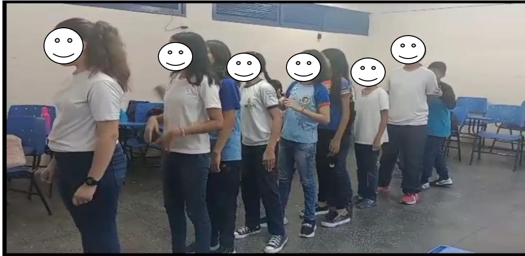
Imagem 5 – processo coreográfico

A partir desses encontros, suas observações e participações, foi possível acompanhar o desenvolvimento dos alunos participantes nas principais características elencadas no delineamento da pesquisa, sendo elas: