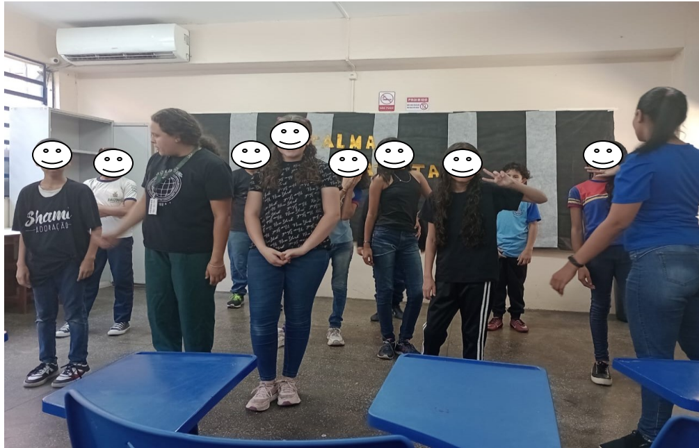
Imagem 1 – apresentação do processo coreográfico da matéria de PCDE.