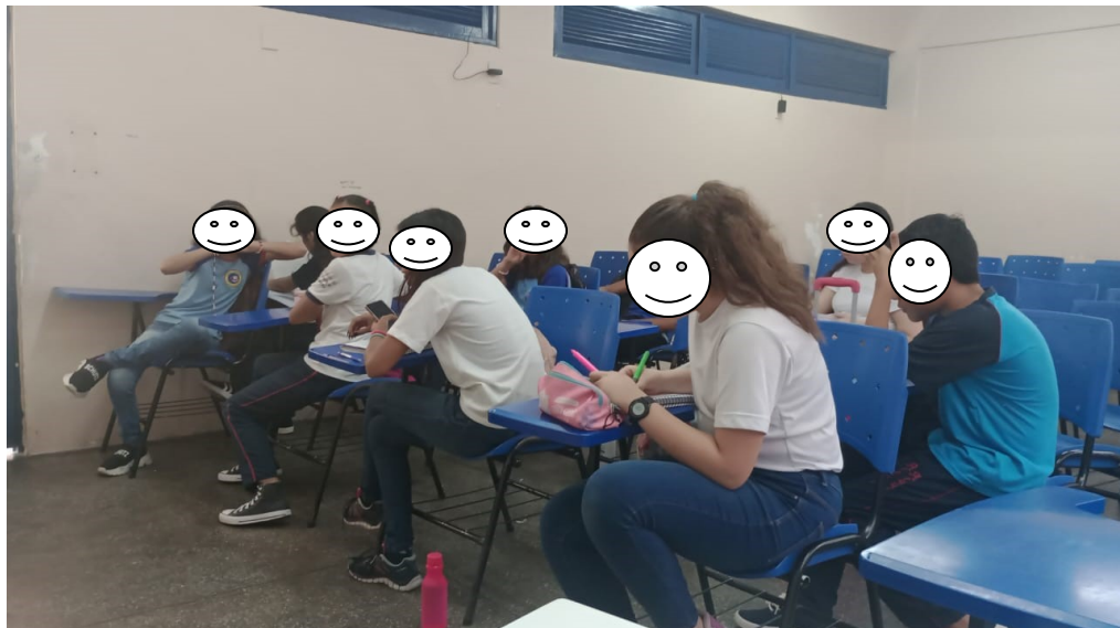
Imagem 2 – momento de conversa

Os estudantes realizaram sequências e exercícios que abordavam cada uma dessas qualidades, com músicas animadas e que estimulavam o momento de troca entre pesquisador e a turma. Sempre abrindo para perguntas e interagindo com questionamentos para verificar se o que era passado, era compreendido. Além dos momentos de improvisos na aula, onde o fator tempo foi abordado, todos formaram um círculo para acompanhar à medida que cada comando era dado para mudar a movimentação da rodada da vez. Seguindo a proposta de perceber como os participantes lidavam com a situação sem acordo prévio, demonstrando movimentos próprios ou aprendidos em alguma aula anterior. Esta foi a interação mais divertida, porém nesse dia não houve tanta participação, chegando a ser desgastante por precisar encontrar uma forma de fazer aquele momento um atrativo, mas muito bem aproveitado por quem realmente estava ali presente na roda.