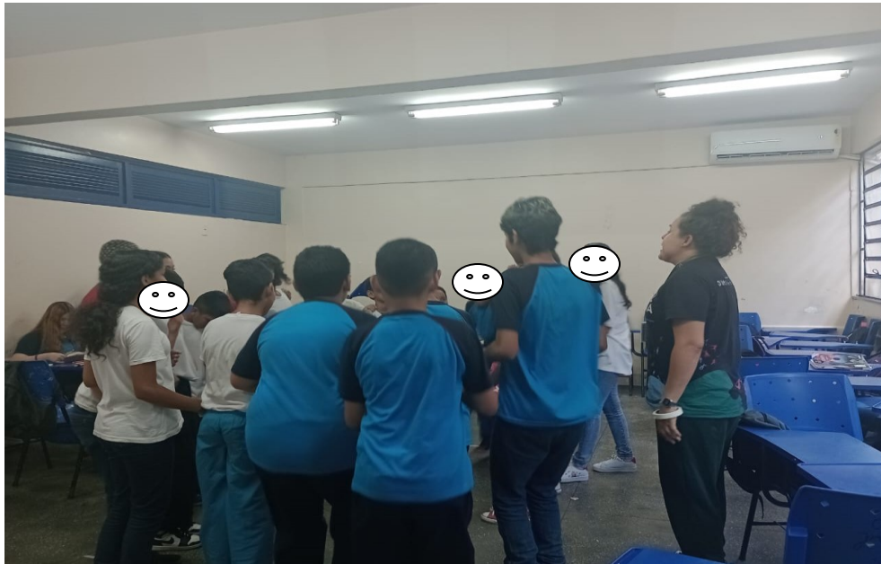
Imagem 3 – atividade de improviso em roda