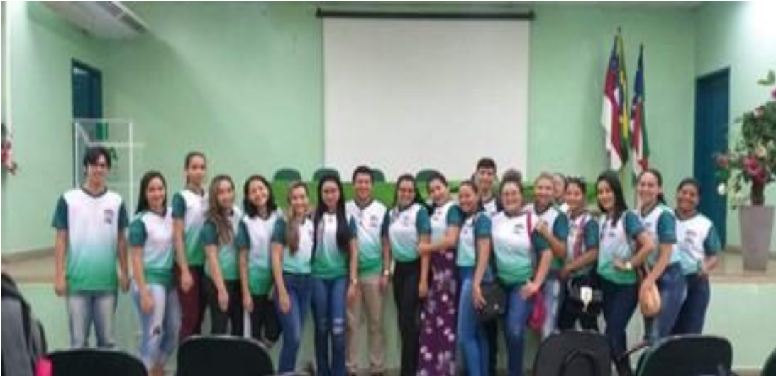
Figura 01: Reunião dos residentes