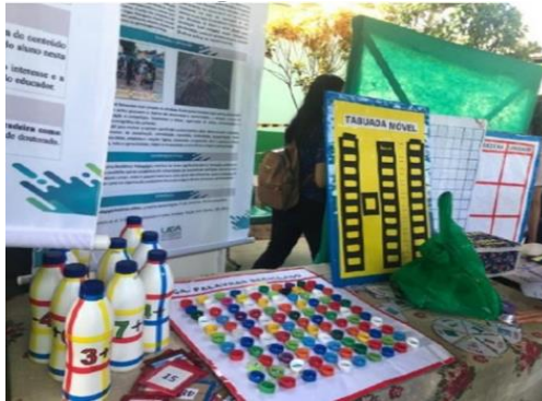
Figura 02: Exposição de banners