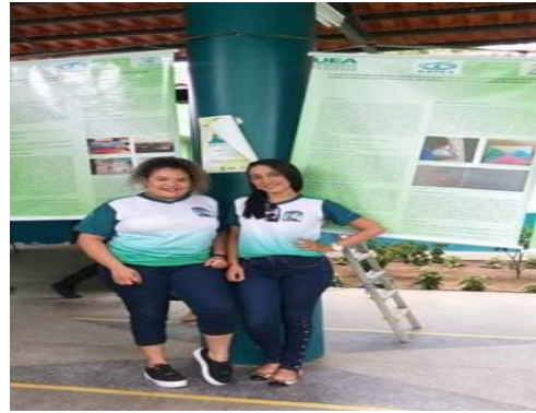
Figura 03: Apresentação dos resultados