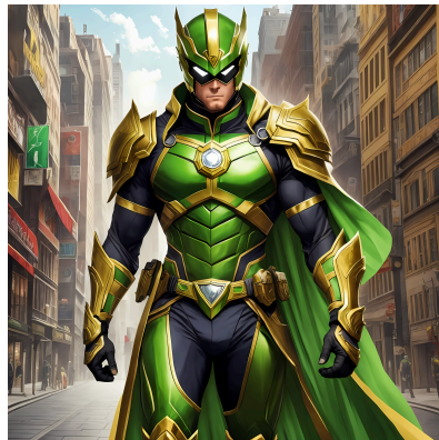
("Capitão Nacional" Imagem gerada por IA)

A obra conta a história de Brunu Brutus, líder de um movimento revolucionário chamado Plêiades que luta para proteger pessoas PCD's e neuro divergentes de um regime governado por uma inteligência artificial que tem o objetivo de definir um padrão de ser humano no país. Eles estão se preparando para uma guerra de narrativas, onde as "Plêiades" e o "Regime da Máquina" irão se enfrentar, além de outros grupos de narrativa que se intitulam como "Patriotários", "Lacradores" e "Isentões". No fim de tudo é revelado que Brutus sofre esquizofrenia e que imaginou tudo aquilo.