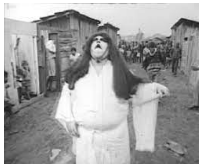
Figura 1- Samurai Maluco

Todos os pontos ali, as sátiras a um regime facista, um líder completamente bestializado e devoto às potências da época, figuras “Heróicas” e grotescas, além de animalidades aparecendo ali como o “Homem Coisa” ou um “Samurai Maluco” que está tentando ajudar crianças famintas de uma favela.