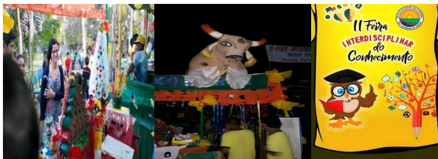
Figura 1: Feira interdisciplinar do conhecimento

Buscando a realização das práticas pedagógicas como uma forma de ensino, a escola Estadual “Nilo Pereira”, desenvolve juntos aos alunos, uma metodologia ativa, a realização de uma feira interdisciplinar do conhecimento (Figura 1), assim como a realização de plantio e cultivo de uma horta escolar, mantida pelos alunos e demais integrantes da escola, como funcionários, professores e gestor.