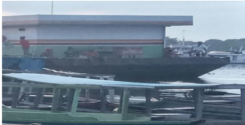
Figura 5: Crianças e adultos pescando em um flutuante