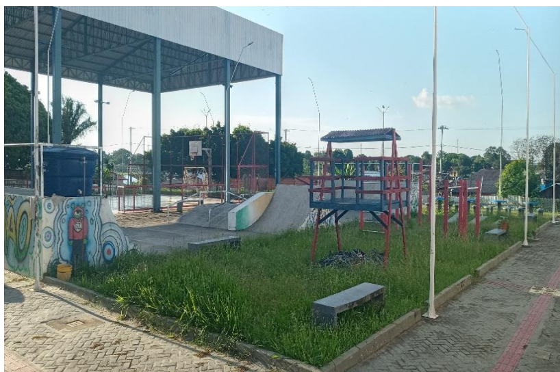
Figura 7: Estação Cidadania durante a pandemia.

Com os decretos estabelecidos para que não ocorresse aglomeração, o único espaço de lazer do bairro, teve seu funcionamento suspenso, com isso, a presença de crianças nas ruas tornou-se novamente comum. A Estação Cidadania João do Carmo ficou com funcionamento apenas externo, a presença de crianças não foi permitida, bem como de qualquer outra pessoa que não fosse funcionário do local.