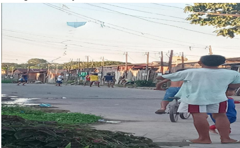
Figura 9: Crianças brincando em uma das ruas do bairro

Conforme Delgado (2014) os espaços apropriados pelos cidadãos, é mais que um espaço concreto, ele se torna parte de seu espaço, seu lugar, a partir das vivências, subjetividades e ressignificados.