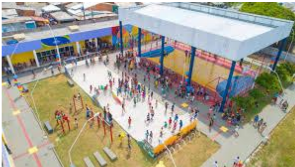
Figura 2: Estação Cidadania João do Carmo