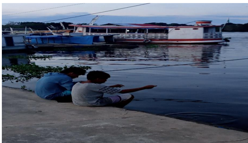
Figura 4: Brincando de pescar

O brincar em espaços urbanos que envolve o natural, tem sido cercado pelo medo, assim como nas ruas, muitos pais não deixam que seus filhos brinquem nas vias públicas por receio de um acidente, nas águas não é diferente, os riscos também são considerados grandes pelos adultos.