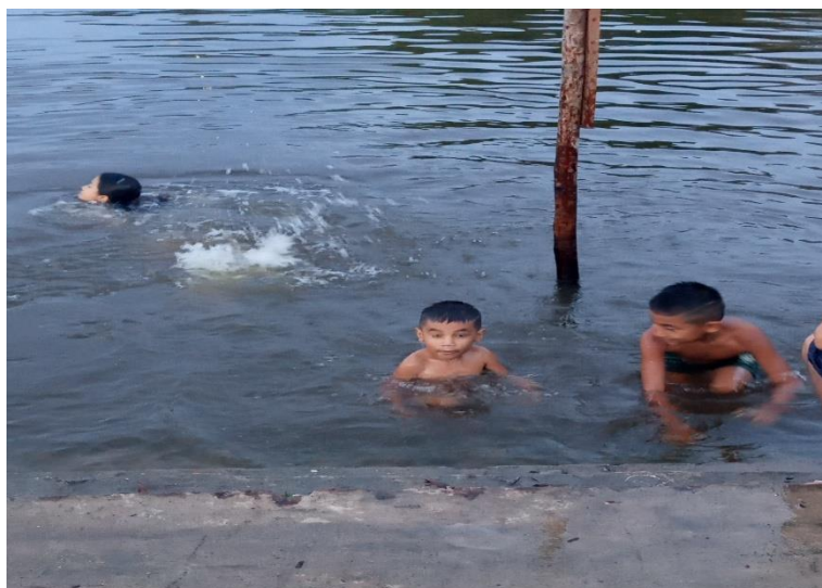
Figura 3: Brincadeira de pular n'água na orla do bairro.