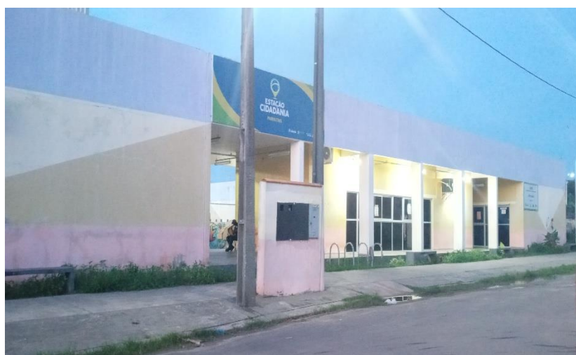
Figura 8: Frente da Estação Cidadania durante a pandemia

Com a figura 7, reafirmamos o que Tonucci (1997) fala sobre o brincar em espaços públicos durante a pandemia, onde a criança não pode viver as experiências fundamentais para o seu desenvolvimento. Experiências estas que caracterizam-se como a aventura, a emoção e o risco.