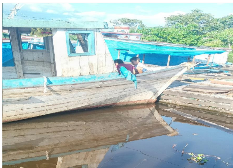
Figura 6: Brincando em embarcações

Durante as observações, avistamos crianças brincando dentro de embarcações que ficam atracadas sob responsabilidade dos donos de flutuantes, fazendo de brinquedo, objetos ali descartados.