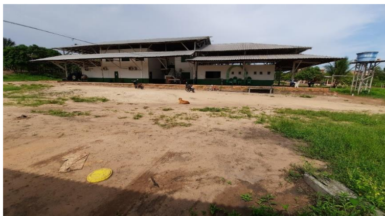
Figura 1: Sede da Acorjuve