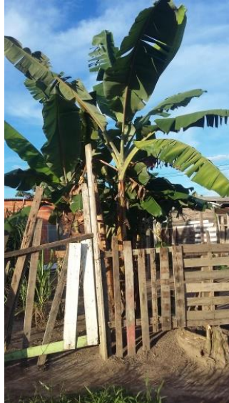
Figura 2: Biodiversidade dos quintais.