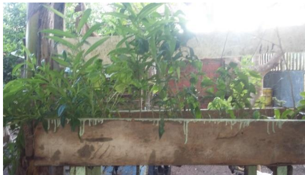
Figura 8: Canteiro suspenso com plantação de pimenta de cheiro.

Já as plantas medicinais são usadas para o tratamento de pequenas doenças, descritas pelos moradores principalmente as respiratórias e estomacais. “Essa utilização de plantas medicinais para o tratamento de doenças é denominada fitoterapia. Atualmente há cerca de 150 plantas fitoterápicas reconhecidas pela Organização Mundial de Saúde [...]” (MACHADO 2002).