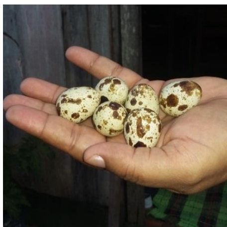
Figura 10: Ovos de codorna na mão da moradora.