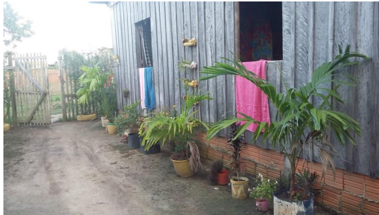
Figura 7: Diversidade de espécies ornamentais.

Plantadas principalmente ao lado ou em frente às casas, as ornamentais são cultivadas geralmente em vasos, latas, baldes e outras diretamente no solo. As ornamentais, com as suas flores contribuem com a estética e beleza das casas, além perfumarem o ambiente. Entre as plantas ornamentais que dão o tom colorido destacamos as papoulas, roseiras e laço de menina presentes na maioria dos quintais visitados.