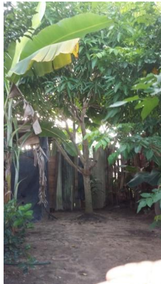
Figura 3: Biodiversidade dos quintais.