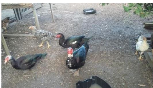
Figura 6: Criação de pato no quintal da moradora.

Além das espécies domésticas que convivem diariamente ao redor das moradias, estão também às domesticadas, espécies silvestres criadas juntamente no quintal com as demais espécies. O papagaio, a codorna, o tracajá e a marreca são exemplos de espécies de animais domesticadas encontradas nos quintais. Os animais vivem dentro dos cercados com exceção do papagaio que desfruta de certa liberdade, podendo realizar pequenos voos diários pela redondeza. Também são companhias agradáveis no espaço do quintal porque representam parte da natureza no espaço urbano.