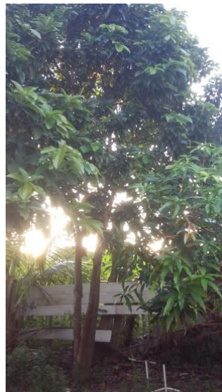
Figura 4: Biodiversidade dos quintais.