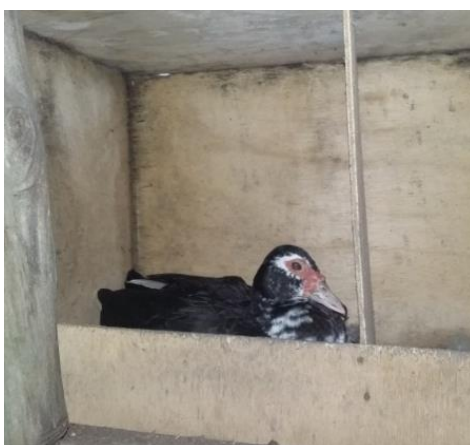
Figura 9: Pato em fase de reprodução.

A criação de codorna também foi um dos animais domésticos encontrado em um dos quintais e que contribuem com a renda familiar, através da produção e comercialização de seus ovos. Segundo os moradores os ovos e as aves são vendidos apenas para vizinhos ou parentes, prevalecendo a subsistência alimentar como principal contribuição das aves para economia das famílias.