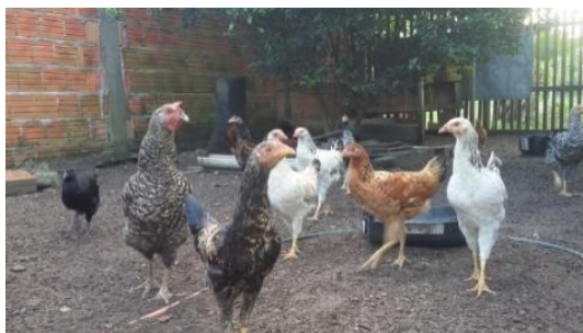
Figura 5: Criação de galinha no quintal da moradora.

comemorações especiais, como aniversários e festas religiosas. Observamos que algumas famílias reorganizaram o espaço do quintal para conciliar as duas atividades, cultivos e criações. Assim, identificamos a construção de cercados dotados de galinheiros para a criação e reprodução das aves. Ficando o restante do quintal destinado aos cultivos diversificados.