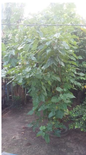
Figura 11: Cultivo de amora.

Segundo a senhora Maria nos revelou que cultiva um pé de amora figura 11, planta medicinal bastante procurada e valorizada o que proporciona um ganho econômico com a comercialização dos frutos, contribuindo assim, para a compra de outros gêneros alimentícios para a família.