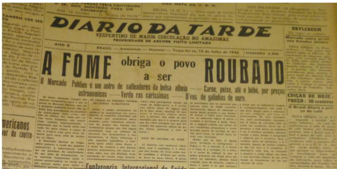
Fonte: Diário da Tarde. 16 de julho de 1946, terça-feira, nº 3.306, ano X.

Nos anos da Segunda Guerra Mundial, na cidade de Manaus foram adotadas medidas como: manter hortas, tendo em vista que a alimentação era uma carência real; campanhas como a do alumínio e do zinco. Toda a população deveria participar dessas ações que eram conhecidas como “esforço de guerra”, atitude considerada como patriótica e que todos os cidadãos deveriam seguir. Também se acreditou que era conveniente preparar a população a se defender de possíveis ataques aéreos de inimigos.