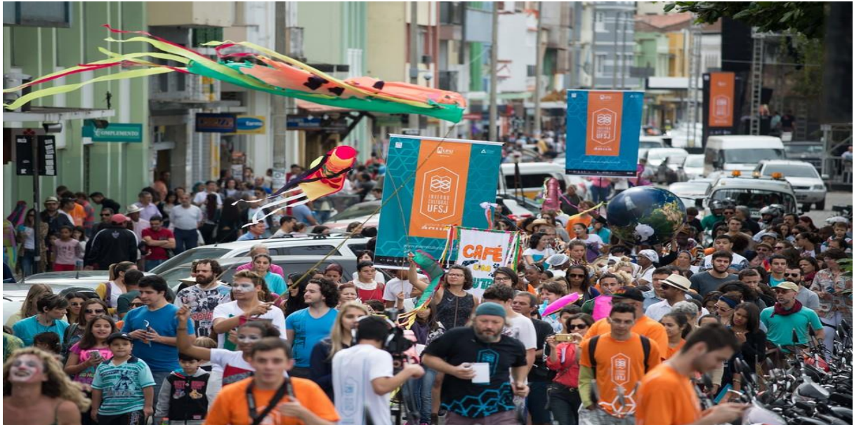
Figura 7. Dezenas de shows e atividades artísticas e culturais são realizadas em São João Del-Rei e em outras cidades de Minas Gerais, durante os nove dias do evento Inverno Cultural

aproximação entre o público e os artistas, objetivando diálogo entre realidades distintas e a ficção (XICATTO, 2008, p.7).