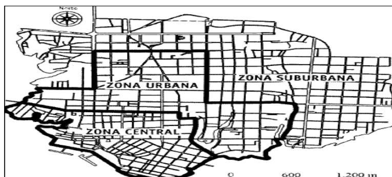
Figura 12. Planta do zoneamento de Manaus, 1951.

Na tentativa de racionalizar e compreender esse avanço urbano, foi criada a Lei nº 367, de 1951, que promoveu um novo zoneamento da cidade de Manaus.