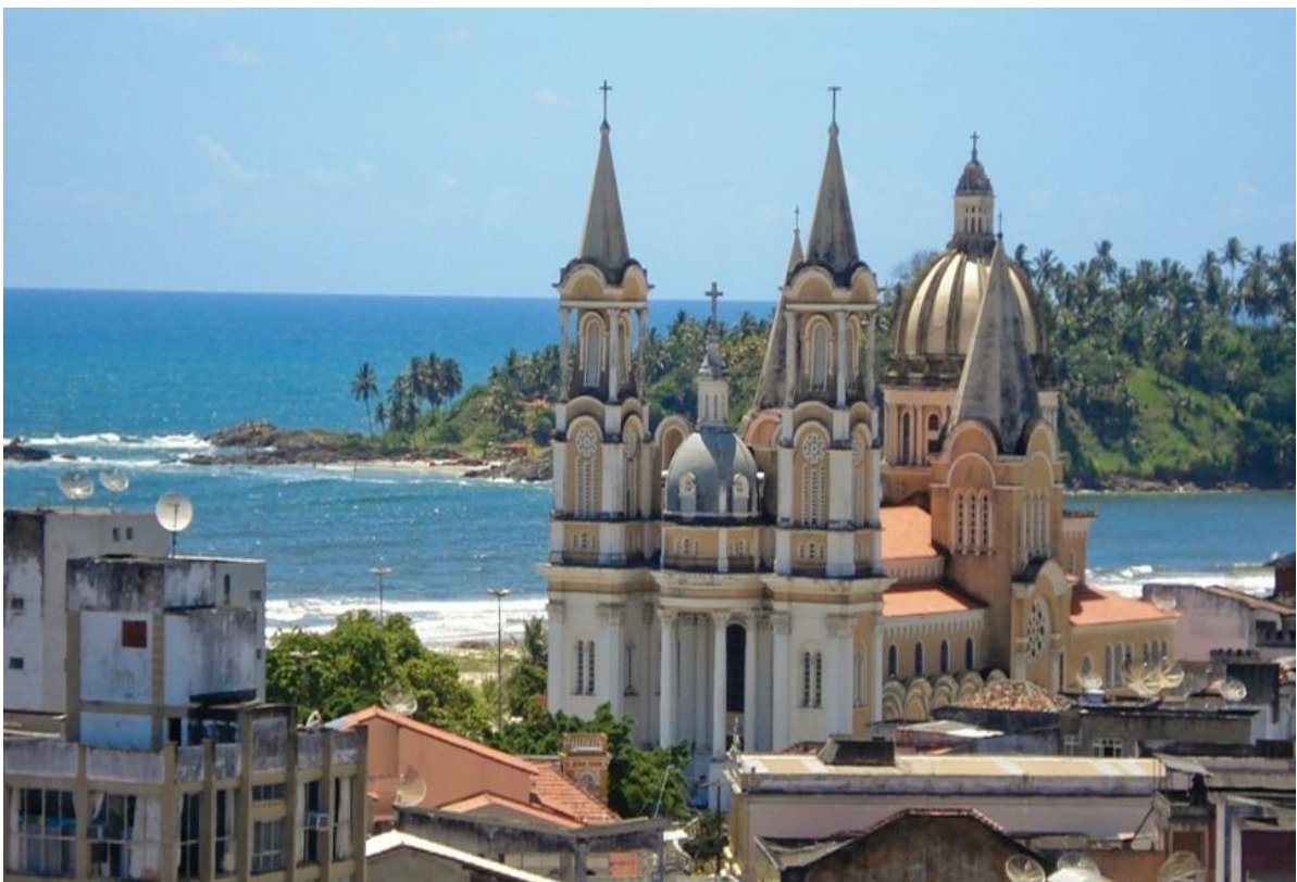
Figura 8. Ilhéus- Bahia.

A cidade de Ilhéus, na Bahia, é cenário do romance “Gabriela Cravo e Canela” do autor Jorge Amado. Localizado no litoral sul baiano, a cidade mantém viva a ambientação dos contos do literato, sendo um importante exemplo de como uma cidade soube relacionar Literatura e Turismo e vive turisticamente das memórias do escritor.