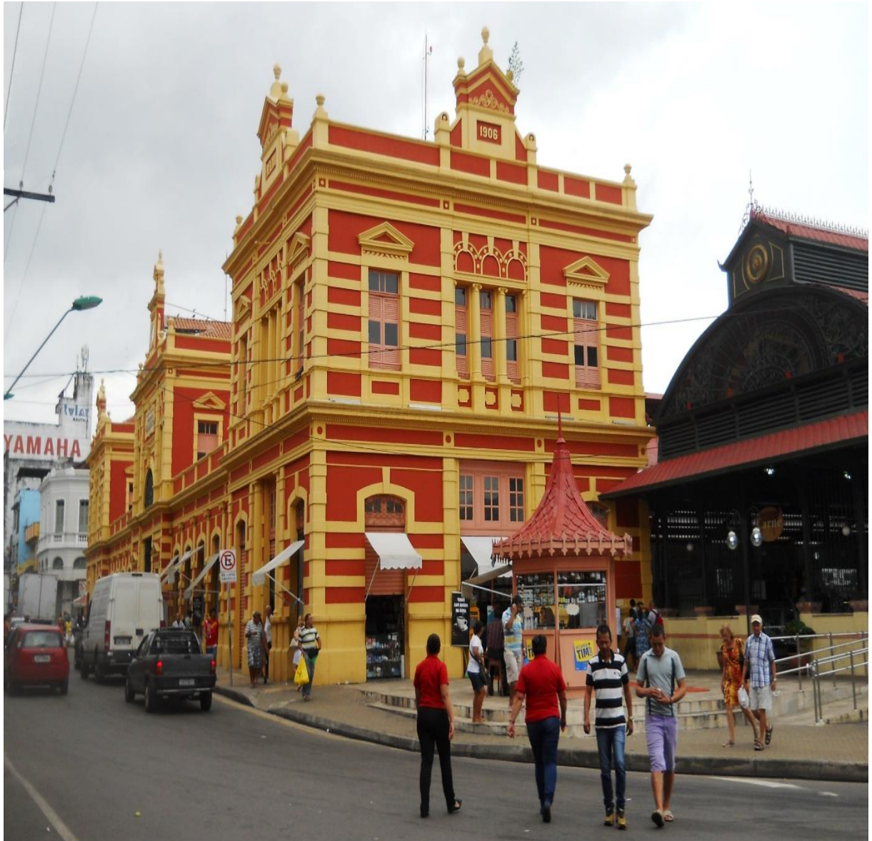
Figura 18. Mercado Municipal Adolpho Lisboa.

De acordo com Mesquita (2006) no final da década de 80, “o conjunto sofreu uma série descaracterização de seu entorno, ao ser contornado por uma avenida do projeto ‘Manaus Moderna’, mudou-se a paisagem, isolando-o do rio Negro”.