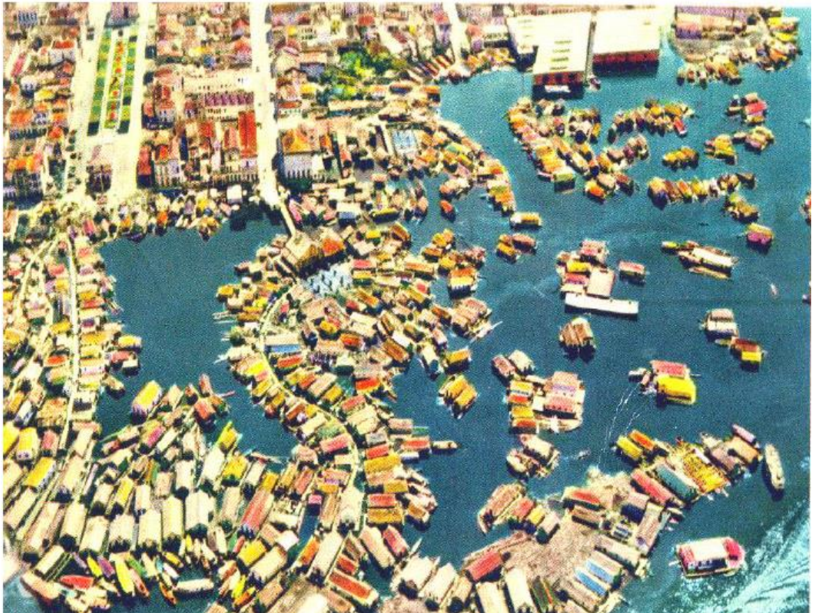
Figura 13. Postal de Manaus – Cidade Flutuante no Rio Negro.

Souza (2010) informa que, a cidade de Manaus foi se formando gradativamente pelo extenso litoral, e durante os anos cinquenta, a “Cidade flutuante” se tornou um fenômeno social e urbano, formada pelas culturas próprias do local, onde as águas sempre foram uma característica marcante na vida dos moradores, conhecidos por ribeirinhos.