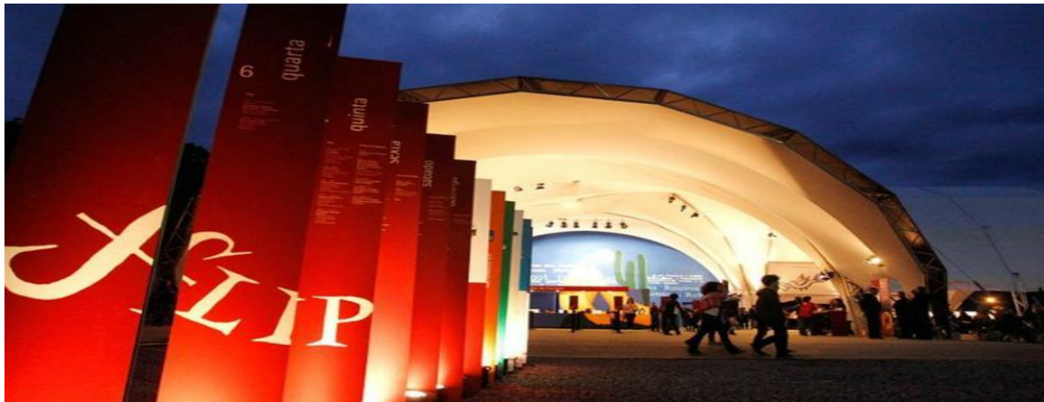
Figura 2. FLIP, 17ª edição, 2019