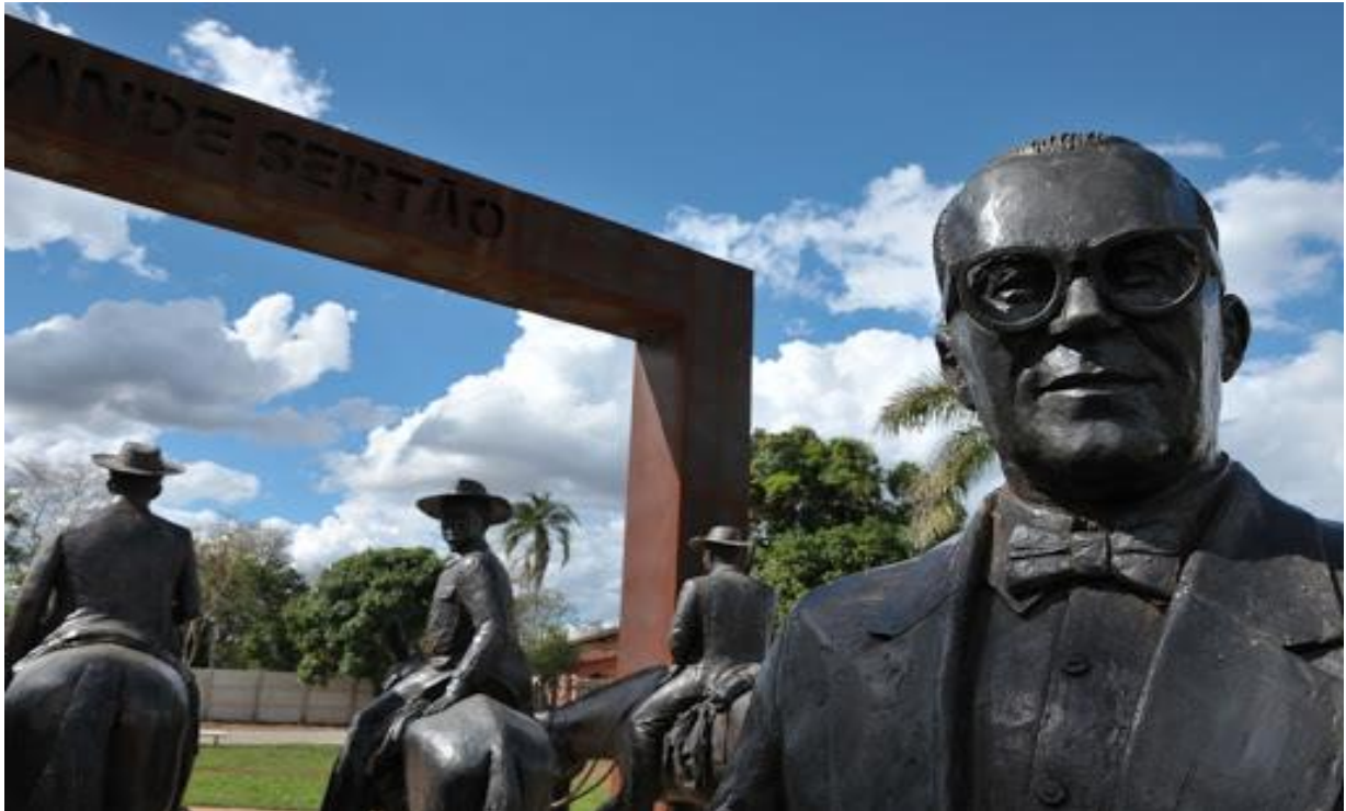
Figura 6. Portal Grande Sertão, cuja composição remete à histórica cavalgada de Guimarães Rosa.

escolas e residências. Dessa forma, pode-se vivenciar tudo o que se imaginou através dos contos, prosas e poemas, por meio da atividade turística, pois a cidade aproximase de uma cidade temática. (BARROS, 2008, p. 9).