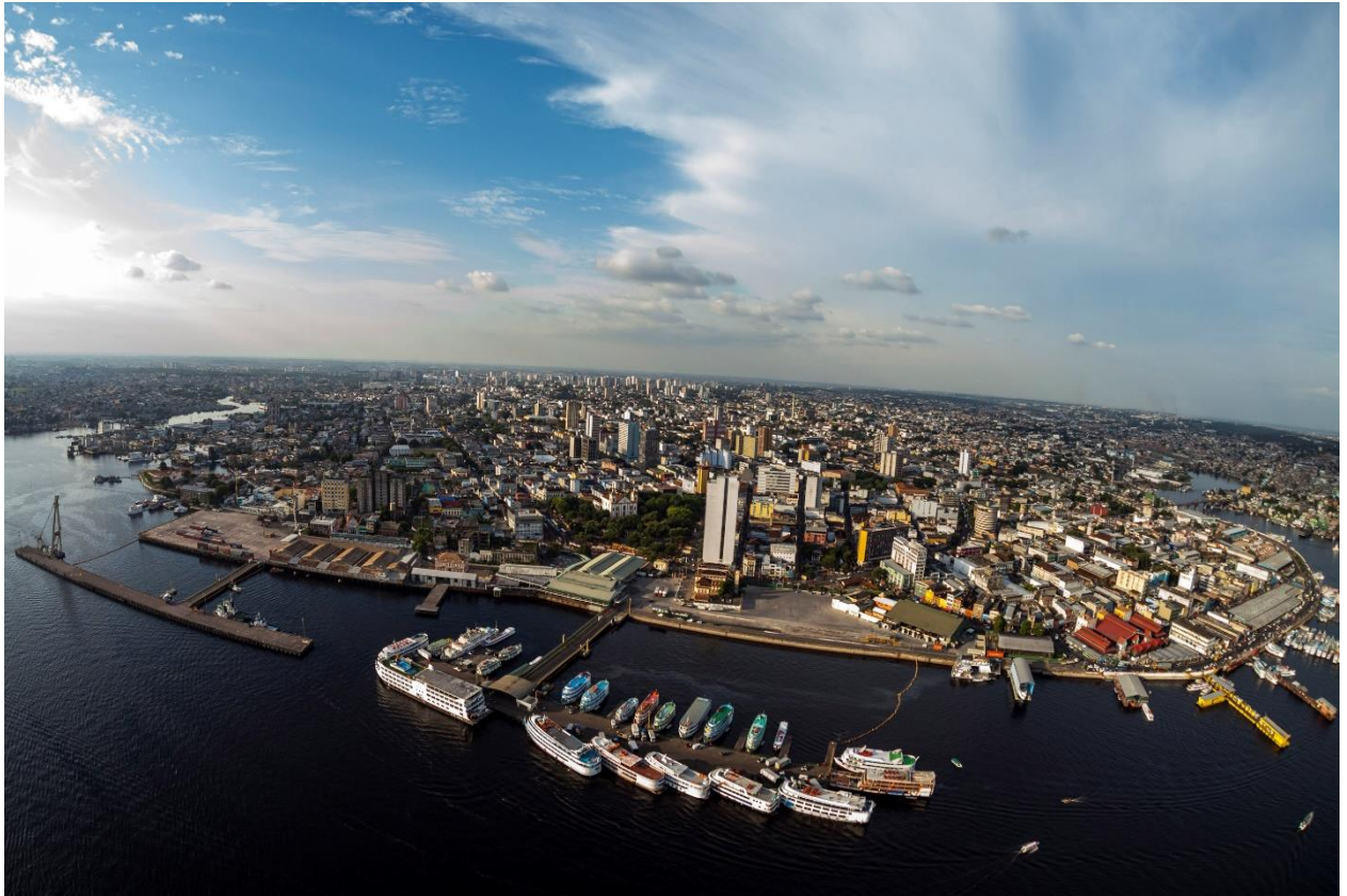
Figura 16. Vista panorâmica aérea do Porto de Manaus