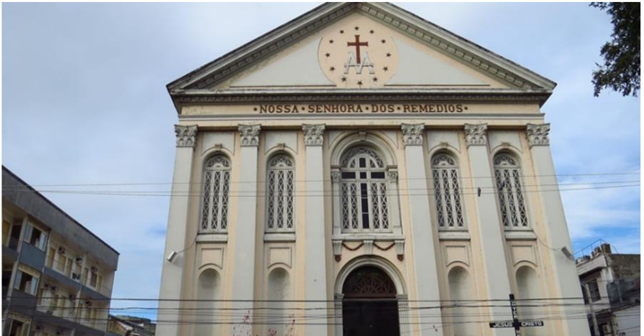
Figura 15. Igreja dos Remédios