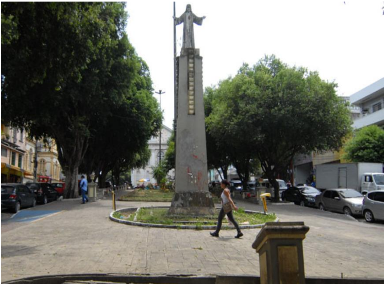
Figura 14. Praça dos Remédios

Em outubro de 2014, a praça fez parte do projeto de revitalização do patrimônio histórico do centro de Manaus, sendo contemplada pelas obras de revitalização (AMAZONAS.AM, 2014).