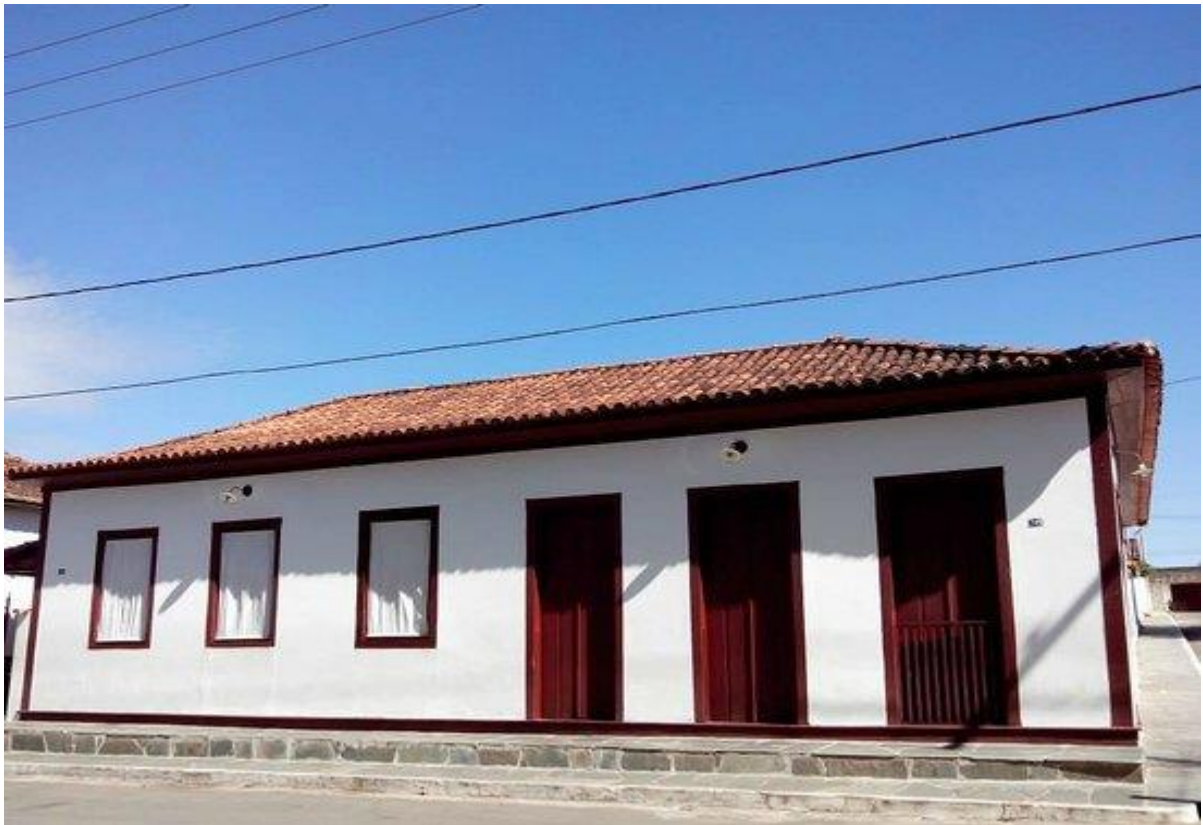
Figura 5. Museu Casa Guimarães Rosa.

O destaque da Semana Roseana é o circuito turístico Guimarães Rosa, que é formado por treze municípios próximos entre si, e se unem para explorar turisticamente os patrimônios históricos, culturais, naturais do Estado de Minas Gerais. Dentre os atrativos mais famosos estão o museu casa Guimarães Rosa, em Cordisburgo, e nele estão os contadores de estórias Miguilim, que narram trechos da obra do autor; O memorial Manuelzão, localizado no distrito de Andrequicé, no município de Três Marias, onde fica o acervo das estórias e vida do autor; o morro da Garça, que é o morro testemunho e cenário do conto “o recado do morro” de João Guimarães Rosa.