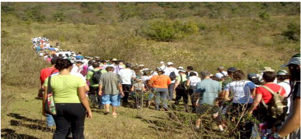
Figura 4. Caminhada Eco literária revive “Grande Sertão: Veredas”, com a narração do grupo Caminhos do Sertão enquanto percorrem os sertões literários de João Guimarães na Semana Roseana.

A Semana Roseana, também um dos eventos no Brasil que estimula o Turismo Literário, é realizada desde julho de 1989, na cidade de Cordisburgo em Minas Gerais, terra natal do escritor João Guimarães Rosa. O evento oferece uma vasta programação com oficinas de pintura, caminhada eco literária, lançamento de livros, apresentações de teatro, dança, música, e apresentação dos contadores de Estórias Miguilins, que atuam como mediadores e narradores das histórias do literato ao público, e esta ação resulta na ampliação da percepção sobre patrimônio e sua importância no resgate da memória e identidade social. Mas, principalmente contribui para a divulgação das obras de João Guimarães Rosa, através de estudos e atividades culturais.