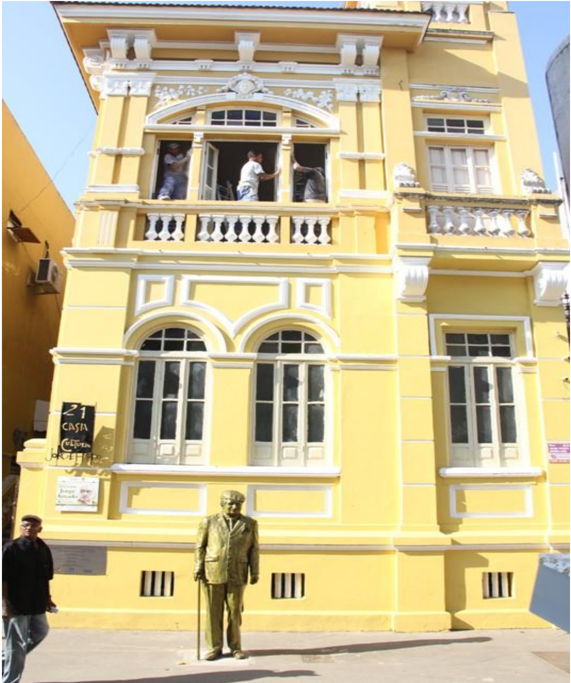
Figura 9. Casa de Cultura Jorge Amado, Ilhéus – Bahia.