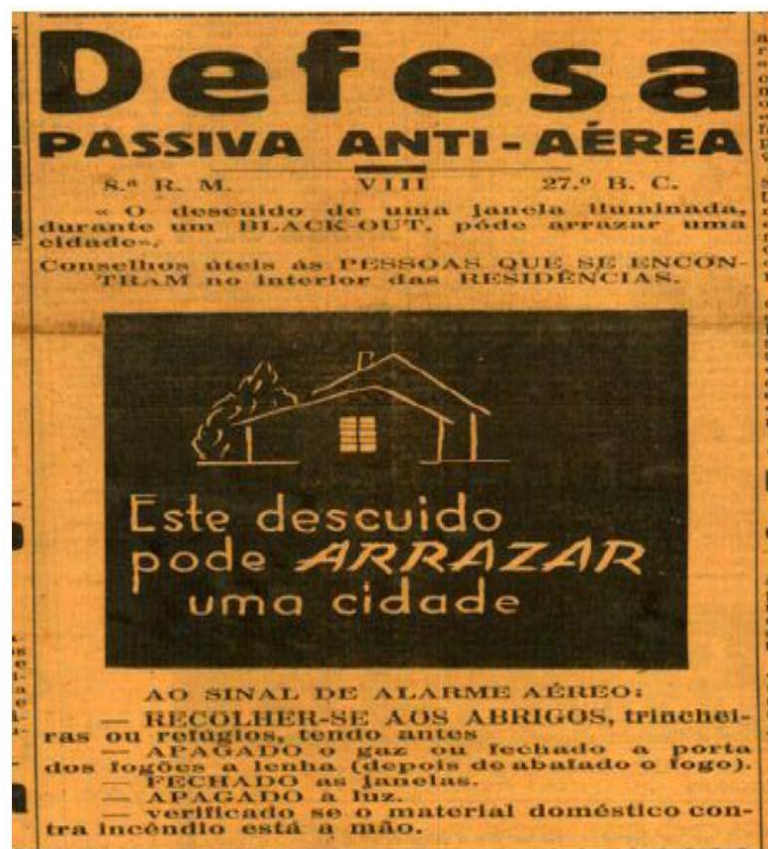
Figura 11. Jornal A TARDE, 04 de agosto de 1942, terça-feira, Nº 1.661, Ano VI.