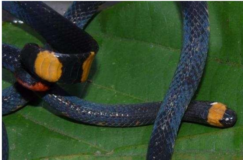
Figura 13: Indivíduos de Micrurus narduccii .

Nome popular: Coral-verdadeira-preta e branco.