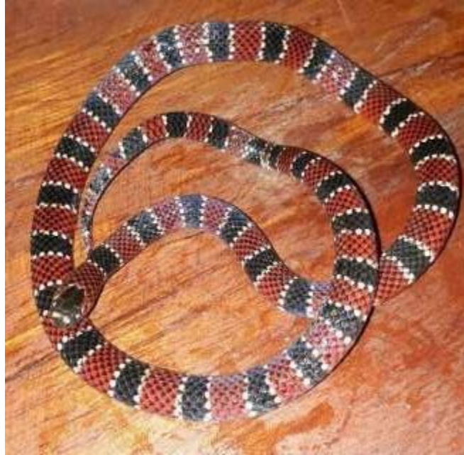
Figura 14: Indivíduos de Micrurus omatissimus .

Espécie: Micrurus omatissimus (Jan, 1858)