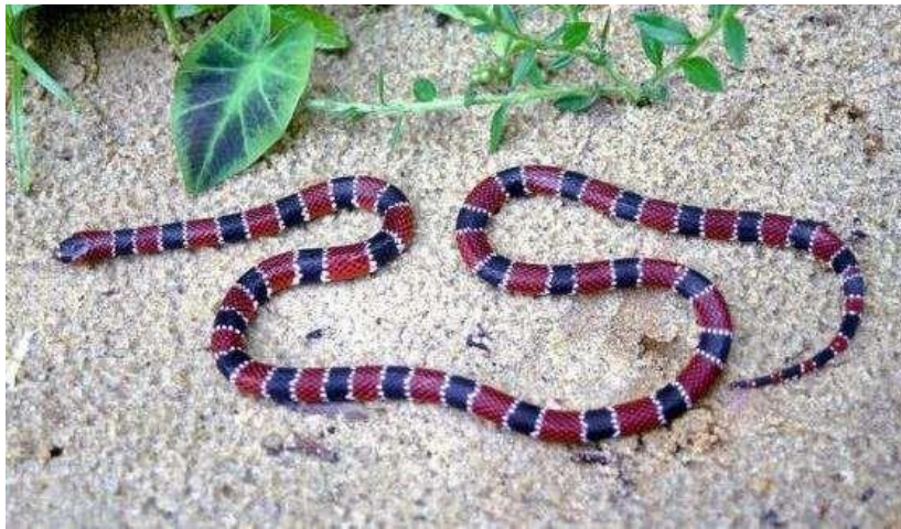
Figura 18: Indivíduos de Micrurus ticuna .

Espécie: Micrurus ticuna (Feitosa, Da Silva Jr, Pire, Zaher e Costa-Prudente, 2015)