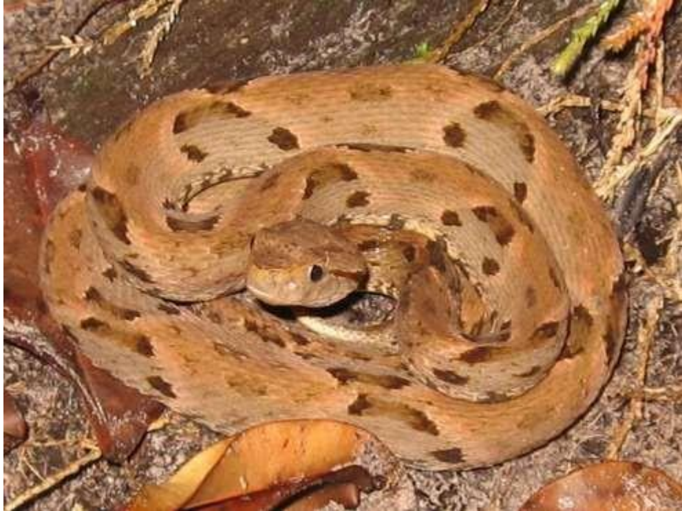
Figura 5: Indivíduos de Bothrops brazili .