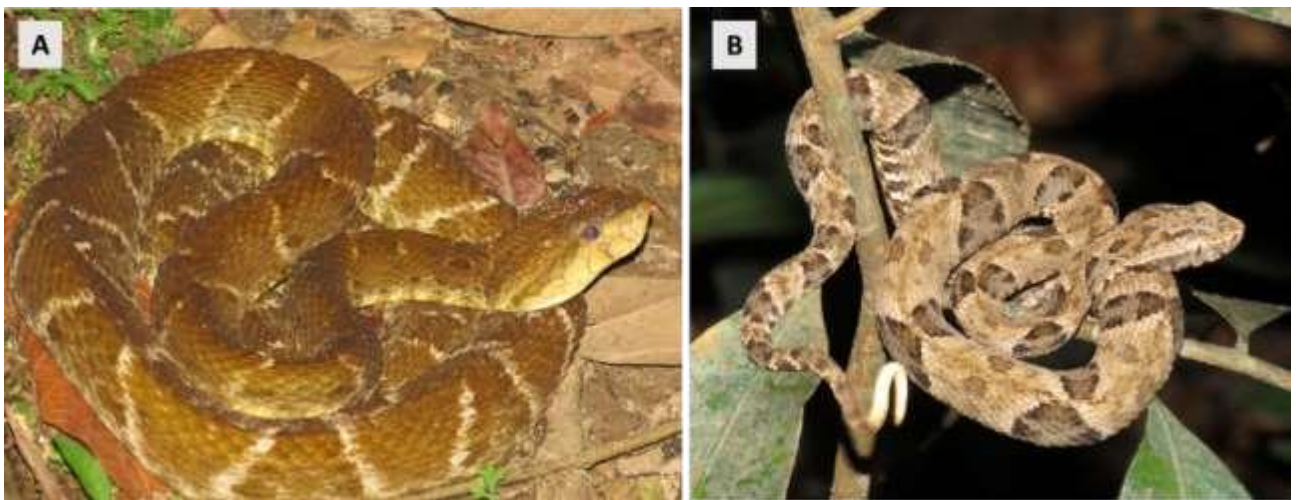
Figura 3: Indivíduos de Bothrops atrox . A – Adulto em atividade com corpo em S no chão. B – Juvenis com a ponta da cauda ainda branca e atividade sobre um arbusto.

Espécie: Bothrops atrox (Linneaus, 1758)