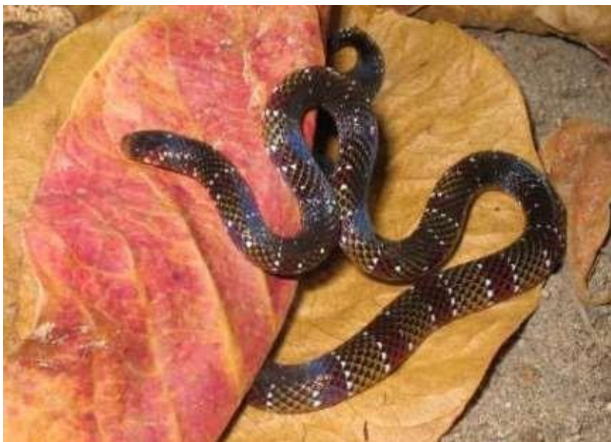
Figura 11: Indivíduos de Micrurus langsdorffii .

Espécie: Micrurus langsdorffii (Wangler, 1824)