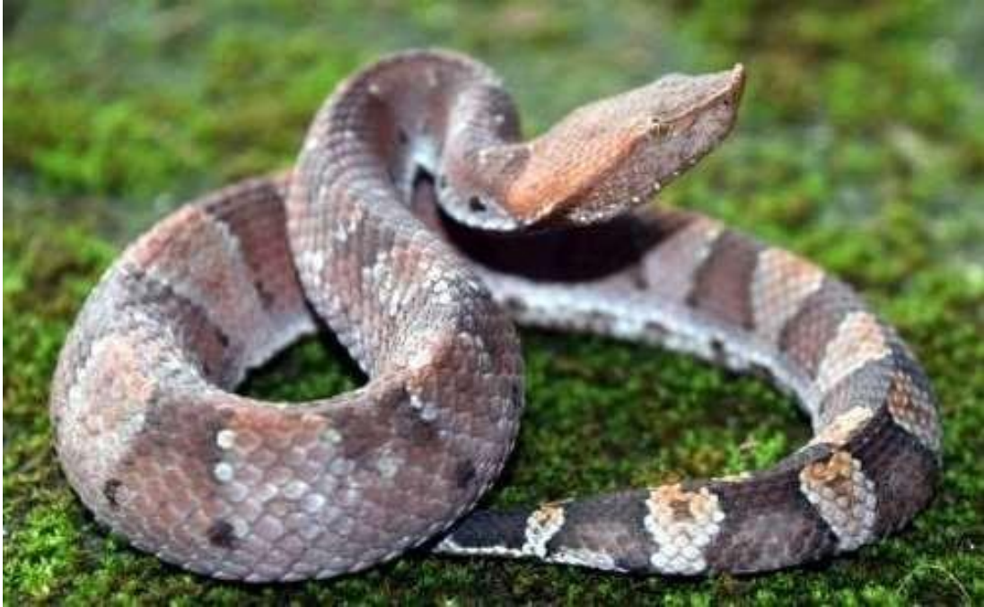
Figura 6: Indivíduos de Bothrops hyoprora .

Espécie: Bothrops hyoprora (Amaral, 1935)