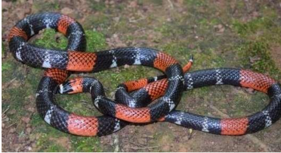
Figura 12: Indivíduos de Micrurus lemniscatus .

Espécie: Micrurus lemniscatus (Linnaeus, 1758)