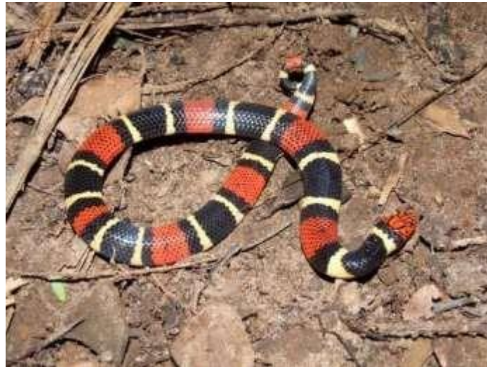
Figura 17: Indivíduos de Micrurus surinamensis .

Espécie: Micrurus surinamensis (Cuvier, 1817)