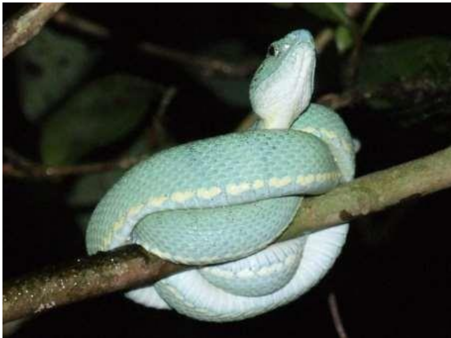
Figura 4: Indivíduos de Bothrops bilineatus .

Espécie: Bothrops bilineatus (Wierd, 1821)