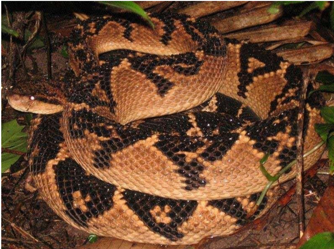
Figura 8: Indivíduos de Lachesis muta .

Nome popular: pico-de-jaca ou sururucu-pico-de-jaca.