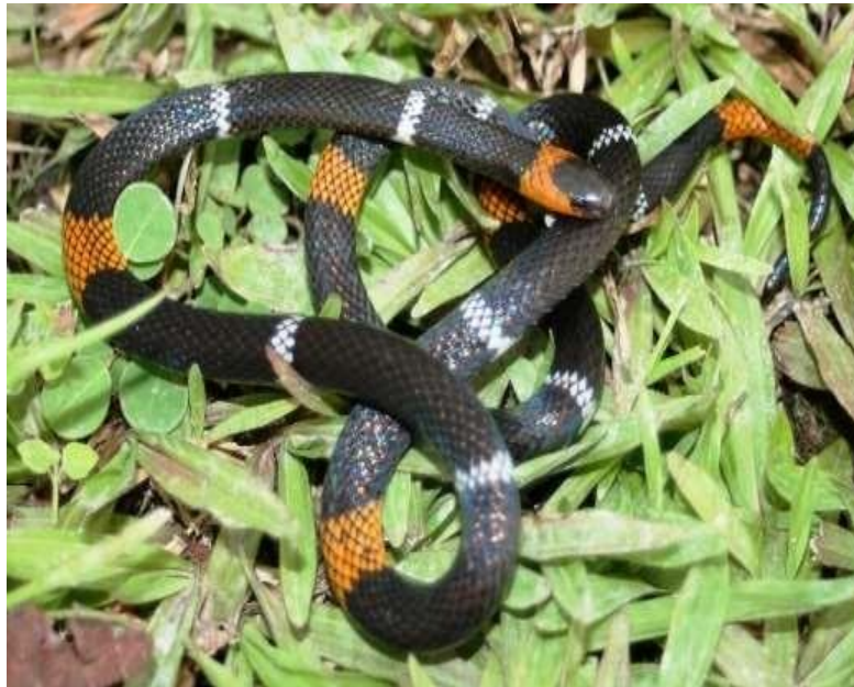
Figura 10: Indivíduos de Micrurus hemprichii .

Espécie: Micrurus hemprichii (Jan, 1858)