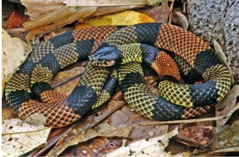
Figura 16: Indivíduos de Micrurus spixii .

Espécie: Micrurus spixii (Wagler in Spix, 1824)