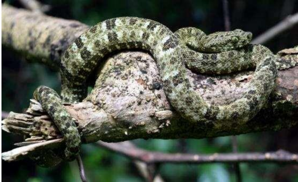
Figura 7: Indivíduos de Bothrops taeniatus .

Espécie: Bothrops taeniatus (Wagler in Spix, 1824)