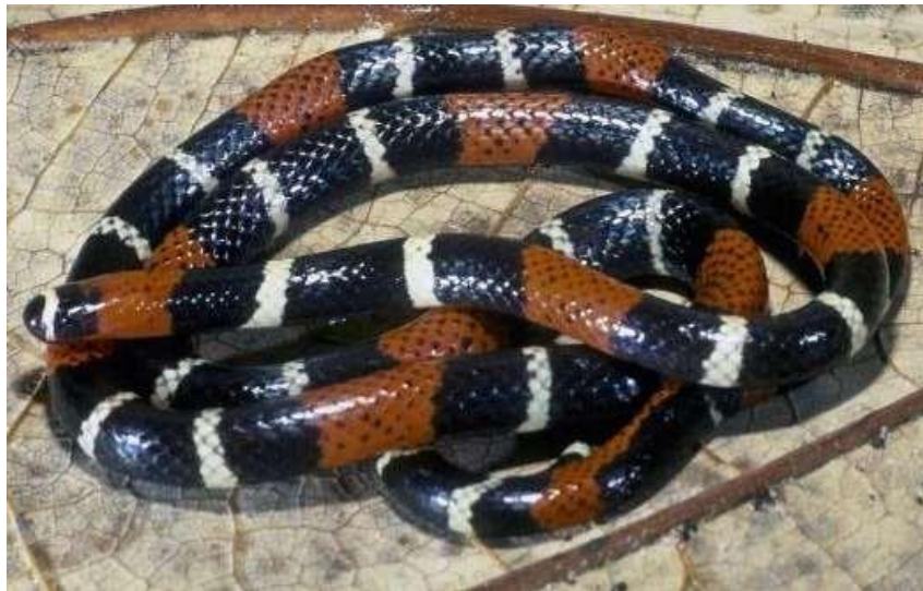
Figura 9: Indivíduos de Micrurus filiformis .

Espécie: Micrurus filiformis (Gunther, 1859)