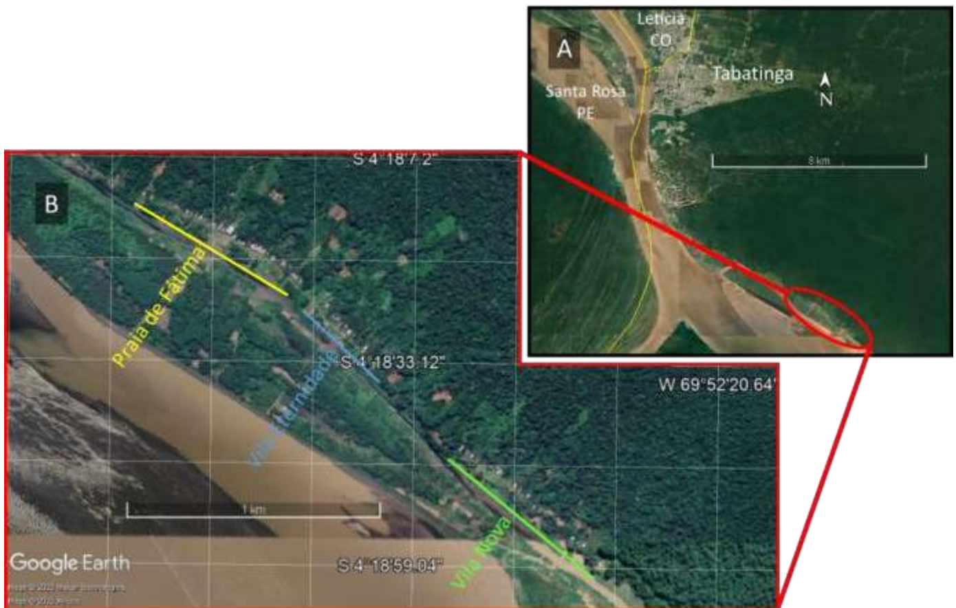
Figura 2: Localização das comunidades de Vila Nova, Vila Eternidade e Praia de Fátima na região do Alto Rio Solimões. Mapa, A imagem de satélite do município de Tabatinga/AM na tríplice fronteira Brasil/Colômbia/Peru e destaque em círculo vermelho a região das três comunidades. Mapa B, imagem satélite ampliada das três comunidades. Imagens extraída do Google Earth Pro (versão 7.3.2).

A comunidade de Praia de Fátima é uma comunidade não indígena e a maior das três comunidades, tendo uma extensão territorial da frente da comunidade de cerca de 600 m e uma distância 9,92 km de distância para o município de Tabatinga, é composta por 70 famílias e 145 pessoas entre crianças, adolescentes e adultos.