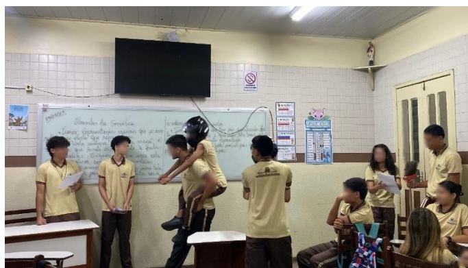
Figura 2 Estudantes fazendo a leitura dramática e encenando as narrativas de visagem