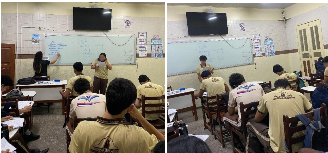
Figuras 3 Estudantes socializando suas narrativas de visagens

Na segunda aula, os estudantes foram convidados a criar suas próprias narrativas de visagens, baseando-se em suas experiências pessoais, memórias familiares e referências culturais locais. Essa etapa proporcionou um momento de escrita criativa, no qual os alunos puderam exercitar a autoria e o diálogo com sua identidade cultural. Em seguida, houve a socialização oral das produções, momento em que os alunos compartilharam suas histórias com a turma, exercitando a escuta sensível, o respeito às diversas vozes presentes e a valorização do repertório coletivo. Devido à limitação do tempo disponível, não foi possível que todos os alunos apresentassem suas narrativas em sala.