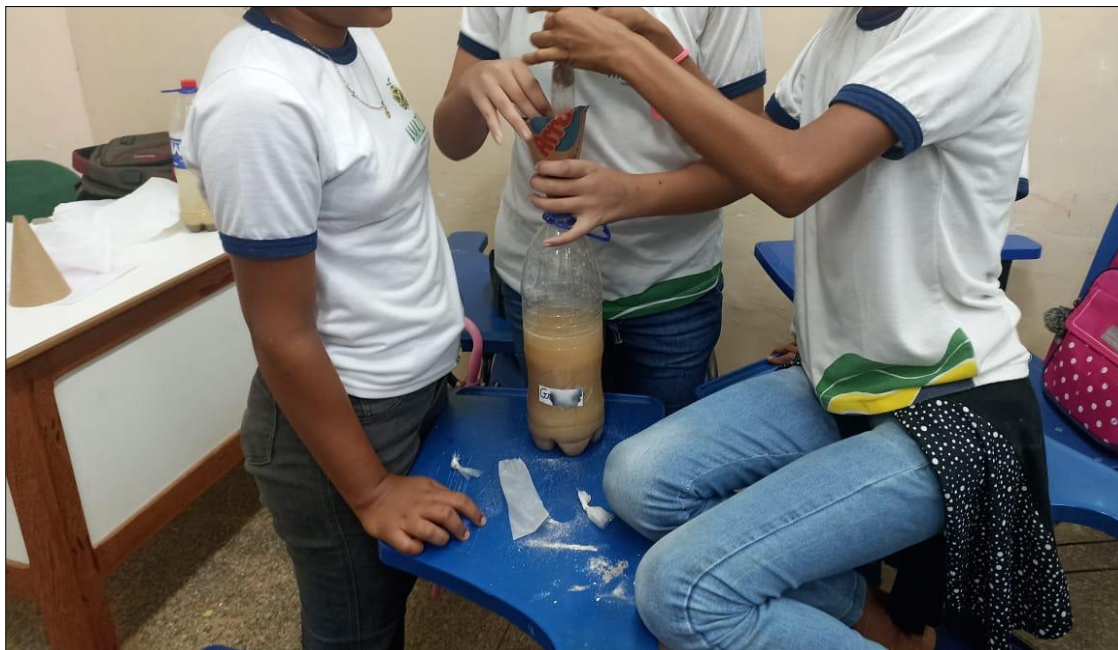
Figura 2: Atividade das oficinas realizada nas turmas 6º ano I e II