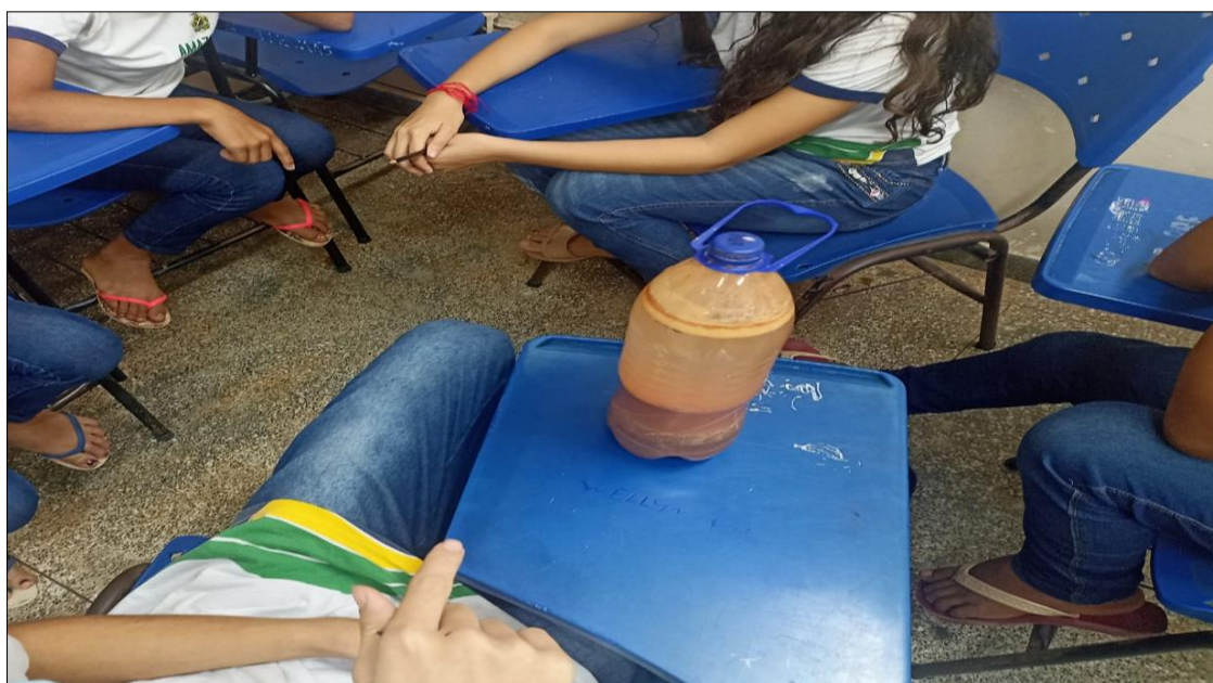
Figura 3: processo de decantação dos sedimentos após 2 dias