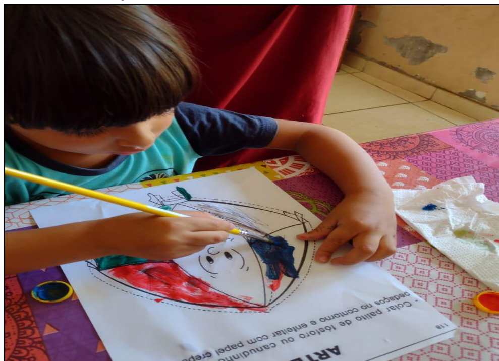
Figura 04: Realizando as atividades em casa