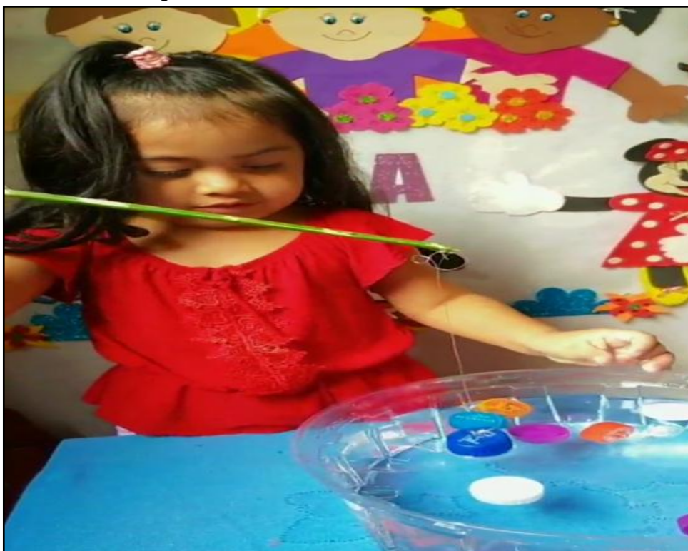
Figura 03: Realizando as atividades em casa