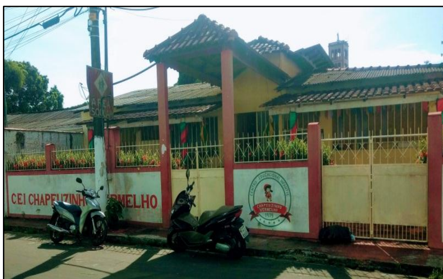
Figura 01: C.E.I Chapeuzinho Vermelho

Nossa investigação foi realizada através do grupo escolar de WhatsApp que foi criado para atender as crianças da turma do maternal do Centro Educacional Infantil Chapeuzinho Vermelho, que fica localizado na rua Cordovil, 357 no Centro da cidade de Parintins/AM. (Figura 01):