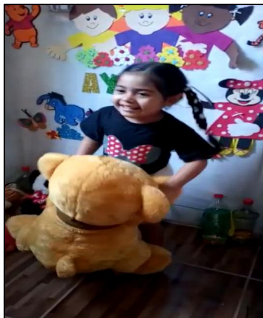
Figura 11: Brincando de cantigas de roda com o ursinho.