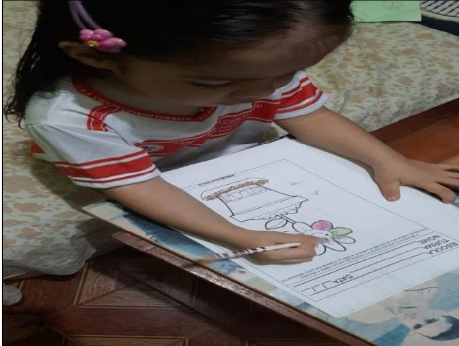
Figura 02: Realizando as atividades em casa