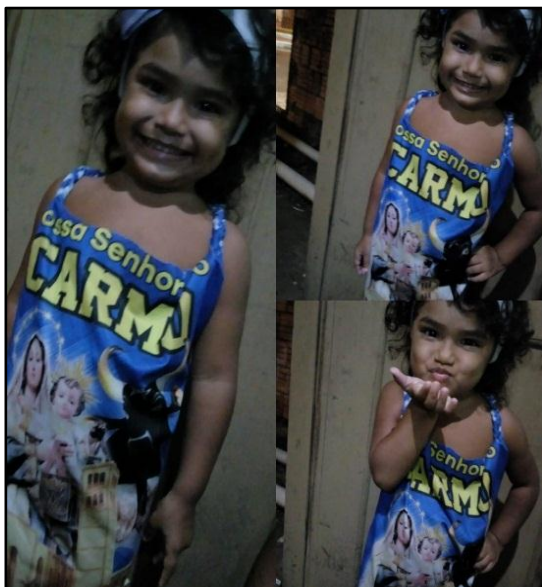
Figura 06: Escolha do boi que torce

Observamos nas figuras 06 e 07 que as crianças já têm preferência por torcer por um Boi-Bumbá, e isso já vem de berço já que os pais influenciam muito na escolha.