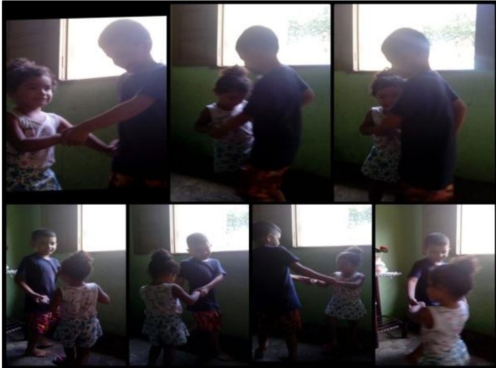
Figura 12: Momento de interação com as cantigas de roda

Igualmente, na figura 12, observamos que a criança interagiu nas cantigas de roda com alguém que aproxima mais do seu universo e é possível observar a interação de ambos na brincadeira de roda.