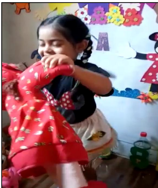
Figura 10: Brincando de cantigas de roda com a boneca.