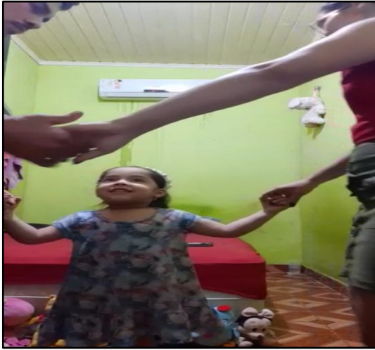
Figura 08: momento de brincar de roda com os pais em casa.