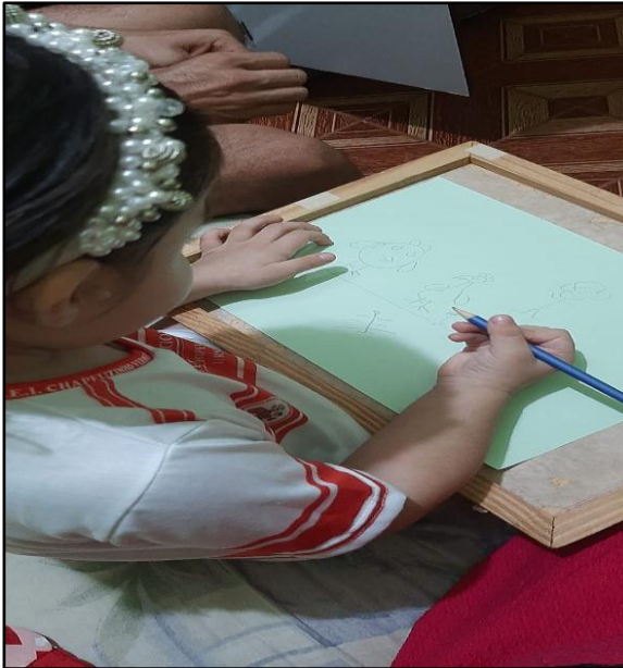
Figura 13: Construção do desenho da cantiga “A Galinha Pintadinha”.