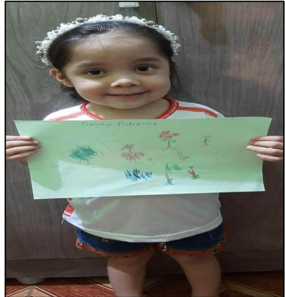
Figura 14: Ilustração do desenho.