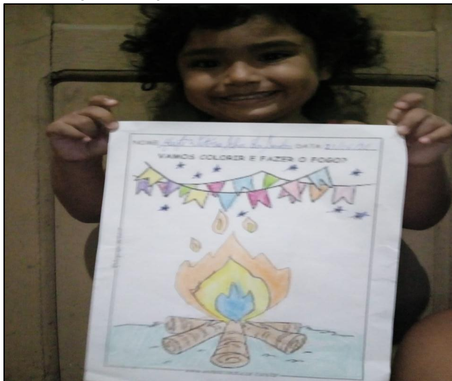
Figura 05: Registro de atividade realizada em casa

seu desenho. Observamos também que ela foi estimulada pelo seu responsável na hora de desenhar e pintar por conta dos traços do desenho e pintura.