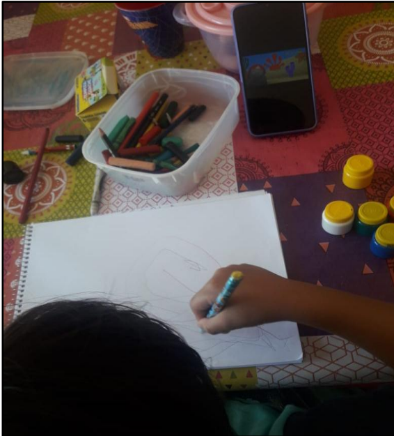
Figura 15: Construção do desenho da cantiga “A canoa virou”.