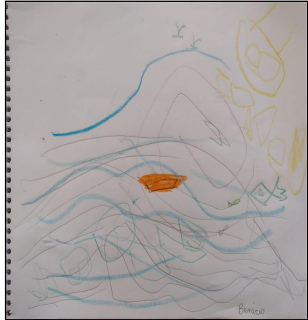
Figura 16: Finalização do desenho.