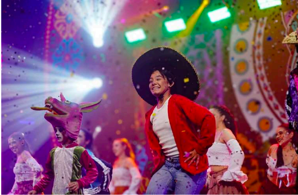
Figura 8: Coreografia “O amor que nos une”.

e abraçado pelo público. Essa colaboração não apenas honrou a essência do filme, mas também explorou novas possibilidades narrativas e sensoriais através da dança, VIVA! representou um marco significativo na trajetória de produção de espetáculos, reafirmando a capacidade da dança de reimaginar e transformar narrativas cinematográficas de maneira singular e criativa.