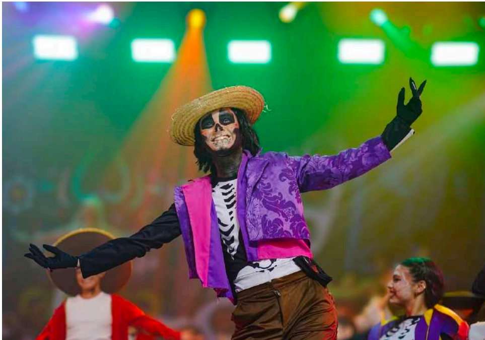
Figura 2: Figurino do personagem Héctor

permitiu uma fluidez maior nos movimentos, essencial para a dinâmica da coreografia, que exigia transições rápidas e precisas.