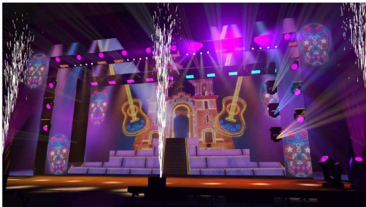
Figura 4: Projeto 3D Painél de LED do Espetáculo.

Cada etapa do processo de produção é crucial para o sucesso do espetáculo, e isso inclui não apenas os aspectos criativos, mas também os logísticos e técnicos, cada membro da equipe desempenha um papel fundamental, e tarefas como o transporte dos cenários até o teatro demandam uma equipe especializada para assegurar que todos os elementos cheguem em condições ideais para a montagem, esse cuidado evita danos aos materiais e assegura que a estrutura do cenário esteja pronta para atender às exigências artísticas e funcionais do espetáculo. A organização logística, portanto, se apresenta como um dos pilares para evitar contratempos e assegurar que todos os prazos sejam cumpridos, um planejamento prévio detalhado é indispensável para prever possíveis desafios, essa preparação não apenas mitiga riscos, mas também contribui para a eficiência do processo, permitindo que a equipe criativa e técnica concentre sua energia no refinamento artístico.