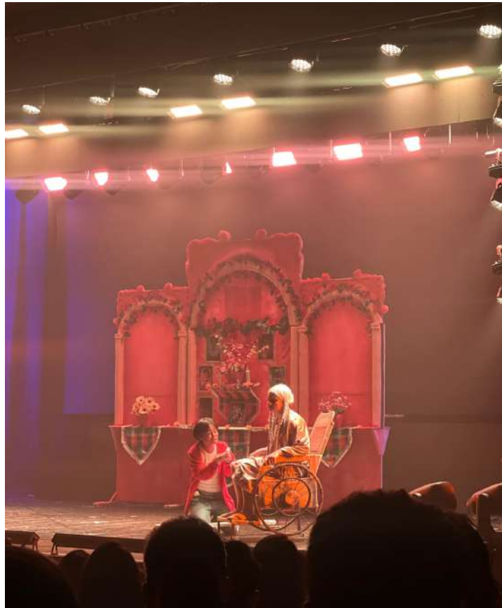
Figura 6: Cenário “Altar da Família” + cena “Canção para Inês”

a magia do palco ganha vida, transcendendo os limites do entretenimento para tocar profundamente a plateia.