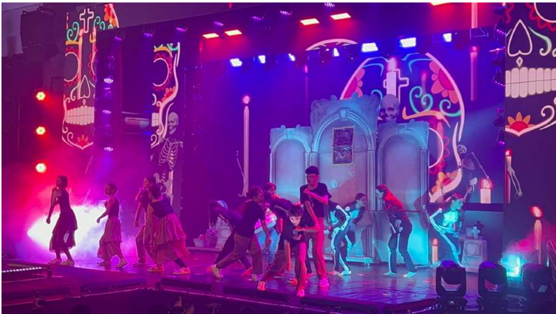
Figura 3: Coreografia “Entre Mundos”