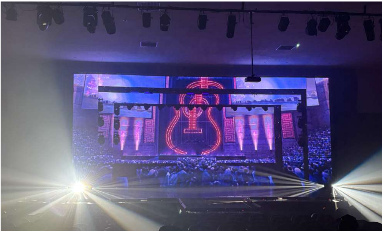
Figura 5: Estrutura Painel de LED e iluminação do Espetáculo

A produção de VIVA! exemplifica como o trabalho coletivo, integrado e cuidadosamente planejado entre coreógrafos, costureiras, técnicos e cenógrafos é essencial para criar uma experiência artística coesa e impactante. A valorização de cada função e o respeito ao tempo e à habilidade dos colaboradores não apenas garantem a execução eficiente do espetáculo, mas também promovem uma construção coletiva que enriquece a obra como um todo, resultando em uma produção visual e sensorialmente envolvente que cativa o público e mantém viva a essência artística da obra.