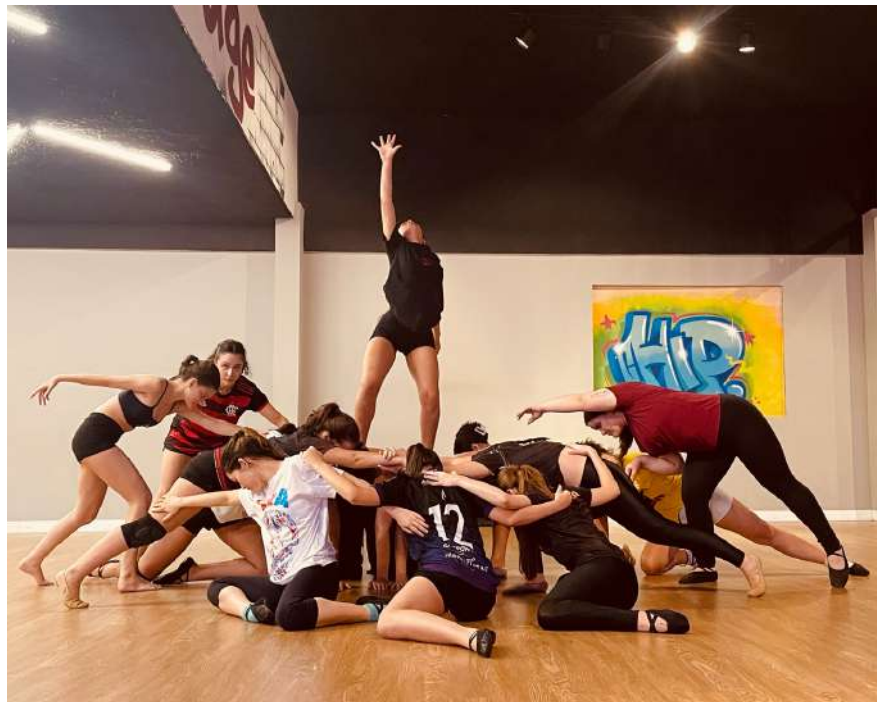
Figura 7: Processo Coreográfico de “A Queda”- Companhia.

Durante o processo de tradução de VIVA! para o palco, uma das decisões criativas mais relevantes foi a inclusão de coreografias que não faziam parte do filme original, essas cenas adicionais surgiram para preencher lacunas e criar oportunidades coreográficas que envolveram todas as turmas da escola, especialmente porque o filme em si possui poucas sequências musicais ou dançantes. A escolha dessas cenas extras é sempre feita com muito cuidado, buscando respeitar o espírito e a atmosfera da obra original, sem destoar do tema principal, um exemplo disso foi a coreografia criada para a cena “A Queda”, que ilustra o momento dramático em que o protagonista Miguel é jogado no calabouço, adicionando uma camada de interpretação física e emocional que complementa a narrativa do filme.