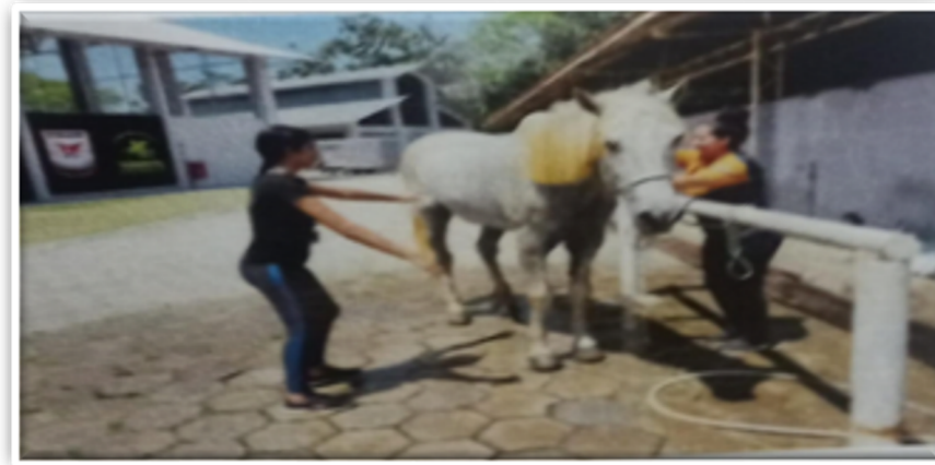
Figura 5: Cuidados com o equino