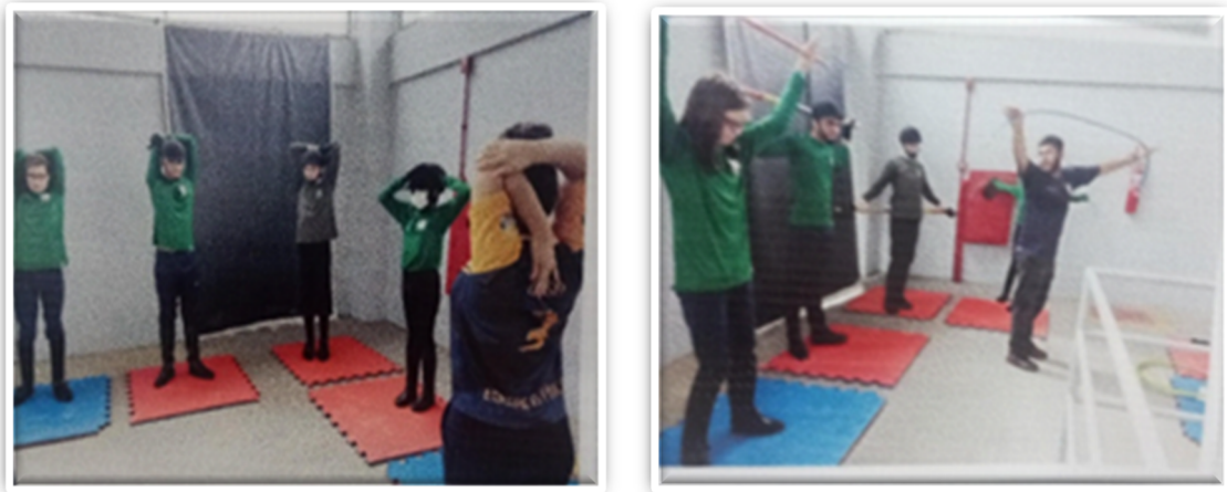
Figura 6: Sessão de alongamentos com os Praticantes