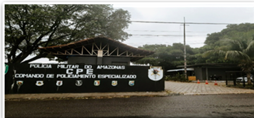
Figura 1: Quartel Militar da Polícia do Amazonas – Comando de Policiamento Especializado (CPE)

O local onde ocorreram as experiências foi no Núcleo de Equoterapia da Polícia Militar do Amazonas (PMAM), localizado em um bairro classe média baixa, Dom Pedro I, na Rua Tiradentes, S/N – AM, 69040-000 (Figura 1). O projeto social ofertado pelo núcleo foi inaugurado em 1992 e, desde então, oferece atendimento gratuito e assistencial a crianças, adolescentes e adultos com uma ampla gama condições, incluindo paralisia cerebral, déficits de coordenação motora, transtorno do espectro autista (TEA), hiperatividade, sequelas de AVC, microcefalia, hidrocefalia, além de síndromes como Down, Charge, entre outras (POLÍCIA MILITAR DO AMAZONAS, 2022). A participação nas atividades não tem custos ou retorno financeiro para os participantes e acadêmicos, dado que se trata de uma ação filantrópica. Apesar de ser uma instituição filantrópica, o funcionamento da instituição está ligado a parceria das secretarias do Governo do Estadual - Secretaria de Segurança Pública (SSP-AM), com a disposição de profissionais civis e militares, e a Secretaria de Justiça, Cidadania e Direitos Humanos (SEJUSC), junto a Secretaria de Pessoa com Deficiência (SEPCD).