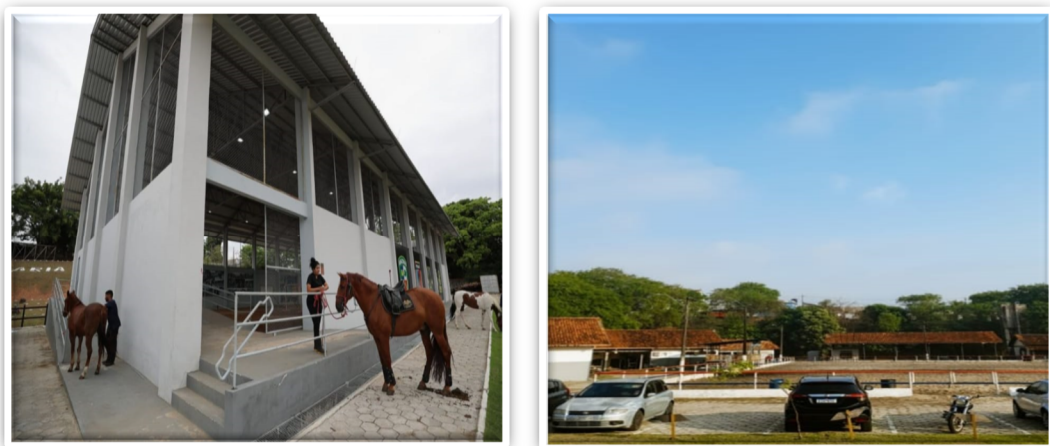
Figura 3: Área externa do picadeiro coberto, picadeiro aberto e estacionamento

Fui apresentada a todos os espaços onde as práticas são realizadas. Os ambientes incluíam um picadeiro coberto e outro descoberto, ambos com pistas de areia, além de áreas gramadas e um estacionamento com piso cimentado (Figura 3). Tais variações eram cuidadosamente planejadas para proporcionar diferentes estímulos aos praticantes durante o movimento do cavalo. Também visitei as baias onde os cavalos ficavam alojados e tomei conhecimento dos materiais utilizados nas práticas.