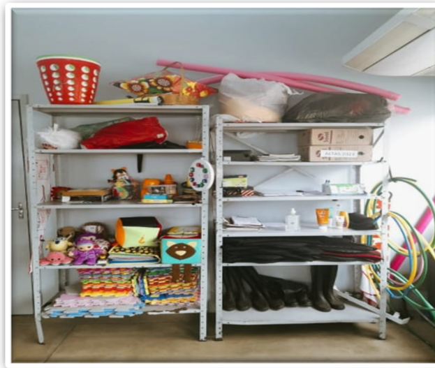
Figura 4: Estante dos materiais e os materiais para as práticas

Entre os materiais utilizados nas práticas das fases 3 e 4, registrei a presença de bolas de diversos tamanhos e cestos, usadas para atividades de arremesso realizadas no picadeiro fechado (Figura 4). Os cones também eram usados, específicos como marcadores ou obstáculos, enquanto bambolês e cabos de vassoura auxiliavam os praticantes no alinhamento postural e alongamento.