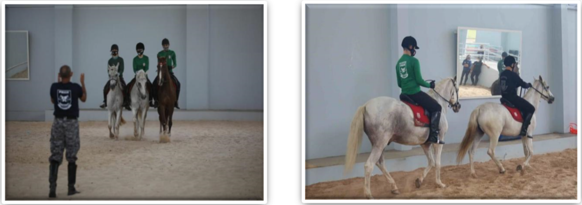
Figura 2: Práticas de Equoterapia da 3º e 4º fase