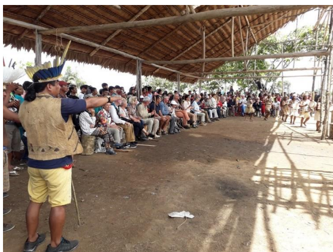
Figura 04: Primeira Visita dos Turista na Betânia Me'cürane