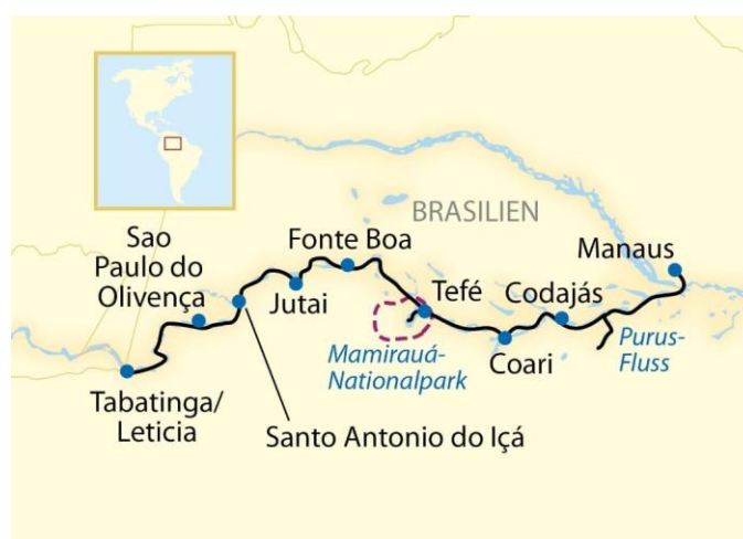
Figura 02: Localização geográfica de Santo Antônio do Içá na mesorregião do Alto Solimões - AM