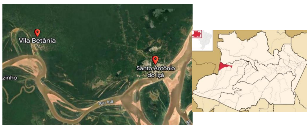
Figura 03: Localização geográfica de Santo Antonio do Içá e da Comunidade Betânia Me'cürane