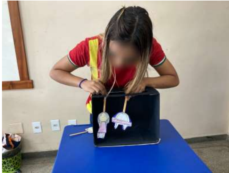
Figura 1 - Aluna apresentando história de uma garota que se deparava com uma nave espacial e fazia amizade com um alienígena