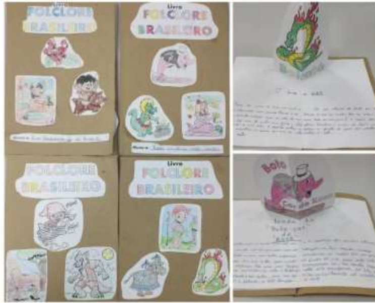
Figura 5 - Livros Pop Up confeccionados em sala de aula