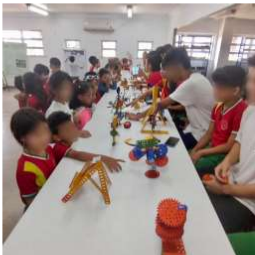
Figura 11 - Exposição de Arte Concreta