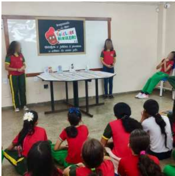
Figura 6 - Lançamento do livro pop-up "Folclore Brasileiro"