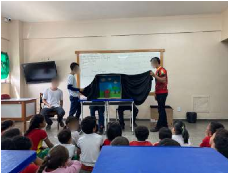
Figura 4 - Aluno à esquerda narra história da Arca de Noé. Enquanto alguns colegas seguram o plano de fundo, outros apresentam a história com os personagens e seus elementos.