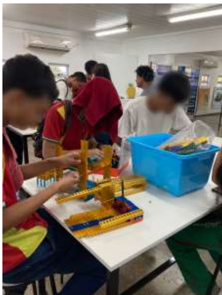
Figura 10 – Estudante no laboratório experimentando a construção de um cubo