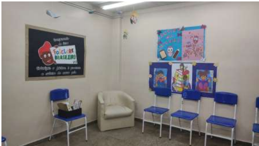
Figura 7- Espaço intitulado "cantinho da leitura"