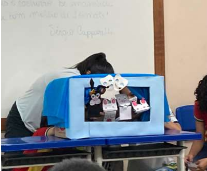
Figura 3 - Quatro estudantes apresentando história da "Menina do laço de fita"

Fonte: Geovanna Valente de Freitas (2022)