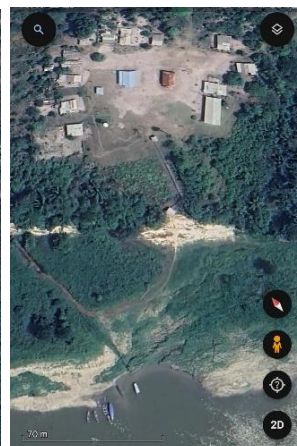
Figura 6: Imagem recente da comunidade.