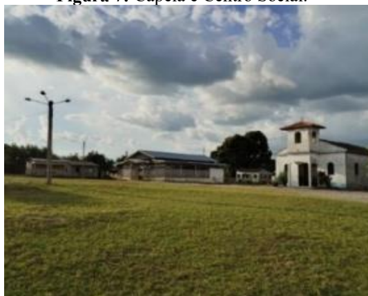
Figura 7: Capela e Centro Social.

É bem alto mesmo! Um verdadeiro desafio para os moradores e visitantes para encarar a subida e descida bastante íngreme, através de uma longa escada de madeira que se divide em duas partes (ver. fig. 7 e 8), construída estrategicamente, para a retomada do fôlego na subida de cada degrau até chegar à área comunitária. Tanto, que para muitos dos visitantes de idade mais avançada, preferiam fazer o percurso do antigo caminho da primeira comunidade até essa localidade, percorrendo uma distância muito mais longa, porém, com mais conforto e tranquilidade. Entretanto, ao passar dos anos, esse caminho alternativo mais confortável se tornou quase intrafegável, devido ao mínimo de utilização pelos próprios comunitários, por questões de praticidade.