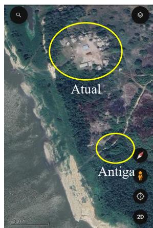
Figura 5: Fases da comunidade.