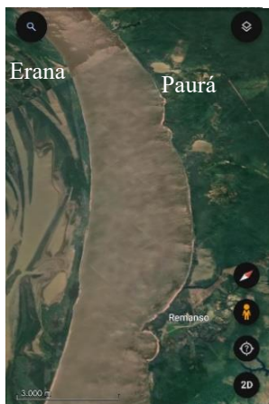
Figura 4: Do Remanso ao Erana e Paurá.