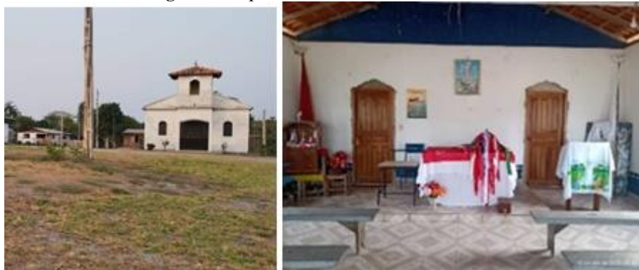
Figura 9: Capela de Nossa Senhora de Fátima