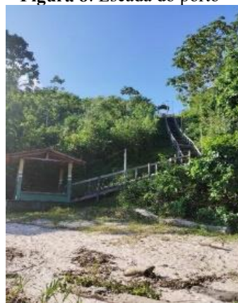
Figura 8: Escada do porto