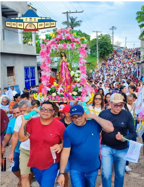
Imagem 02 e 03: Procissão e Praça de Nossa Senhora de Guadalupe

Fonte: Nonato Souza (ano não identificado)