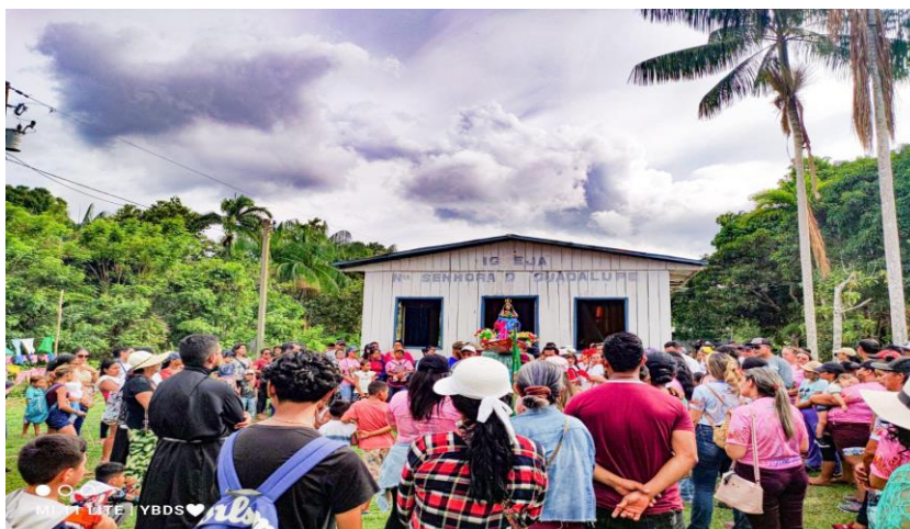
Imagem 02: Antiga capela de Nossa Senhora de Guadalupe na comunidade do

construída uma capela na aldeia e que a chamassem de Nossa Senhora de Guadalupe.