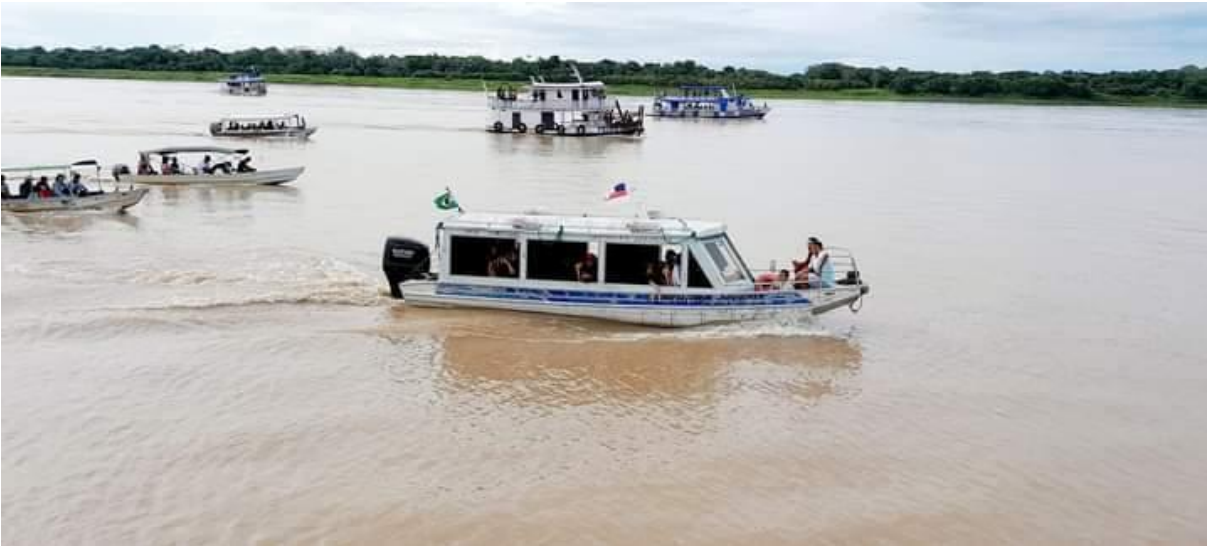
Imagem 01: Procissão Fluvial