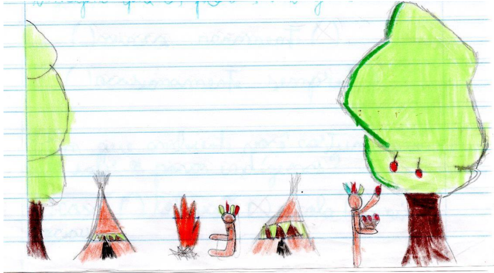
Figura 1 - O modo de vida do indígena