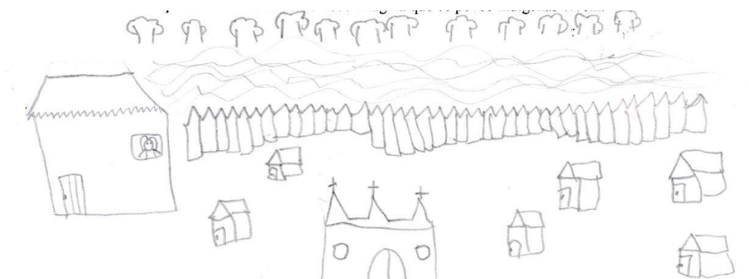
Figura 3 - Vivência em um contexto mais urbano