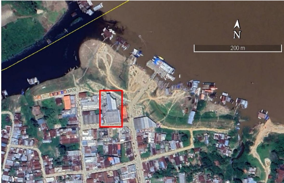
Figura 2: Imagem de satélite de parte do centro na margem do rio Javari do município de Benjamin Constant do estado do Amazonas com destaque (quadrado em vermelho) para a localização do mercado Municipal Vitor Magalhães ao norte e do mercado Municipal Gentúlio Alencar ao sul.

O estudo foi realizado com um grupo de pescadores e comerciantes de peixes que comercializam o pescado nos dois principais lugares de venda no município de Benjamin Constant, sendo dois mercados municipais interligadas (vizinhas), o Mercado Municipal Gentúlio Franklim Alencar e o Mercado Municipal Vitor Magalhães, localizadas no Centro do município, nas margens do rio Javari (Figura 2).