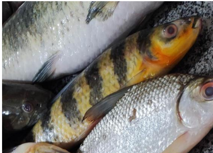
Figura 26: Leporinus fasciatus . Cambada misturada.

Descrição: Popularmente conhecida como piau, aracu, piau-flamengo ou piau-amarelo, esta espécie de grande porte pode alcançar até 35 cm de comprimento. Ela é caracterizada por apresentar de 8 a 10 faixas escuras sobre um fundo amarelo no tronco e na cabeça. Sua linha lateral possui entre 43 e 45 escamas, com 7 a 8 séries de escamas entre a origem da nadadeira dorsal e a linha lateral. Nos indivíduos jovens, com cerca de 5 cm, algumas faixas estão fundidas, mas se separam à medida que o peixe cresce. Em termos de biologia, esta espécie é onívora, consumindo tanto material vegetal quanto larvas de insetos. Ela realiza migrações reprodutivas, desovando uma vez por ano no início do período de enchente. É comumente encontrada nas margens de rios e lagos de água branca. habita águas doces bentopelágicas da bacia do Rio Amazonas. Esta espécie tropical prefere temperaturas entre 22°C e 26°C e pH entre 5.5 e 7.5. Adultos ocorrem em áreas rochosas com águas rapidamente fluindo e se alimentam de vermes, crustáceos, insetos e matéria vegetal. Reproduzem-se de dezembro a maio, em locais densamente vegetados. Atingem a maturidade sexual aos 15 cm e podem crescer até 37 cm.