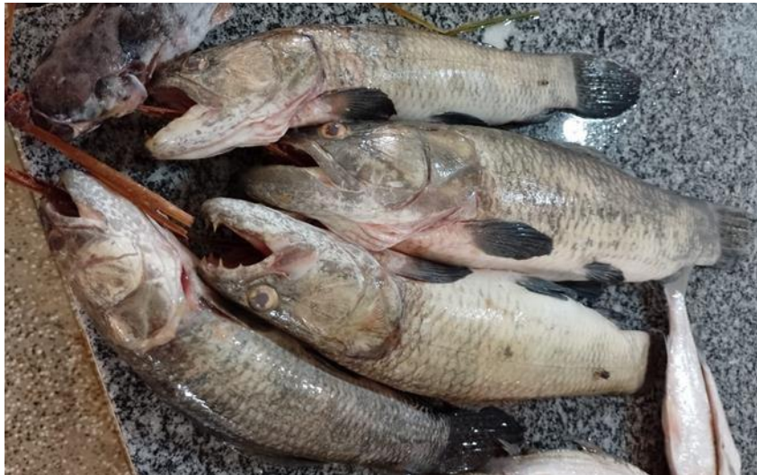
Figura 25: Hoplerhythrinus unitaeniatus . Cambada.

é composta por 32 a 37 escamas. Possui dentes caniniformes de variados tamanhos em ambas as maxilas. Uma característica distintiva é a listra escura longitudinal ao longo da linha lateral, além de uma mancha arredondada sobre o opérculo. A bexiga natatória é intensamente vascularizada, permitindo a respiração aérea. Este peixe é carnívoro, alimentando-se principalmente de peixes, camarões e insetos, utilizando táticas de tocaia e espreita para capturar suas presas. Alcança a maturidade sexual por volta de um ano de idade, e a desova ocorre durante o período da enchente, com baixa fecundidade, em torno de 6.000 ovócitos por postura, cada um medindo aproximadamente 1,5 mm de diâmetro. No período reprodutivo, os machos apresentam dimorfismo sexual na nadadeira anal, que se torna bastante intumescida na base, e formam uma bolsa epidérmica na base e porção posterior do último raio da nadadeira anal. Durante este período, os reprodutores cessam a atividade alimentar.