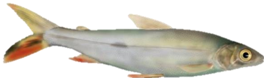
Figura 38: Hemiodus sp.

Descrição: O peixe conhecido popularmente como flexeira é uma espécie de porte médio que pode atingir até 25 cm de comprimento. Ele possui um corpo roliço e baixo, cuja altura é aproximadamente um quarto do comprimento total. A linha lateral deste peixe contém cerca de 120 escamas, com 26 séries de escamas entre a nadadeira dorsal e a linha lateral, e 16 entre a linha lateral e a base da nadadeira ventral. Uma característica distintiva deste peixe é uma mancha escura alongada no flanco, localizada na região posterior da nadadeira dorsal. Essa mancha tem um diâmetro aproximadamente do tamanho do olho do peixe e é ocasionalmente seguida por uma faixa escura menos evidente que se estende até o final do pedúnculo caudal. Além disso, o lóbulo inferior da nadadeira caudal apresenta uma faixa amarelada. Na revisão taxonômica realizada por Langeani em 1996, essa espécie foi considerada nova e recebeu o nome científico de Hemiodus “microlepis-longo”, porém até o momento nada definido.