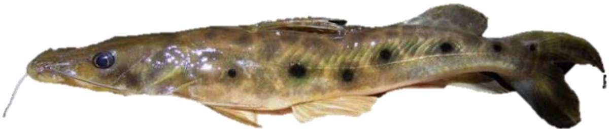
Figura 10: Hemisorubim platyrhynchos .

Descrição: O Hemisorubim platyrhynchos , mais conhecido como braço-de-moça, é um grande peixe que pode atingir até 50 cm de comprimento. Ele se distingue de outras espécies de bagres comerciais pela maxila inferior mais longa que a superior, projetando-se sobre esta quando a boca está fechada. Sua coloração varia entre cinza e amarronzada, adornada por várias manchas escuras e arredondadas pelo corpo. Encontrado em toda a bacia amazônica, habita rios e lagos de águas brancas, pretas e claras. Este carnívoro se alimenta principalmente de pequenos peixes e invertebrados. A biologia desta espécie ainda carece de informações detalhadas, mas é provável que siga o padrão reprodutivo típico dos grandes bagres, com desova durante a enchente. Embora não muito abundante durante visitas de campo, quando capturado, é frequentemente comercializado junto com outras espécies, com um valor médio de 20 reais.