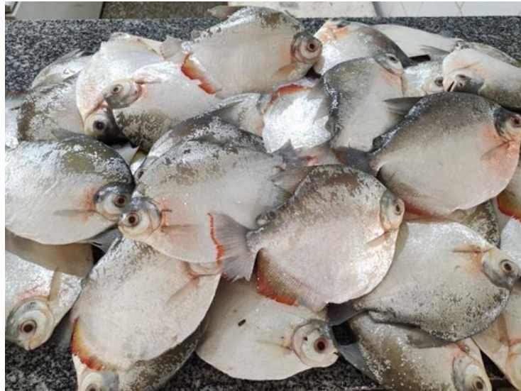
Figura 16: Myleus rubripinnis . Cambada.

a distância até a nadadeira dorsal, que possui de 25 a 28 raios ramificados. A coloração é predominantemente cinza-esbranquiçada, com alguns indivíduos apresentando manchas vermelho-ferruginosas no opérculo, tronco e base inferior da nadadeira anal, características que ocorrem somente nos machos em reprodução, configurando um dimorfismo sexual transitório. Nas fêmeas, a região opercular e a porção inferior da base da nadadeira anal ficam avermelhadas, com a mancha vermelha nessa nadadeira continuada por uma mancha preta na margem posterior.