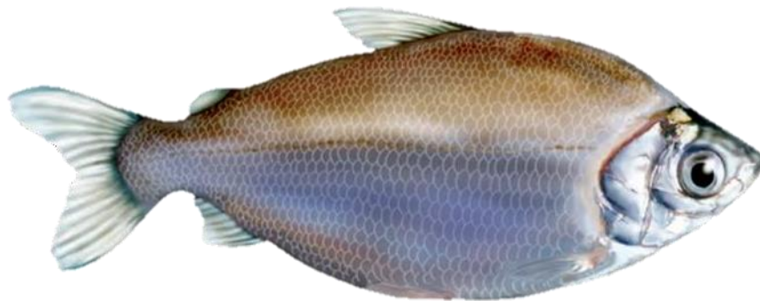
Figura 32: Psectrogaster amazonica . Fonte: Santos, Ferreira e Zuanon (2009).

comprimento. Seu corpo é curto e alto, com escamas ctenóides que são ásperas ao toque, especialmente na região ventral. A região pré-pélvica é transversalmente arredondada, enquanto a região pós-pélvica apresenta uma série de espinhos voltados para trás, originados pela modificação das escamas que formam a margem da quilha. A linha lateral contém entre 53 a 55 escamas. Entre a origem da nadadeira dorsal e a linha lateral, há 13 a 15 séries de escamas, e entre a linha lateral e a origem da nadadeira ventral, há 8 a 9 séries. Este peixe é uniformemente claro e prateado no corpo, exceto na base dos raios medianos da nadadeira caudal, que apresentam uma pigmentação escura. Em termos de biologia, a cascuda é detritívora, alimentando-se de matéria orgânica floculada, algas, detritos e microrganismos associados. Forma cardumes e realiza migrações tróficas e reprodutivas. A maturação sexual inicial ocorre em indivíduos com aproximadamente 15cm de comprimento, e a desova ocorre durante o período de enchente.