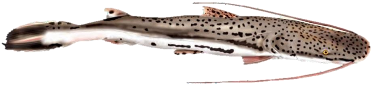
Figura 14: Sorubimichthys planiceps .

(espécie com maxila superior expandida) por possuir nadadeira dorsal pintada, além de outras particularidades de coloração. Evidências sugerem que a dieta dessa espécie inclui peixes e invertebrados. A desova é total, ocorrendo no início da enchente, e a espécie realiza migrações. Não se sabe ao certo se forma cardumes ou se a movimentação rio acima está relacionada diretamente com a desova iminente. É comum encontrar esta espécie em áreas rasas, especialmente em ambientes de praias.