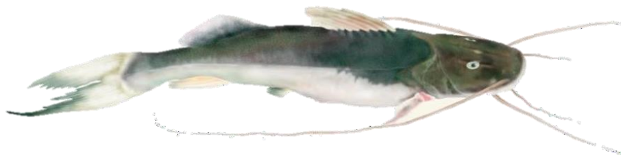
Figura 9: Brachyplatystoma vaillantii .

Descrição: Também conhecido por apelidos como Mulher-ingrata, piaba (Baixo Amazonas), pirabutón, pujón (Colômbia) e manitoa (Peru), é um peixe de grande porte, podendo atingir até 1 metro de comprimento e pesar até 10 kg. No município é popularmente conhecido como pirabutão. Possui corpo robusto, com a maxila superior ligeiramente mais longa que a inferior. A base da nadadeira adiposa é mais longa que a da nadadeira anal. Sua coloração é uniformemente acinzentada, mais clara no ventre. Este peixe é encontrado ao longo do sistema Solimões-Amazonas e seus principais afluentes de água branca, embora também seja conhecido em sistemas de água preta, como o rio Orinoco na Venezuela. É pouco frequente em áreas de floresta alagada na várzea. É piscívoro, alimentando-se de pequenos peixes lisos e peixes de escamas que formam cardumes em determinadas épocas do ano, além de ocasionalmente consumir invertebrados. Não há informações conclusivas sobre sua reprodução, mas evidências sugerem que a desova ocorre durante a enchente. A primeira maturação sexual acontece em exemplares com cerca de 50 cm de comprimento. Peixes adultos migram ao atingir aproximadamente três anos de idade. Essa espécie parece ter uma migração menos extensa para desova, não chegando aos sopés dos Andes. As larvas são transportadas pela correnteza. Durante visitas de campo, foi encontrado poucas vezes, porém sempre em abundância, sendo comercializado em cambadas a um valor médio de 15-20 reais.