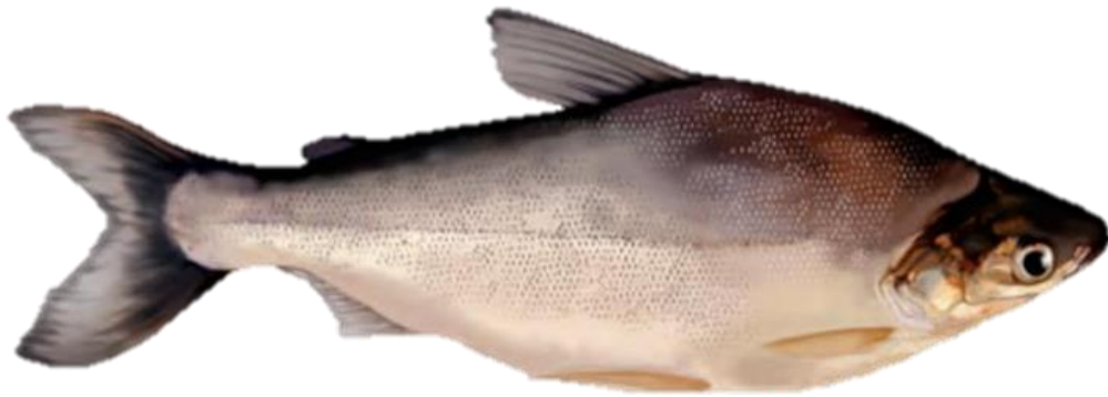
Figura 33: Potamorhina latior .

lateral, e de 16 a 20 entre esta e a origem da nadadeira anal. Sua coloração é uniformemente cinza, sendo ligeiramente mais escura no dorso e mais clara no ventre.