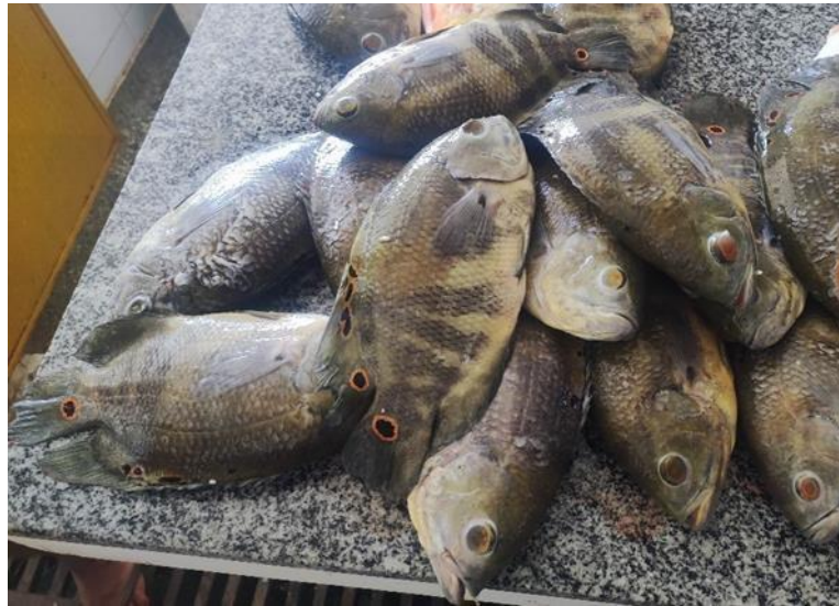
Figura 28: Astronotus ocellatus . Cambada.

Descrição: Esta espécie também conhecida como acará-açu, carauassu, pavo real, carahuasú na Colômbia, palometa real na Bolívia, e oscar, é um peixe de porte médio que pode atingir até 35 cm de comprimento. Suas nadadeiras dorsal e anal são densamente escamadas na base, e a nadadeira anal possui três espinhos. Uma característica marcante é a presença de um ocelo na parte superior da base da nadadeira caudal e duas ou mais manchas arredondadas, geralmente em forma de ocelo, na base da nadadeira dorsal.