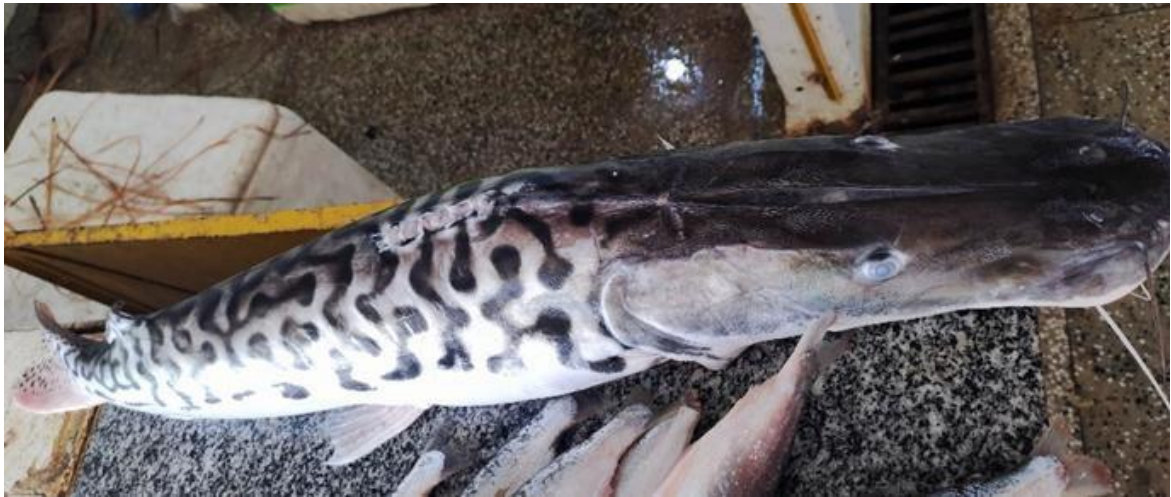
Figura 7: Pseudoplatystoma tigrinum - Uma amostra da espécie.

Bolívia e Venezuela. Durante visitas a campo, destacou-se por ser comercializado em unidades ou cambadas, com preço variando de 20 a 30 reais o kg. Adicionalmente, esta espécie é encontrada nas bacias dos rios Amazonas e Orinoco. Esta espécie de água doce e estuarina tem uma expectativa de vida de até 18 anos e pode pesar até 17 kg. É uma espécie noturna, vivendo em leitos principais de zonas lentas ou rápidas, bem como em florestas inundadas. É também um predador oportunista que pode se alimentar de caranguejos e camarões.