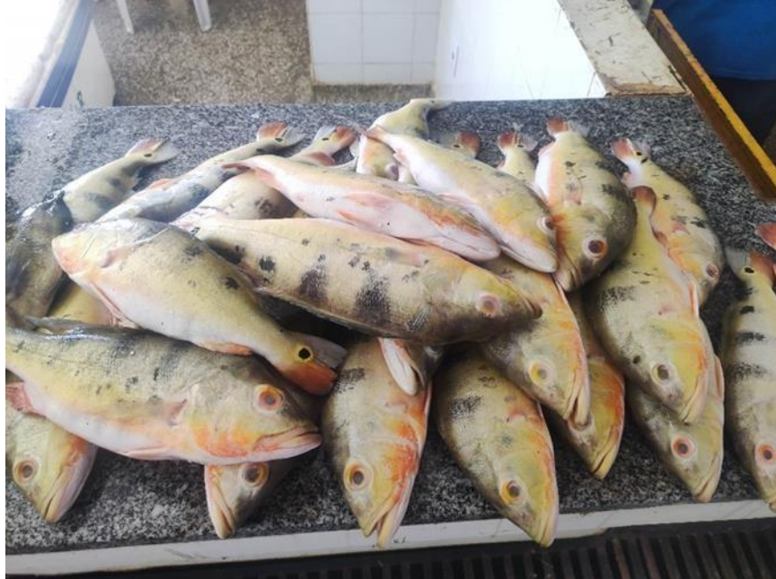
Figura 29: Cichla vazzoleri . Cambada.

se pelo maior diâmetro dos pontos esbranquiçados, corpo mais curto e alto, e pelo número de escamas ao longo do corpo, que varia entre 95 e 114, enquanto no C. temensis este número varia entre 98 e 128. Além disso, a linha lateral do C. vazzoleri geralmente é descontínua.