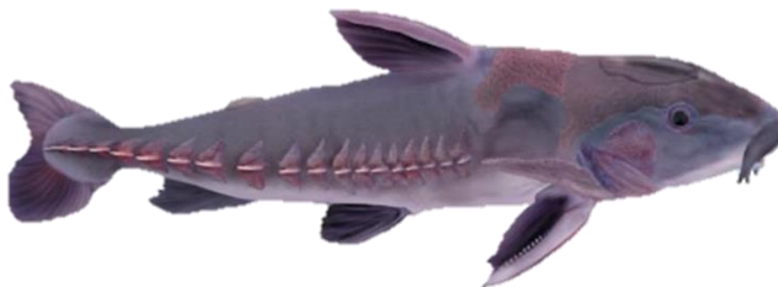
Figura 36: Oxydoras niger .

Descrição: O peixe, conhecido popularmente como cuiú-cuiú ou mucurão, é uma espécie de grande porte que pode atingir até 1,2m de comprimento e pesar 20kg. Apresenta coloração cinza-escuro uniforme, boca subinferior e lábios carnudos adaptados para sucção, além de tentáculos carnudos no céu da boca. Até recentemente, essa espécie era classificada no gênero Pseudodoras . Alimenta-se no fundo, consumindo detritos e a fauna de invertebrados aquáticos associada, principalmente larvas de insetos. Sua reprodução ocorre no início da enchente, com fecundidade em torno de 250.000 ovócitos por desova. Exemplares maduros têm sido observados a partir de 54cm de comprimento.