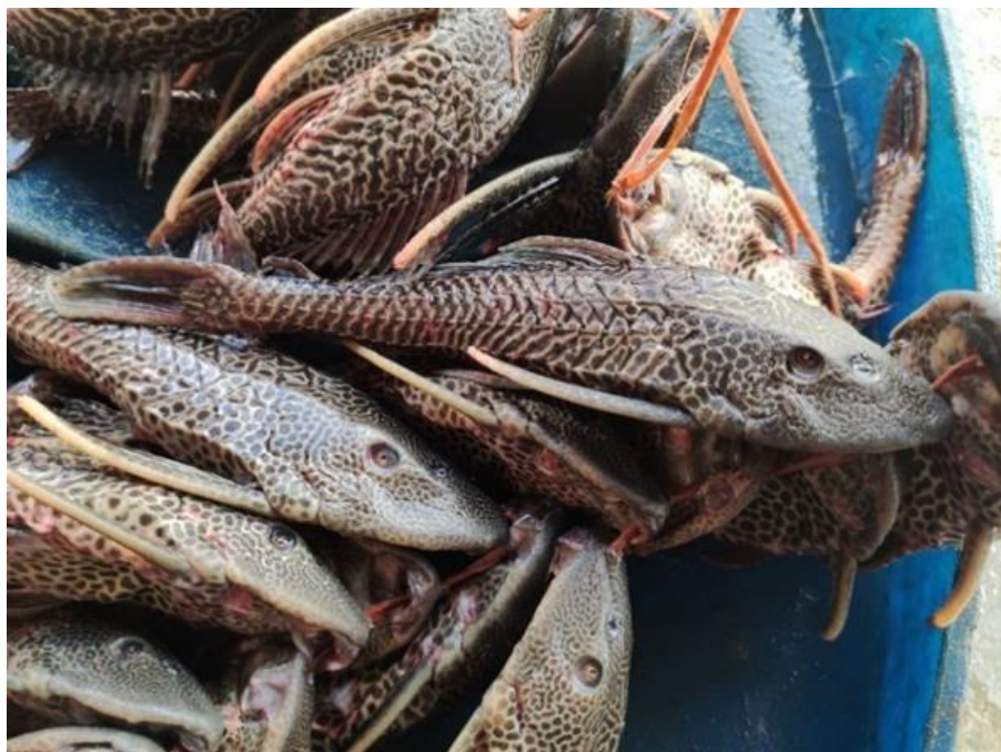
Figura 34: Liposarcus pardalis . Cambada.

Durante a desova, que ocorre na vazante, o bodó constrói ninhos no fundo de lagos ou em barrancos de rios. Cada desova pode conter de 1.000 a 5.000 ovócitos, e o período de reprodução é longo, com até 2 a 3 posturas por ano, geralmente concentradas no final da seca e início da enchente. Os pais cuidam dos ovos até a eclosão das larvas.