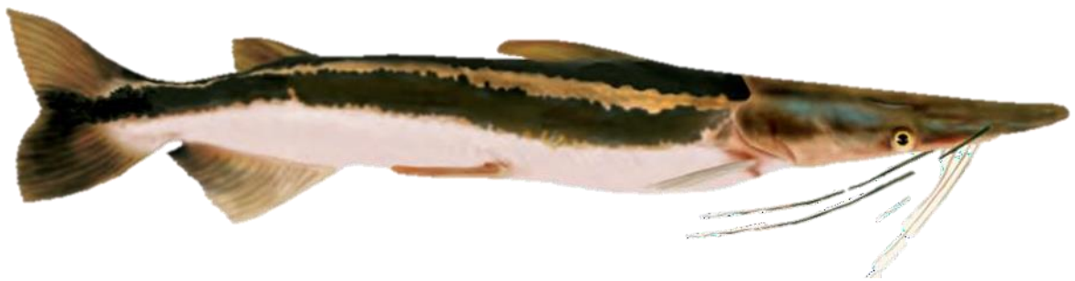
Figura 133: Sorubim lima .

Descrição: O Sorubim lima , também conhecido como bico-de-pato devido à sua maxila superior proeminente, é um peixe de porte grande que pode atingir até 50 cm de comprimento. Possui uma cabeça extremamente achatada com olhos posicionados lateralmente. Encontrado em toda a bacia amazônica, especialmente em rios de águas brancas, claras e pretas, o bico-de-pato é carnívoro, alimentando-se principalmente de pequenos peixes e camarões. Ele utiliza sua maxila superior alongada para capturar camarões próximo ao fundo do rio, uma adaptação única entre os peixes amazônicos. A reprodução ocorre durante a enchente, e durante a vazante, pequenos cardumes são observados movendo-se contra a correnteza nas áreas rasas formadas ao longo das margens. Apesar dessas características peculiares, sua importância econômica é considerada insignificante, sendo ocasionalmente capturado e vendido em conjunto com outras espécies, com preço médio de aproximadamente 15 reais por exemplar.