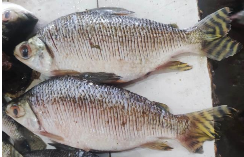
Figura 30: Semaprochilodus insignis . Tratado (Ticado).

da linha lateral, com 9 a 11 séries entre a origem da nadadeira dorsal e a linha lateral, e o mesmo número entre esta e a origem da nadadeira ventral. Ao redor do pedúnculo caudal, há de 18 a 22 séries de escamas, e entre a cabeça e a origem da nadadeira dorsal encontram-se de 11 a 15 séries.