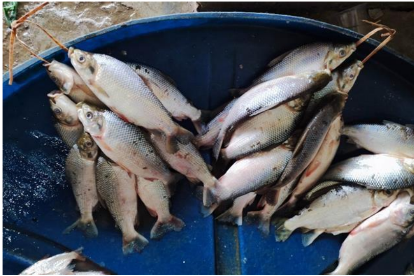
Figura 31: Prochilodus nigricans . Cambada.

cardumes e realiza longas migrações, desovando durante a enchente em rios de água branca ou clara. Os alevinos e jovens são comumente encontrados em áreas de várzea.