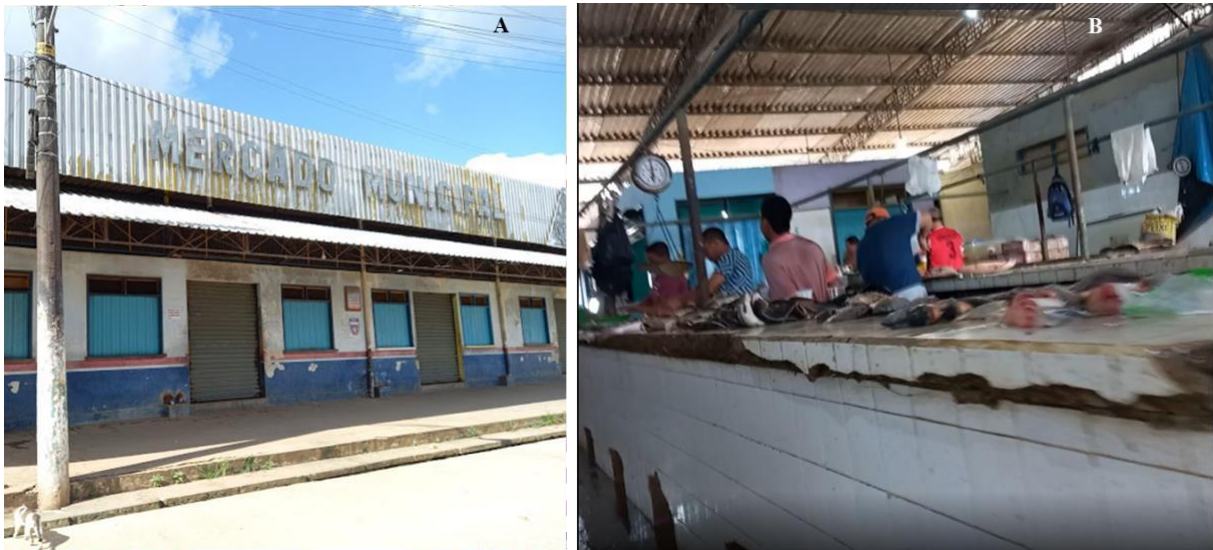
Figura 3: Mercado Municipal Gentúlio Franklin Alencar. A - Parte externa do Mercado, e B - Parte interna do mercado, especificamente as bancadas de vendas de pescados.

Além da comercialização de pescado, o mercado abriga comerciantes de carnes bovinas, suínas, de animais de caça e aves, e hortifruti em geral, incluindo alimentos (café da manhã e almoço) que são consumidos no local. Normalmente, o dia da semana mais movimentado é o sábado e quando geralmente chega um volume maior de pescado novo, frescos e com melhor qualidade para a comercialização o que atrai mais consumidores (compradores).