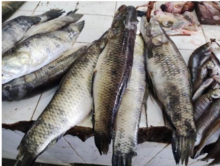
Figura 24: Hoplias malabaricus . Cambada.

ao muco produzido, com coloração variando do cinza-escuro ao amarronzado, às vezes com barras angulares ao longo dos flancos. Suas nadadeiras possuem faixas formadas por pequenas manchas alternadas, e sua cabeça é robusta e ossificada, com escamas duras e lisas. Este peixe, comum no Brasil, é encontrado em diversas bacias hidrográficas e ambientes, incluindo áreas poluídas. Carnívoro, alimenta-se de peixes e ocasionalmente de camarões e insetos aquáticos, utilizando a emboscada para capturar suas presas. Vive em águas lânticas e suporta ambientes com baixas concentrações de oxigênio. A maturação sexual ocorre com cerca de um ano e 15 cm, e o período de desova é longo, com pico no início da enchente. Os reprodutores preparam ninhos em águas rasas e o macho guarda os ovos. Essa espécie pode se mover fora d'água, facilitando a migração entre corpos d'água através da vegetação ou terreno úmido.