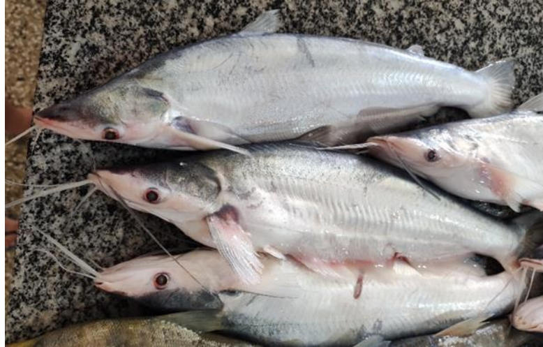
Figura 11: Hypophthalmus edentatus . Cambada.

Espécie: Brachyplatystoma platynemum (Boulenger, 1898).