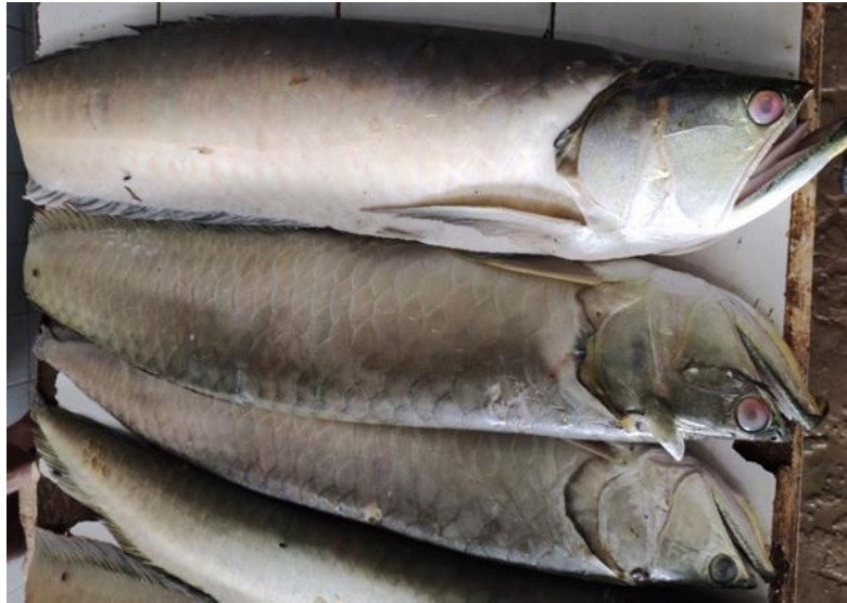
Figura 23: Osteoglossum bicirrhosum .

Descrição: Osteoglossum bicirrhosum , conhecido popularmente como aruanã, sulamba e arawana na Colômbia, é um peixe de grande porte, capaz de atingir mais de 1 metro de comprimento e mais de 5 kg. Carnívoro, o aruanã-branca consome invertebrados como besouros e aranhas, além de peixes, anfíbios, répteis, aves e pequenos mamíferos. Pode pular até dois metros fora d'água para capturar presas. A reprodução ocorre durante a subida das águas, com machos protegendo ovos e filhotes na boca por cerca de três meses, período em que não se alimentam.