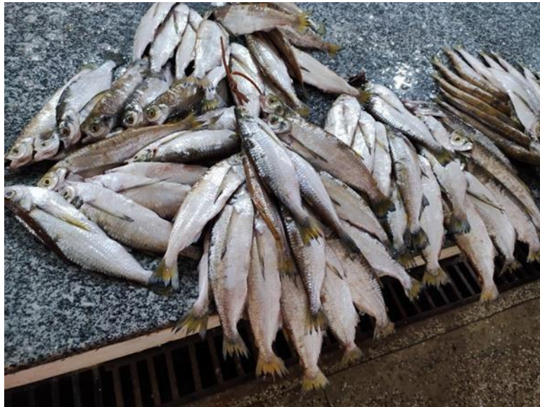
Figura 17: Triportheus elongatus . Cambada.

pequeno prolongamento na porção mediana. Entre a nadadeira dorsal e a linha lateral existem 6,5 fileiras de escamas e entre a linha lateral e a nadadeira ventral existem 3 fileiras.