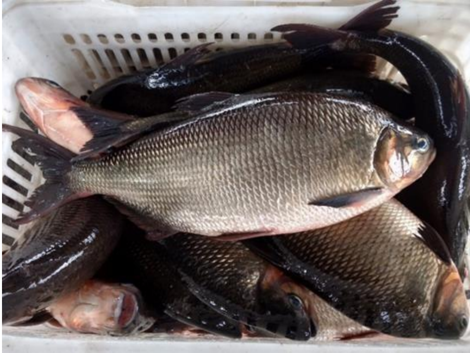
Figura 21: Brycon melanopterus . Cambada.

Ocorre predominantemente em rios de água clara e preta. Muito comum no município, sendo de grande importância econômica e alimentar para a região. É comercializada em kg e em cambadas, porém não muito destacada tendo em vista o seu tempo de abundância ser pequeno. Seu valor no comércio varia entre 20-30 reais o kg/cambada, sendo originária de viveiros, lagos e rios.