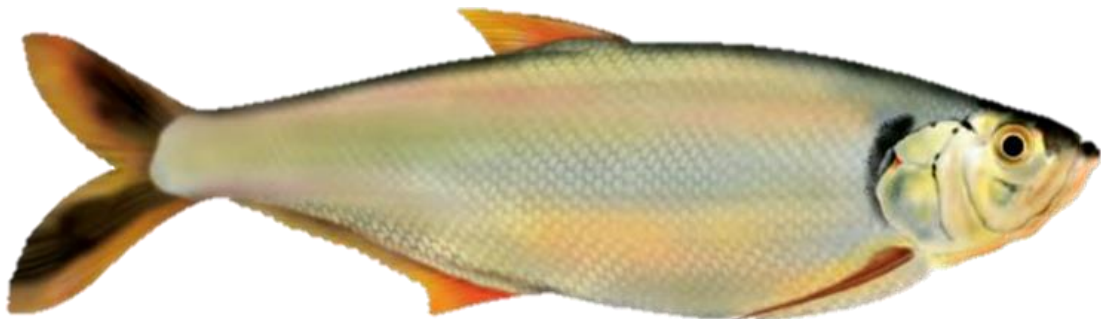
Figura 37: Pellona castelnaeana .

Descrição: Esta espécie, também conhecido popularmente como arenga, é um peixe de grande porte que pode alcançar até 60 cm de comprimento. Ele apresenta de 10 a 11 espinhos na linha abdominal, localizada entre a base das nadadeiras ventral e anal, e de 11 a 13 rastos no ramo inferior do primeiro arco branquial. Sua coloração é amarelada, com um tom mais intenso no dorso. Este peixe é piscívoro, alimentando-se de outros peixes.