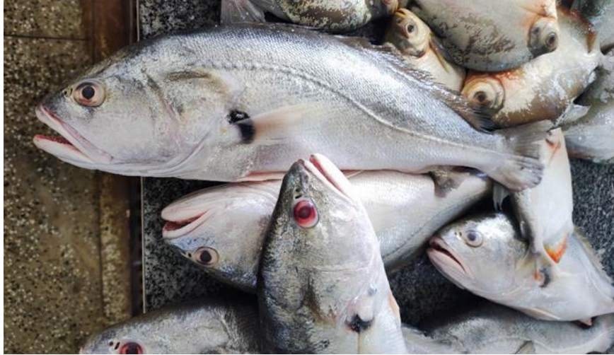
Figura 22: Plagioscion squamosissimus . Cambada.

de água preta e de peixes e camarões em águas brancas, ocasionalmente consumindo insetos. Sua primeira maturação sexual ocorre quando atinge entre 18 e 20 cm de comprimento, e a reprodução acontece durante os períodos de vazante e seca. Nesses períodos, os machos emitem sons característicos, conhecidos como "roncos", que são audíveis fora d'água.