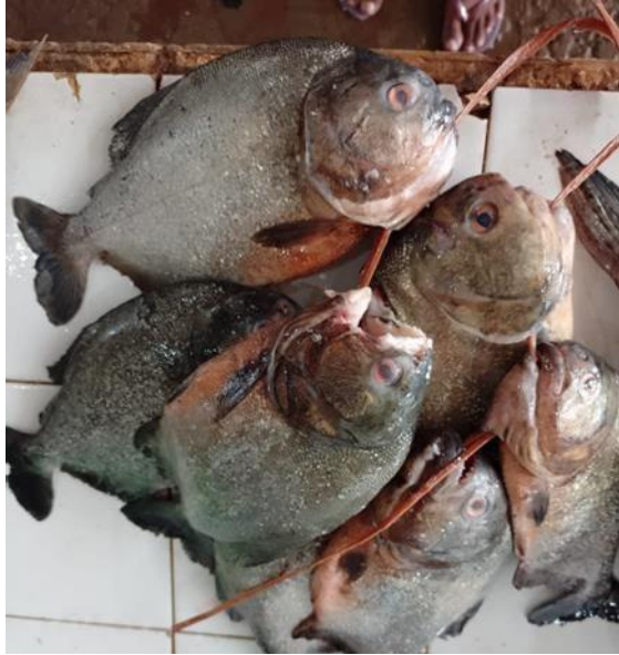
Figura 18: Pygocentrus nattereri . Cambada.

Biologicamente, a piranha consome peixes, dos quais arranca pedaços. Sua desova é parcelada e ocorre no início da enchente, com a primeira maturação sexual acontecendo por volta dos 13 cm nos machos e 15 cm nas fêmeas. Os ovos são aderentes e depositados sobre plantas submersas, sendo cuidados por um ou ambos os pais. Esta espécie é encontrada apenas em rios de água branca e é típica de ambientes lânticos. Durante visitas de campo, a piranha destacou-se e foi comercializada em grupos, com um valor médio de 10-15 reais. No entanto, de acordo com os comerciantes, a piranha tem pouca importância no aspecto alimentar da população.