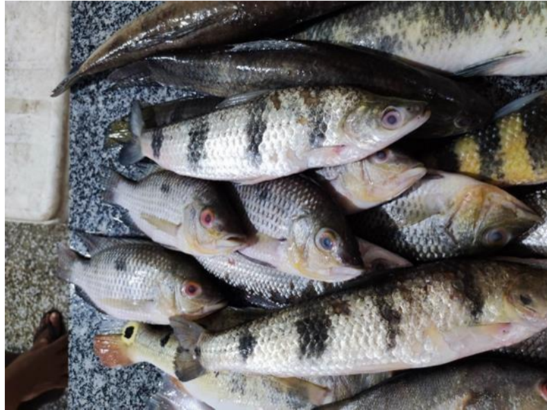
Figura 27: Schizodon fasciatus . Cambada misturada.

Descrição: O peixe conhecido por vários nomes comuns, como aracu-comum, piau-listrado, boga (na Bolívia) e lisa (na Colômbia e no Peru), pode atingir até 40 cm de comprimento. Ele se distingue por ter 8 dentes largos e multicuspidados em cada maxila. Sua coloração é cinza, com quatro faixas transversais escuras ao longo do tronco e uma mancha arredondada na extremidade do pedúnculo caudal.