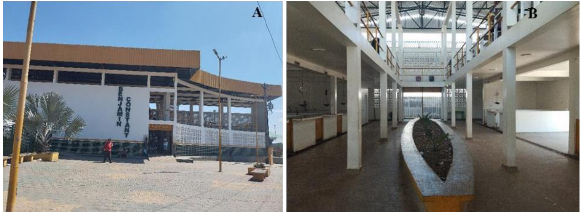
Figura 4: Mercado Municipal Vitor Magalhães. A – Vista externa do mercado, e B – vista interna do mercado. Fonte: A autoria própria.