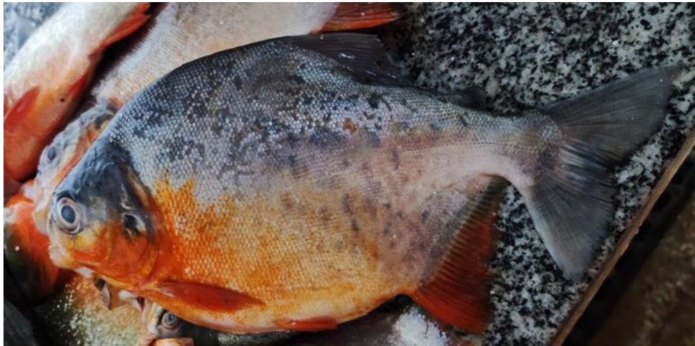
Figura 19: Piaractus brachypomus .

uniformemente cinza-escuro. A pirapitinga vive em água doce, preferindo rios de água branca e clara, com um pH entre 4.8 e 6.8 e temperaturas de 23°C a 28°C.