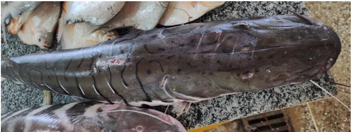
Figura 6: Pseudoplatystoma punctifer - Uma amostra da espécie.

Descrição: Originário de bacias como Xingu, Negro e Solimões, e encontrado no Brasil, Equador, Colômbia e Peru, essa espécie conhecida como pintado, cachara, pintadillo rayado (Colômbia), doncella (Peru), surubi (Bolívia) e surubim (Brasil), pode atingir 1 metro de comprimento e 12 kg. Com focinho largo, nadadeira caudal arredondada, dorso escuro e ventre esbranquiçado, habita rios, lagos e igarapés. Carnívoro, alimenta-se de peixes e camarões, tem hábito noturno e desova na enchente, com fecundidade de 1,5 milhão de ovócitos. É hermafrodita protogínica, nascendo fêmea e alguns se transformando em machos. Apesar de sua importância econômica direta ser pequena, é relevante na pesca comercial e piscicultura na Amazônia e muito presente na cultura alimentar da população. Durante a pesquisa de campo, destacou-se várias vezes, com valor variando entre 20 e 25 reais o kg. Em dias de abundância, era vendido em cambadas, variando de 25 a 30 reais o kg.