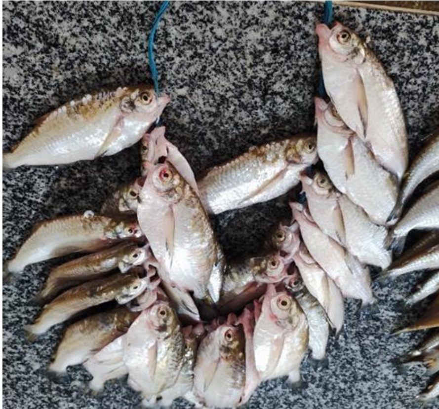
Figura 20: Triportheus angulatus . Cambada.

longos. Tem 32 a 35 rastros no primeiro arco branquial e uma linha lateral com 34 a 36 escamas. Sua coloração é cinza-metálico, mais escura no dorso. Onívoro, alimenta-se de frutos, sementes, insetos e invertebrados. Forma cardumes e realiza migrações reprodutivas e tróficas, desovando em águas brancas e vivendo em áreas de várzea. Essa espécie é comercializada em cambadas ou kg, considerando o seu porte pequeno, com o valor médio de 15-20 reais. É de grande importância no aspecto alimentar da população.