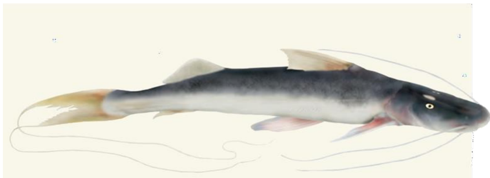
Figura 12: Brachyplatystoma platynemum .

Descrição: O Brachyplatystoma platynemum , conhecido localmente como bagre, baboso ou mota flemosa em algumas áreas da América do Sul, é um peixe de grande porte que pode alcançar até 1 metro de comprimento. Ele possui uma cabeça achatada, olhos pequenos e barbilhões maxilares largos e achatados. Sua coloração varia entre cinza-azulado no dorso e amarelo no ventre, sem manchas visíveis. Este peixe é encontrado principalmente na calha principal do rio Solimões/Amazonas e seus afluentes de água branca, ocasionalmente aparecendo em áreas de várzea. Ele é carnívoro, alimentando-se de peixes e invertebrados, e realiza migrações anuais, provavelmente para se reproduzir nas cabeceiras dos rios de águas brancas. Embora seja conhecido localmente como mota ou babão, sua importância econômica é limitada, sendo comercializado ocasionalmente junto com outras espécies a preços variáveis, geralmente entre 10 e 15 reais por exemplar.