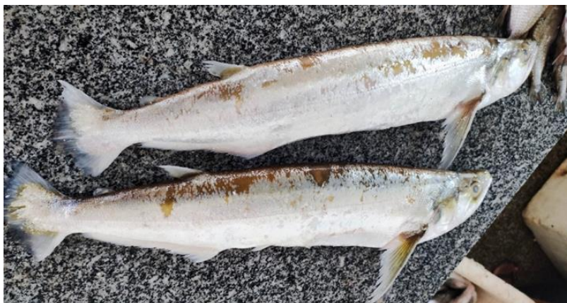
Figura 35: Acestrorhynchus falcistrotris . Cambada.

Uma característica marcante desta espécie é a presença de dentes caninos de tamanhos variados. A maxila superior possui um par de presas relativamente grandes posicionadas atrás de um par de pequenos dentes cônicos, que são cobertos por tecido carnoso. A linha lateral do peixe possui entre 140 e 175 escamas, com 30 a 37 séries de escamas localizadas entre a origem da nadadeira dorsal e a linha lateral, e 17 a 22 séries entre a linha lateral e a base da nadadeira anal.