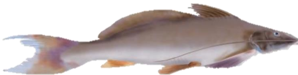
Figura 5: Pinirampus pinirampu .

Descrição: Tendo como nome popular “barba-chata” ou “piranambu”, esta espécie possui o porte grande, até 60cm; corpo roliço, ligeiramente elevado; nadadeiras sem espinho; adiposa longa, estendendo-se até próximo à base da dorsal; barbilhões achatados; palato sem dente; dentes bucais em placas relativamente largas; coloração uniformemente cinza, mais clara no ventre que no dorso; ocorre em rios e lagos de água branca, preta e clara. Tem sua importância no aspecto alimentar da população, sendo vendida por cambada no valor de R$20,00, destacando-se por várias vezes durante as visitas.