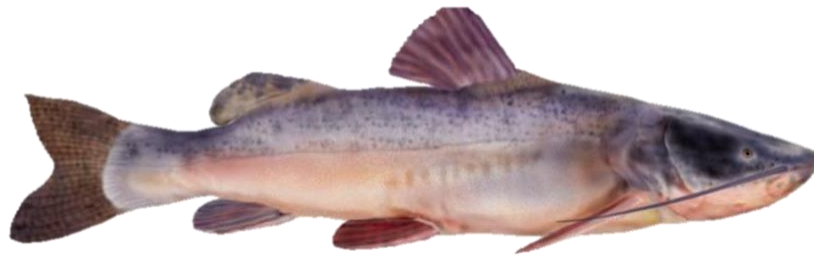
Figura 8: Zungaro zungaro .

Espécie: Brachyplatystoma vaillantii (Valenciennes, 1840)