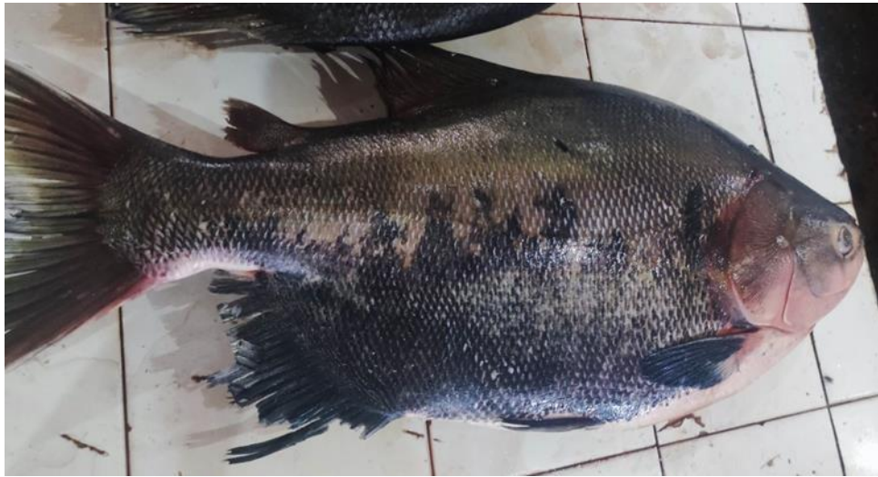
Figura 15: Colossoma macropomum .

juvenis apresentando uma mancha escura arredondada que desaparece na fase adulta, onde a coloração varia conforme o tipo de água.