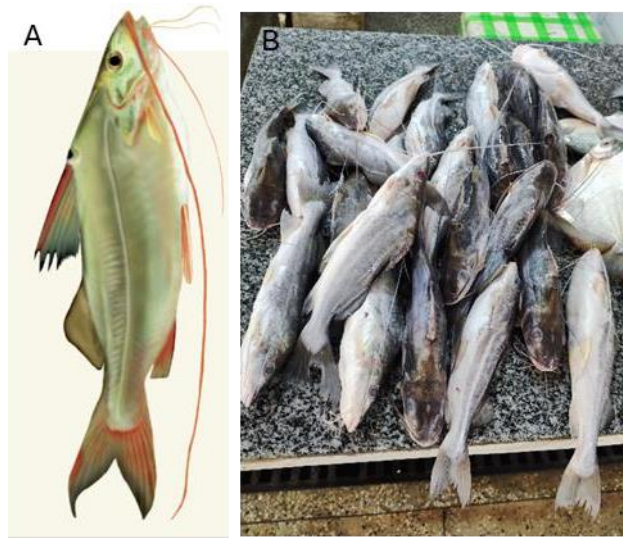
Figura 4: Pimelodus blochii . A – Exemplar da espécie, e B – exemplares da espécie na bancada sendo comercializada em cambada.

cambada no valor de R$20,00 (vinte reais). Mesmo tendo se destacando somente uma vez durante as idas, essa espécie possui uma importância econômica e cultural no município.