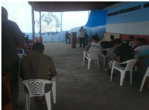
Figura 8: Culto promovido pela igreja carcerária

A igreja tem promovido, ainda, cultos todos os sábados recebendo pela manhã obreiros, missionários e pastores de diversas denominações (pentecostais e neopentecostais) oferecendo aos reclusos o exercício da fé e “[...] a possibilidade de se sentir parte integrante de uma comunidade, de estabelecer laços sociais que o vincule novamente à sociedade e que dê sentido à sua pertença social” (DIAS, 2007, p. 223).