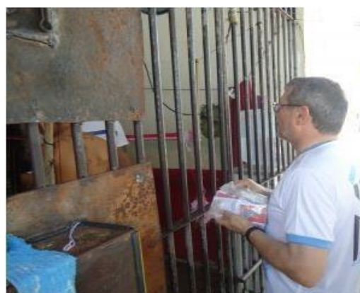
Figura 15: Pastoral Carcerária na Diocese de Parintins.