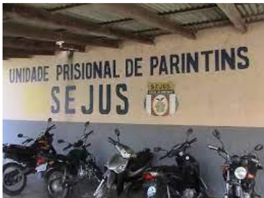
Figura 3: Entrada da UPPIN