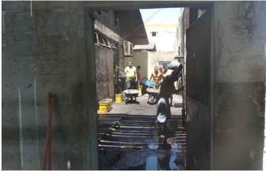
Figura 5: Parte interna UPPIN.