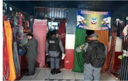
Figura 6: Parte interna UPPIN.

Quanto a sua população, no início desta pesquisa a unidade continha 170 (cento e setenta) reclusos constatando-se, para tanto, uma superlotação na unidade, visto a instituição conter o número de pessoas superior ao que suporta. Atualmente possui 37 (trinta e sete) detentos nos sistemas fechado, provisório, semiaberto e aberto, pois este percentual dar-se-á pelo fato de que com o avanço do novo COVID-19, a maioria dos sentenciados foram removidos para outros estabelecimentos penais localizados nos municípios vizinhos.