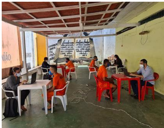
Figura 11: Atendimento defensoria aos presos da UPPIN

No tocante deste estudo, a Constituição de 1988 nos revela importante face relativa à instituição, à medida que a determina expressão e instrumento do regime democrático. De acordo com José Afonso da Silva (Curso de Direito Constitucional Positivo, 2008 apud Ré):