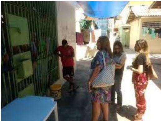
Figura 9: Atendimento de instituições públicas e da defensoria aos presos da UPPIN

Além de oferecer tratamento humanitário e o cumprimento da legislação, estas parcerias buscam mecanismos para o enfrentamento e combate da violência, beneficiando não somente o recluso, mas a sociedade que os receberá pós-cárcere ressocializados.