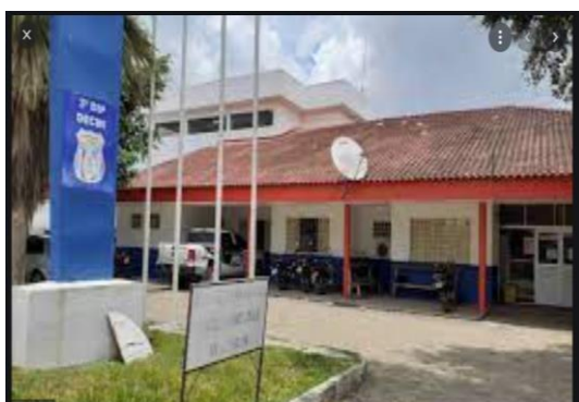
Figura 16: Delegacia de Polícia de Parintins

A delegacia passou a funcionar no bairro do Itaúna, seu antigo prédio fora reestruturado para funcionamento de um presídio, a Unidade Prisional de Parintins. Atualmente a delegacia encontra-se, especificamente, na rua Irmã Cristine, recebendo o título de Terceira Delegacia Interativa de Polícia (DIP), estando ainda anexa à Delegacia da mulher com capacidade para trinta e dois reclusos, provisórios, que aguardam sua sentença.