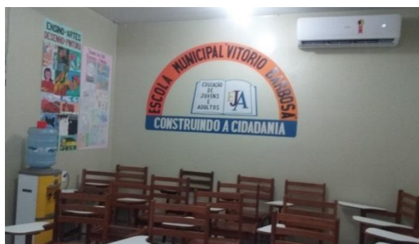
Figura 1: Sala de aula (área interna do presídio)

No seu interior abriga uma escola que funciona desde 2005, criada por iniciativa da Secretaria Municipal de Educação (SEMED) inserindo os detentos na rede de ensino do município. Nela os detentos possuem acesso à educação na Modalidade de Educação de Jovens e Adultos, que do percentual enclausurado 10 são matriculados na escola (nove homens e uma mulher) e os outros 27 fazem parte de outros projetos educativos e religiosos.