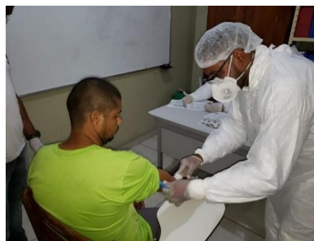
Figura 13: Atendimento antes e durante a pandemia