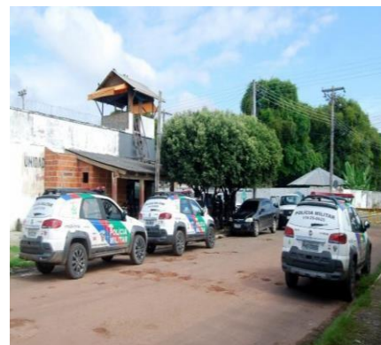
Figura 4: Entrada da UPPIN.