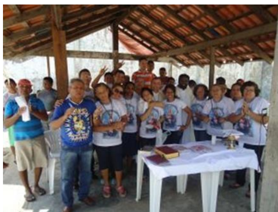
Figura 14: Pastoral Carcerária na Diocese de Parintins.

Ainda sobre as ações realizadas na unidade prisional de Parintins temos a pastoral Carcerária, que realizou antes da pandemia reuniões, cultos e celebrações tanto da comunidade evangélica quanto da comunidade católica da Diocese de Parintins. As visitas do grupo da Pastoral ao presídio parintinense ocorre aos sábados, quando também há celebração de missa ou cultos.