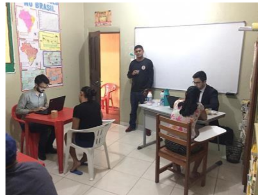
Figura 10: Atendimento de instituições públicas e da defensoria aos presos da UPPIN