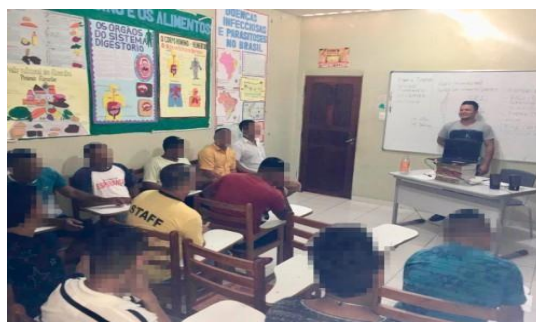
Figura 7: Sala de aula

A unidade prisional possui algumas salas que funciona a administração, cozinha e entre outros, sendo que uma delas é destinada a Escola Municipal Vitório Barbosa, na qual funciona a Educação de Jovens e Adultos (EJA) pela manhã de 8:00h às 11:00h e a tarde de 14:00h às 17:00h, porém, a sala destinada à aula é pequena (estimada em 12m 2 ).