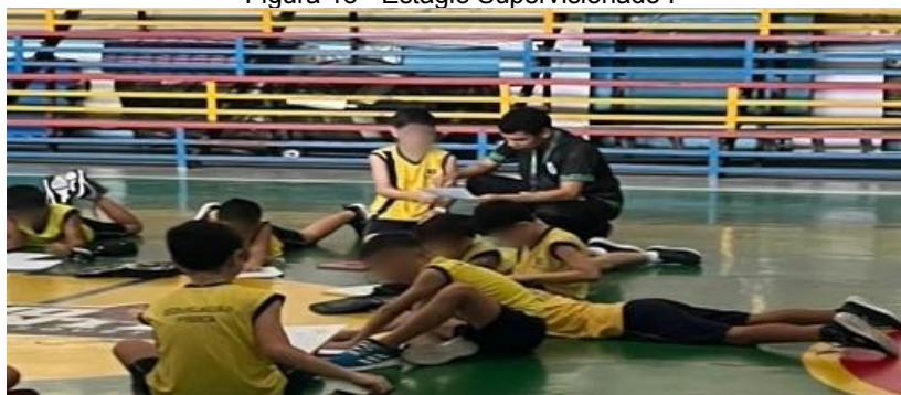
Figura 13 - Estágio Supervisionado I

O sétimo período trouxe um dos meus maiores tormentos, o Estágio Supervisionado I, que me obrigava a escrever o caderno de Estágio I, o qual tive que refazer três vezes. E na autoavaliação, o colega disse que eu coloquei muita cola e não podia ter letra feia. Fiquei muito bravo. Como minha letra ia ficar linda do dia para noite e com um monte de coisas para fazer?