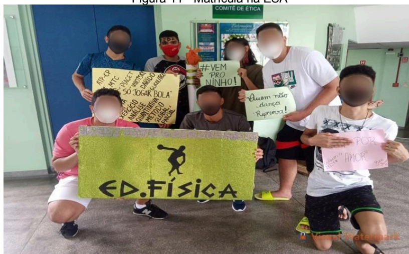
Figura 11 - Matrícula na ESA

No dia 26/07/2021, fiz minha matrícula, presencialmente. Minha mãe auxiliou-me no preenchimento das fichas e fui recepcionado por um pequeno grupo de alunos, pois ainda havia restrições impostas ao convívio social. Foi muito legal! Eles pintaram minha testa, tiramos fotos e senti-me parte da universidade naquele momento. Mas era só um passo em meio aos desafios e barreiras atitudinais, pessoais e sociais que estavam por vir na minha vida.