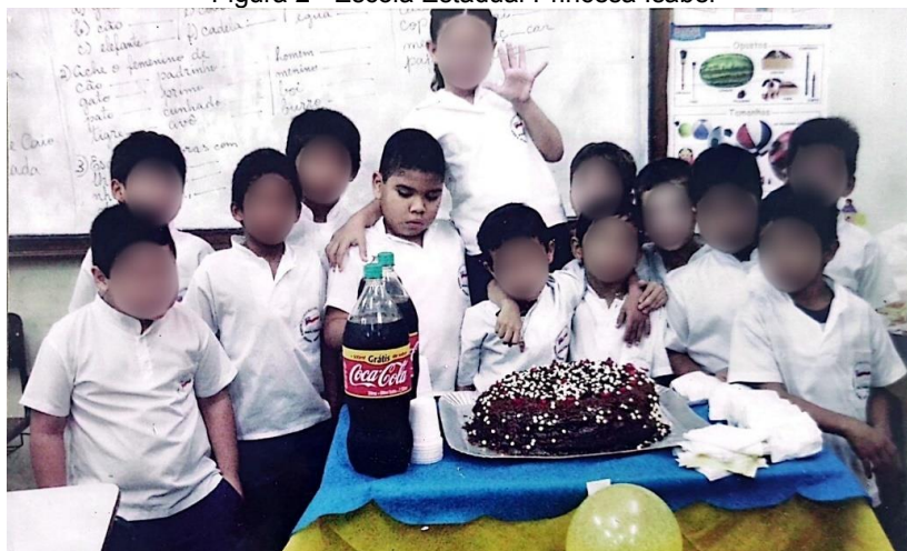
Figura 2 - Escola Estadual Princesa Isabel

de Araújo, onde desenvolvia atividades com psicólogas, psicopedagogas, fisioterapeutas e fonoaudiólogas. Nesse contexto, participava de atividades psicomotoras diversas, atividades lúdicas individuais e coletivas voltadas ao estímulo da coordenação visomotora, linguagens, expressão de sentimentos, relaxamento e socialização.