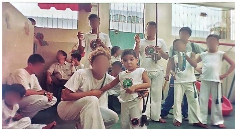
Figura 7 - Capoeira, na Educação Infantil