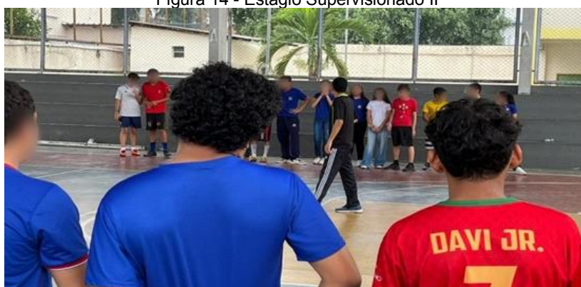
Figura 14 - Estágio Supervisionado II

Futsal é um jogo que eles gostam muito, e treinar o esporte, por partes, de forma lúdica, focando no desenvolvimento de habilidades específicas, é muito gratificante. Porém percebi que para um profissional com TEA, que precisa de suporte, será uma luta ainda maior a inclusão no mercado de trabalho.