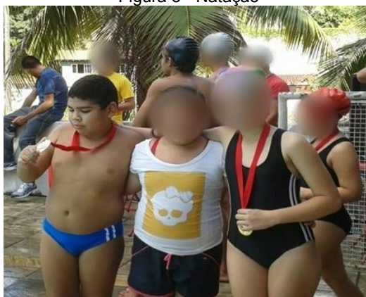
Figura 3 - Natação

Meu cotidiano permaneceu com reforço escolar e eu fazia, ainda, aulas de natação, que ajudavam a controlar minha respiração e resistência, fazendo os estilos crawl, borboleta e prancha, além de participar de todas as competições, ocasiões em que todos ganhavam medalhas.