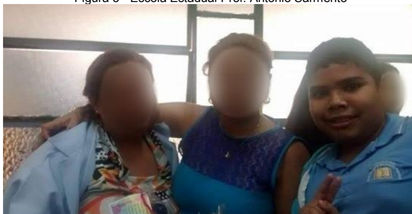
Figura 5 - Escola Estadual Prof. Antônio Sarmiento

Também fui encaminhado pela Secretaria de Estado de Educação (SEDUC), para participar da Sala de Recursos na Escola Estadual Frei Silvio Vagheggi, onde trabalhavam assuntos referente às disciplinas da escola. Isso me ajudava bastante nas avaliações, mas ainda fiquei no reforço até o 6º ano.