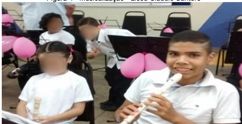
Figura 4 - Musicalização - Liceu Claudio Santoro

Continuei fazendo musicalização no Liceu de Artes e Ofícios Claudio Santoro, onde aprendi a tocar flauta e conheci todos os instrumentos musicais. A música ajudava-me na coordenação motora, habilidades cognitivas, percepção, concentração, atenção, interação social e desenvolvimento emocional. A professora era muito legal e divertida, ajudando-nos a fazer apresentações para nossos pais, já que participávamos do Concerto de Natal