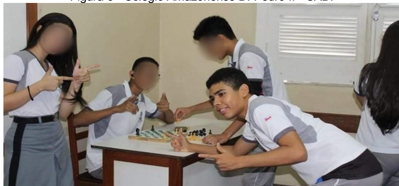
Figura 8 - Colégio Amazonense D. Pedro II - CADP

Nessa escola, fui bem recebido, participei de todos os eventos, passeios, atividades extraclasse e até competições, como os Jogos Escolares do Amazonas (JEA'S), oportunidade em que, pela primeira vez, pude jogar e representar a escola, competindo em várias modalidades nos Jogos Adaptados André Vidal de Araújo (JAAVAS) e ganhando medalhas. Já nos jogos internos, participei de diversas modalidades, inclusive voleibol, mesmo sem saber jogar. Foi muito divertido. Meus colegas colocaram-me no time de futsal e futebol e participei, ainda, quase ganhando, do tênis de mesa, que não jogava há muito tempo.