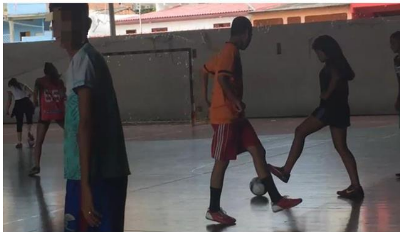
Figura 6 - Futsal na Vila Olímpica

O professor tinha que separar as equipes para podermos jogar e parava o jogo para que eles passassem a bola para nós. Sentia-me excluído e as meninas também. Por isso, minha irmã desistiu.