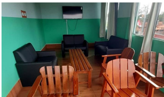
Figura 10: Sala convivência