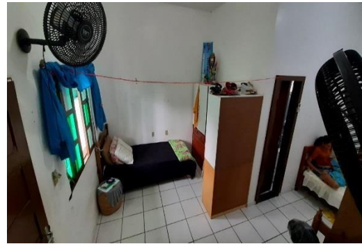
Figura 7: Dormitórios com capacidade para três acadêmicos

Com o propósito de aprofundar a compreensão sobre a relação entre tipo de moradia dos estudantes e desempenho acadêmico, Turley e Wodtke (2010) compararam o rendimento médio de estudantes que moravam da casa a aqueles que moravam fora com suas famílias, aqueles que moravam fora sem a família e aqueles que viviam em outros tipos de residência.