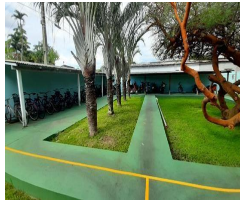
Figura 2: Parte externa e interna da casa do estudante