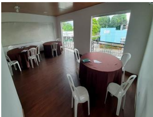
Figura 8: Sala de estudos 1º e 2º andar

Os autores verificaram que, em alguns grupos de estudantes, morar em residências universitária causa impacto mais expressivo sobre o desempenho acadêmico considerando toda a infraestrutura que a mesma apresenta, como é possível percebemos nas imagens referente as salas de estudo e de conveniência disponibilizadas na casa para os estudantes.