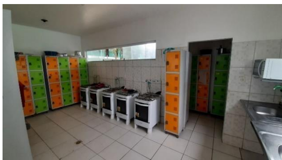
Figura 12: Cozinhas

Assim alguns estudantes conseguem realizar ações terapêuticas imediatas que colaboram a fim de intervir o mais rapidamente possível com algumas situações de inesperadas decorrentes da ansiedade, medo e demais sensações decorrentes da depressão, assim esse local acaba minimizando o sofrimento e impede a evolução dos sintomas (Costa, 2007; McGorry & Edwards, 2002). Destacamos a importância de apresentarmos a casa do estudante de Parintins mostrando que os espaços da casa permitem ações específicas que podem subsidiar futuros programas de proteção, prevenção e assistência universitária ainda mais adequados às necessidades dessa população.