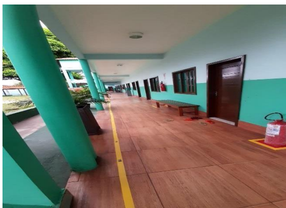
Figura 4: Corredor ala feminina e ala masculina de dormitório

A Casa do Estudante da Universidade do Estado do Amazonas, está localizada no centro da cidade, tem 02 andares e é composta por 33 quartos, cada quarto tem capacidade para abrigar 03 moradores em cada quarto há condicionadores de ar, camas e armários fornecidos pela casa, o estudante só precisa levar seus pertences pessoais, a casa conta em sua estrutura com 02 salas de estudos, 01 sala com computadores para que os acadêmicos utilizem em seus trabalhos, 02 áreas para convivência com TV, 01 cozinha equipada com armários, fogões e geladeiras, lavanderia equipada, estacionamento, quadra de areia para recreação e 01 área externa também para recreação. Como nos mostra nas imagem .