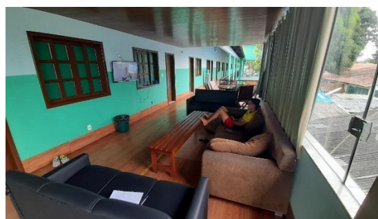
Figura 11: Sala convivência

A Casa do Estudante é um espaço de convivência e socialização que busca oferecer aos seus alunos um ambiente favorável para estudar e residir durante o curso. Para acessar este auxílio, o estudante deverá candidatar-se em edital próprio divulgado no Portal UEA ( www.uea.edu.br ), conforme critério de vulnerabilidade socioeconômica.