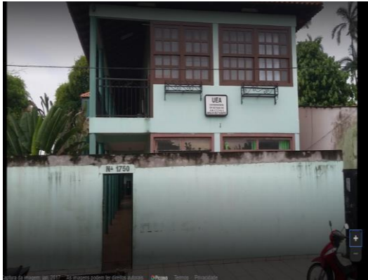
Figura 1: Parte externa e interna da casa do estudante

O universo da pesquisa foi a casa do estudante da universidade do Estado das Amazonas de Parintins /CESP –UEA, A casa do estudante no município de Parintins está localizada na Rua Getúlio Vargas, bairro: Centro.