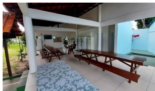
Figura 13: Cozinhas

Para Magalhães (2004), o lugar ocupado por um edifício na paisagem física e humana, seus acessos ou formas de isolamento refletem, condicionam ou estimulam a relação com a comunidade envolvente. Esta localização central, mais do que ter contribuído na mobilidade de seus moradores, parece ter sido decisiva para fomentar estratégias de manutenção financeira da instituição, por facilitar o acesso do público externo ao Restaurante Universitário e à reunião dançante por ela mantidos.