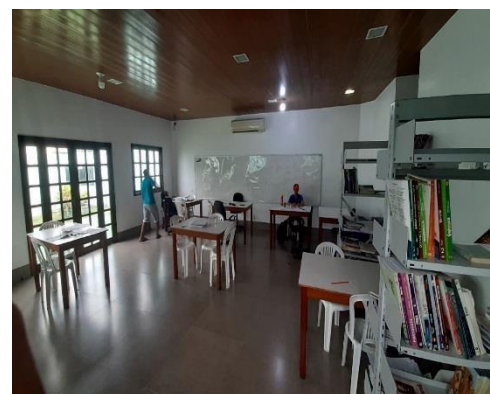
Figura 9: Sala de estudos 1º e 2º andar