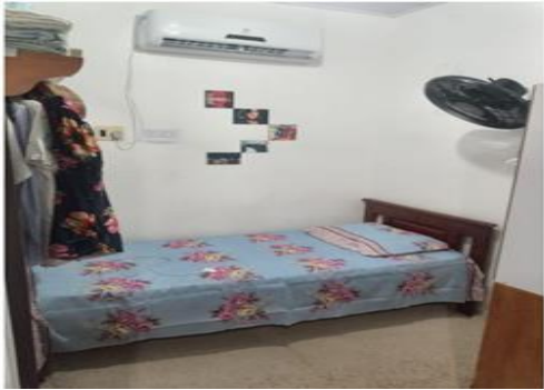
Figura 6: Dormitórios com capacidade para três acadêmicos