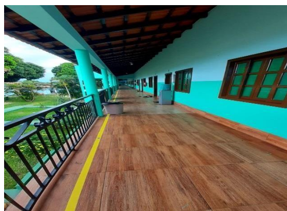
Figura 5: Corredor ala feminina e ala masculina de dormitório