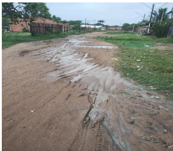
Imagem 1: Rua do Bairro Nova Conquista

as identidades se constroem nas fronteiras da resistência — e o Boi de Lama foi exatamente isso: um símbolo criado por sujeitos marginalizados que decidiram se ver e se representar de forma digna.