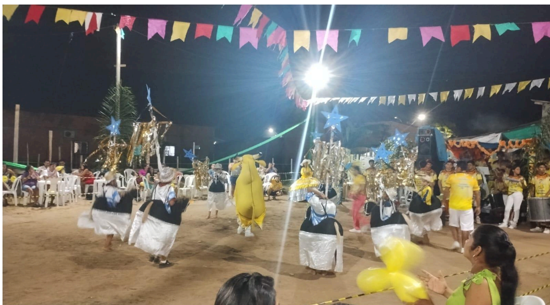
Imagens 9 a 11: Boi Inxiridinho, Diretoria e Apresentação do Boi para a comunidade.