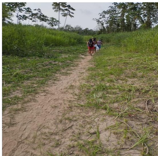
Figura07: Percurso da praia