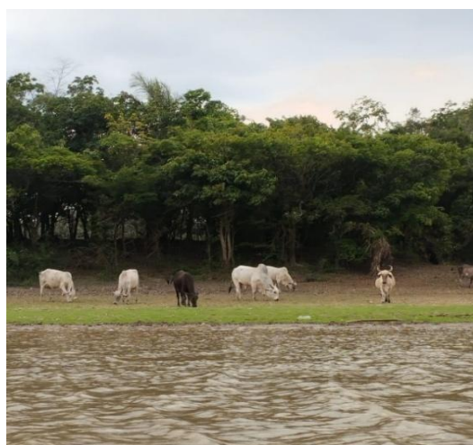
Figura09: Gados nas margens do rio