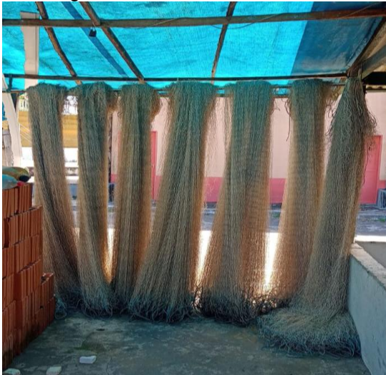
Figura 02: Malhadeiras

A técnica da malhadeira muito utilizada na comunidade, em que existe diferentes tipos, malhadeira: simples que é usada para peixes menores, tresmalho, que é malhas de tamanhos variados, e redes de espera, que é deixada por períodos longos. (figura 02) e (Figura 03).