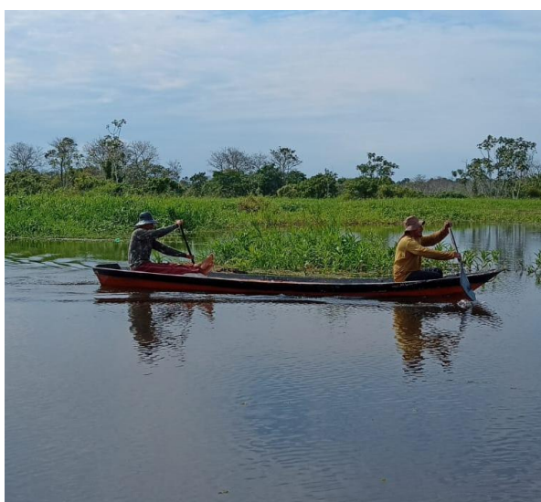
Figura 04: Pescadores usando botes