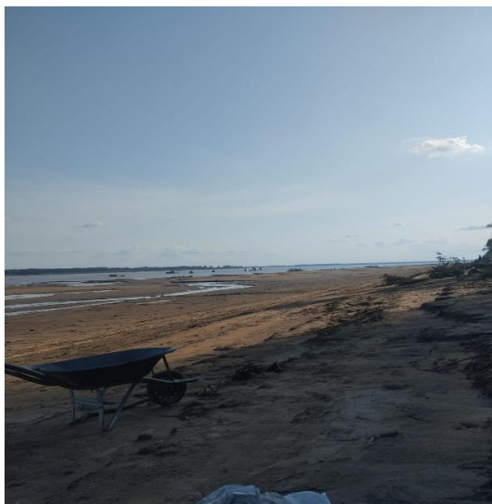
Figura 06: Praia do Amazonas