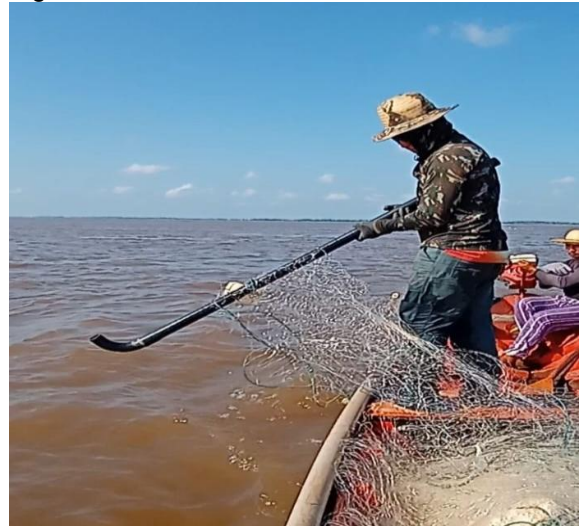
Figura 03: Pesca com a malhadeira