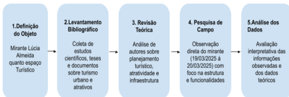
FIGURA 01- Etapas da pesquisa Metodológica

partir disso, espera-se contribuir com a formulação de estratégias voltadas à valorização e gestão do espaço, fornecendo subsídios relevantes tanto para pesquisadores quanto para profissionais da área do turismo.