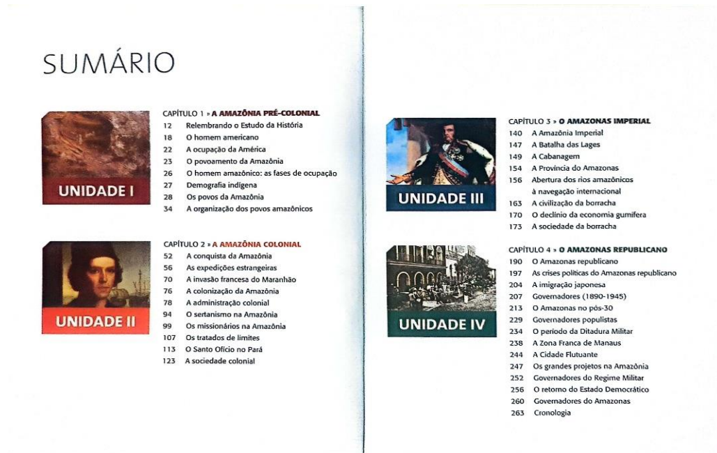
Figura 2 - Livro: Tópicos: História do Amazonas.