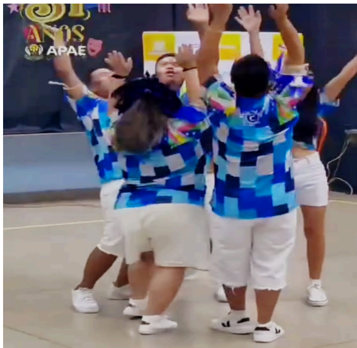
Figura 1 – XII Festival Nossa Arte na APAE Manaus – Coreografia adaptada pela pesquisadora da música Ritmo Quente do Boi-bumbá Caprichoso.