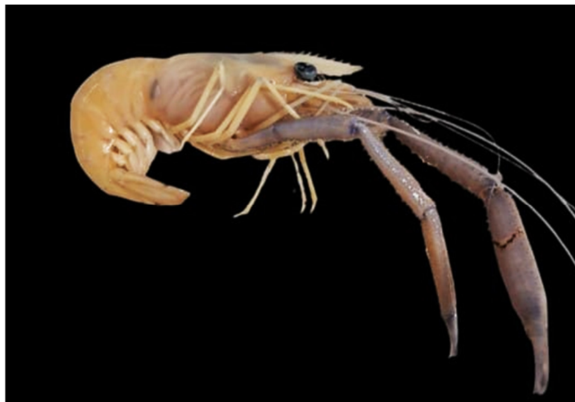
Figura 6. Exemplar de Macrobrachium hetherochirus coletado

Essa espécie apresenta indivíduos relativamente maiores que as demais espécies e tem preferência por águas próximas das áreas costeiras (De Melo, 2003), o que evidencia a presença de poucos indivíduos na área de coleta, mas por não apresentar exigências quanto a alimentação, foram encontrados na região.