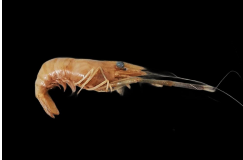
Figura 8. Exemplar de Macrobrachium surinamicum coletado