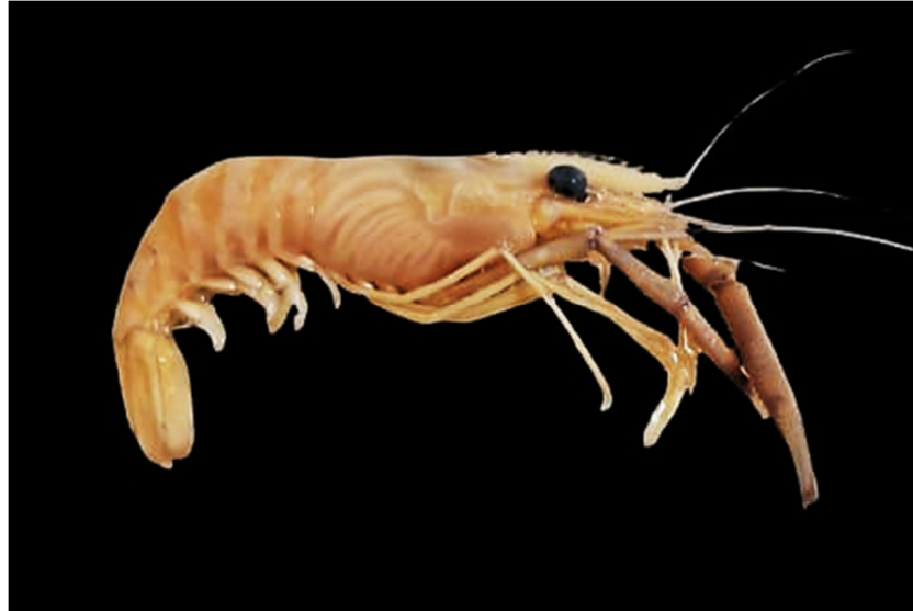
Figura 11. Exemplar de Pseudopalaemon chryseus coletado