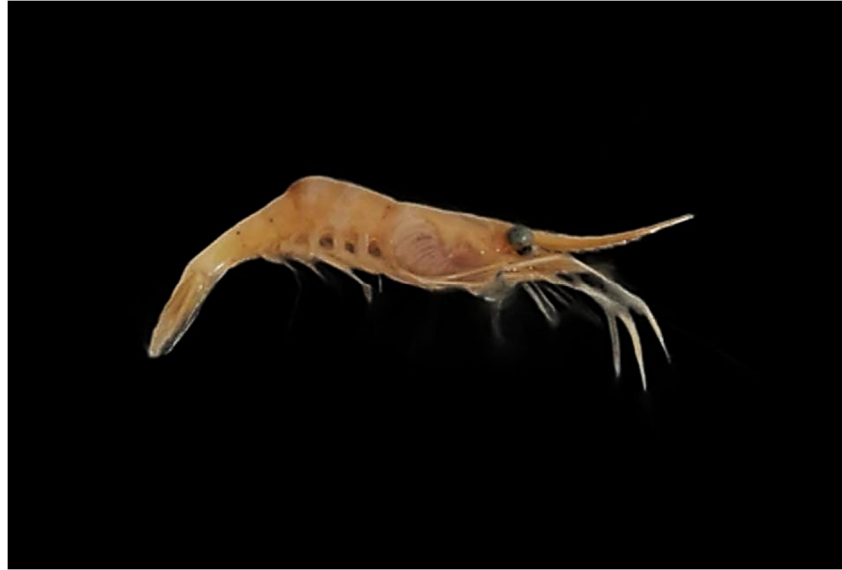
Figura 5. Exemplar de Macrobrachium jekii coletado