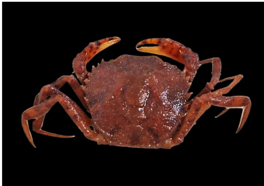
Figura 16. Exemplar de Valdivia novendentata coletado

Essa espécie tem distribuição mais restrita com preferência por águas negras, com corredeiras e pH ácido como no médio e alto Rio Negro, a mesma é considerada agressiva e apresenta tamanho mediano se comparada com as demais, também buscam ambientes lânticos e vivem próximos as margens (Magalhães e Pereira, 2007).