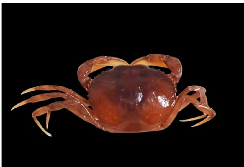
Figura 18. Exemplar de Morcirocarcinus laevifrons coletado