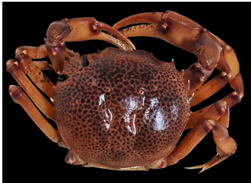
Figura 17. Exemplar de Sylviocarcinus pictus coletado

Essa espécie tem ampla distribuição dentro da Amazonia na região norte-nordeste do Brasil, não apresentando preferência pelo tipo e pH da água em que vive, pois o mesmo apresenta, mesmo sendo aquático, hábitos anfíbios (Mantelatto et. al. , 2025), sendo o mesmo foi capturado em área de igapó.