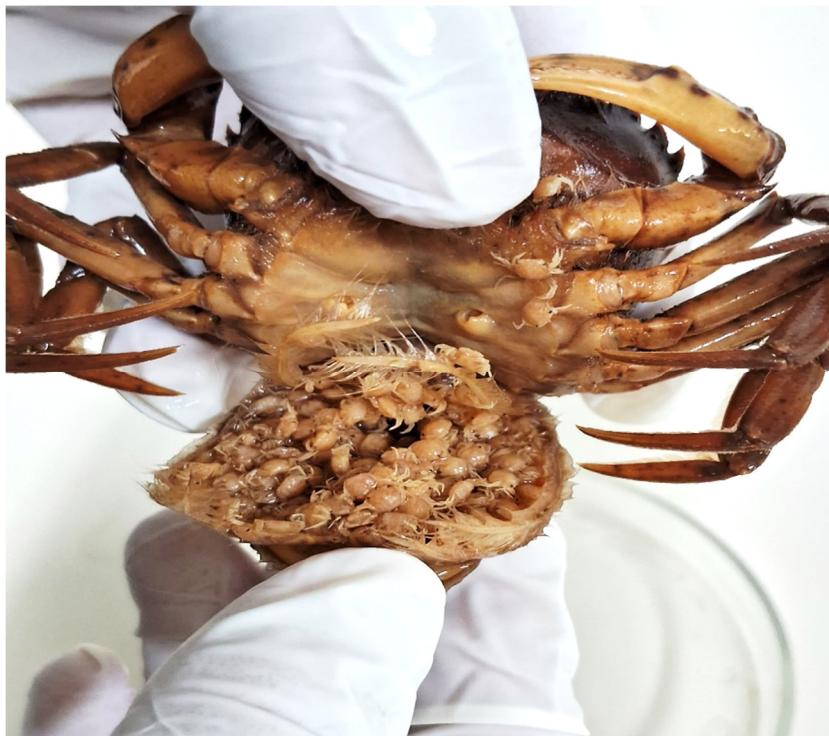
Figura 19. Fêmea de Brachyura com indivíduos jovens em seu abdome

Na média geral, foi obtida a média de 10,63 mm do comprimento da carapaça (CC) para os Carideos e, para os Braquiúros, a média obtida para essa variável foi de 27,16 mm no CC e 27,95 mm na LC. A razão sexual evidenciou uma média aproximada de 2 machos por 1 fêmea, ou seja, razão sexual de \frac{1}{2} no caso dos Caridea e, aproximadamente 1/1 nos Brachyura. Nessa perspectiva, foi encontrada no período da seca, na primeira coleta, uma fêmea de braquiúro (caranguejo) com indivíduos jovens (juvenis) em seu abdome (Figura 19). Nenhum dos carideos apresentaram ovos ou indivíduos jovens. A fêmea com indivíduos jovens em seu abdômen é da espécie Rotundovaldivia latidens .