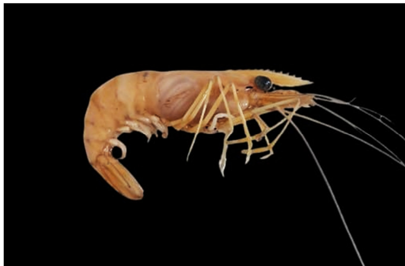
Figura 7. Exemplar de Macrobrachium nattereri coletado

Esta espécie não tem preferência por águas negras, porém é mais comumente encontrada em águas ácidas e corrente, é uma espécie agressiva, mas que vive de forma sintópica com o M. ferreirai (Gualberto, De Almeida e Menin, 2012).