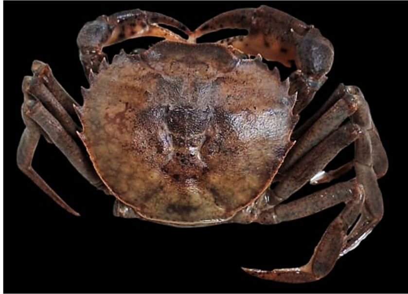
Figura 15. Exemplar de Dilocarcinus pagei coletado