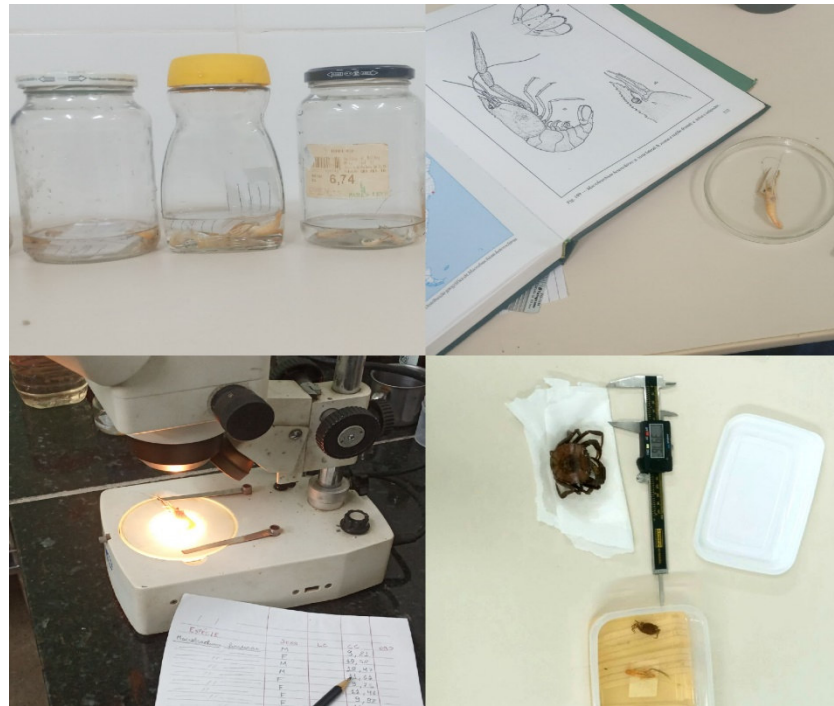
Figura 3. Procedimentos laboratoriais