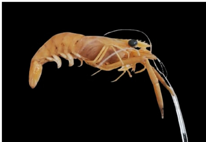
Figura 9. Exemplar de Macrobrachium potiuna coletado

Esta espécie tem preferência por águas com maior quantidade de sedimentos e de pH mais neutro, também por grandes cursos d'água (Muller e Carpes, 1991), o que evidencia apenas um indivíduo ser coletado.