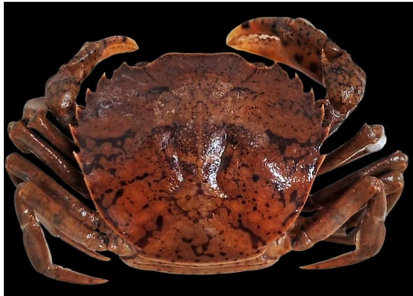
Figura 14. Exemplar de Rotundovaldivia latidens coletado

Espécie que apresenta preferência por águas negras, profundas e, com pH ácido, considerada como espécie agressiva logo geralmente solitária (De Melo, 1996), a mesma busca sempre bastante alimento nas margens o que facilitou sua captura durante a coleta.