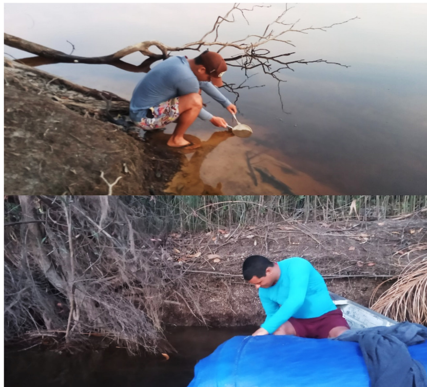
Figura 2. Coleta ativa de campo com utilização do pulcá e da peneira por dois coletores

Dos pontos de coleta foram registradas as coordenadas, com o auxílio de GPS (Garmin) e imagens, registrados por máquinas fotográficas. As coletas ativas foram realizadas com o auxílio de puçás e peneiras (imagem dos equipamentos nos Anexos), que foram utilizadas junto as macrófitas subaquáticas (Figura 2), na vegetação marginal e sobre a serra pilheira aquática. Em cada ponto de coleta, 2 coletores percorreram em transecto uma distância pré-definida de 2 km por aproximadamente 01 hora e 30 minutos no período noturno (entre 20:00h e 22:00h) e próximo do amanhecer (entre 04:00h e 06:00h).