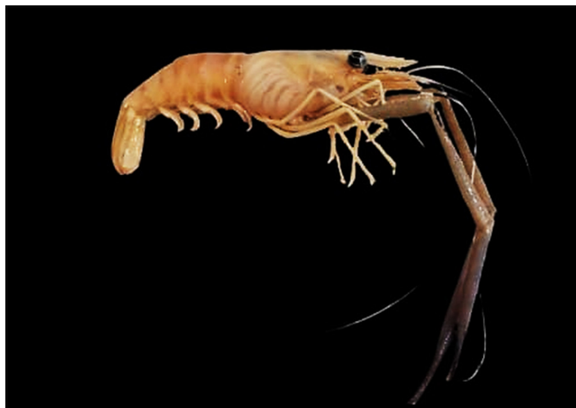
Figura 10. Exemplar de Macrobrachium acanthurus coletado

Espécie que vive na sua grande maioria em sintopia com o M. heterochirus já que tem preferência por águas próximas de áreas costeiras, além de ser considerada agressiva e ter tamanho médio grande (De Melo, 2003), por este motivo foram encontrados poucos indivíduos durante as coletas.