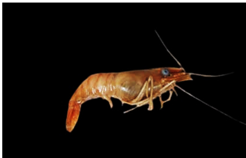
Figura 12. Exemplar de Pseudopalaemon nigramnis coletado

Essa espécie tem preferência por águas de pH mais neutro entre 6,0 e 7,5, porém a mesma foi registrada em sua maioria em bacias como a do Rio Negro, é uma espécie pacífica, mas que não se concentra em grandes populações (Acevedo e Lasso, 2017), o que evidencia a coleta de apenas um indivíduo.