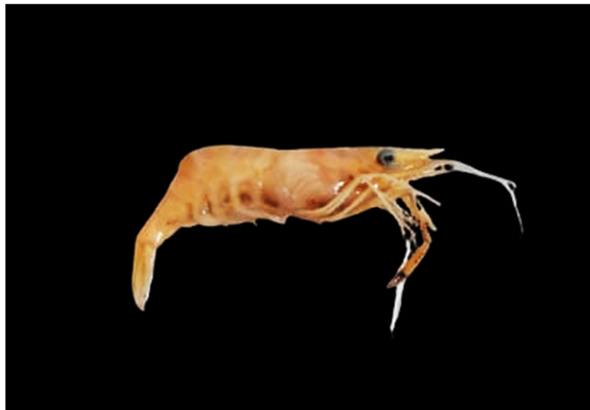
Figura 13. Exemplar de Paleamonetes mercedae coletado

Capturado em um corpo d'água fechado, porém é descrito que essa espécie não tem preferência do tipo de água podendo variar no pH e no tipo da mesma, espécie de tamanho pequeno em relação as demais e considerada pacífica (De Melo, 2003), por isso foram encontradas uma quantidade razoável de indivíduos na coleta.