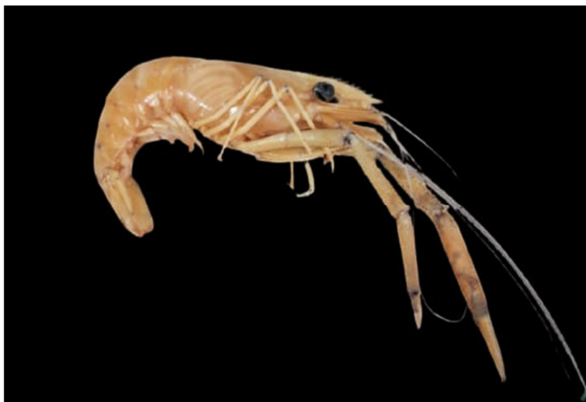
Figura 4. Exemplar de Macrobrachium ferreirai coletado

Esta tem preferência por águas negras e corrente, com pH ácido, o que evidencia ser a espécie com maior número de indivíduos coletados na região, a mesma apresenta quelípodos longos e robustos, bem aparentes nos machos na época de reprodução, espécie considerada agressiva (De Melo, 2003).