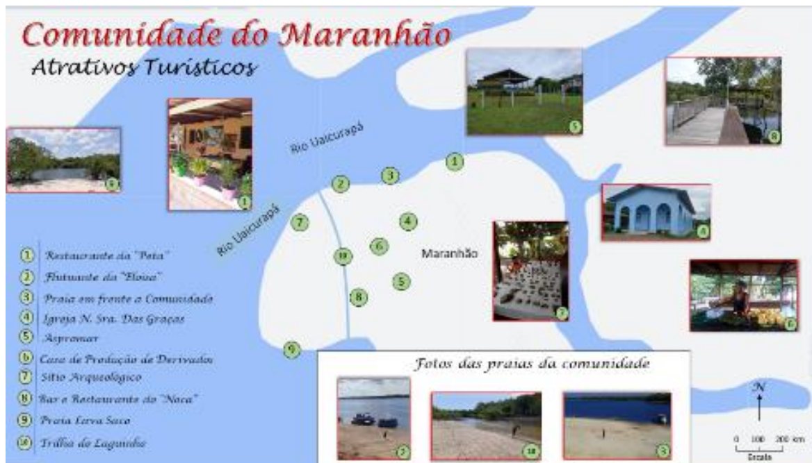
Figura 4: Mapa de Atrativos Turísticos da Comunidade do Maranhão/Parintins

Org: BRASIL, Thaynessa 2022.