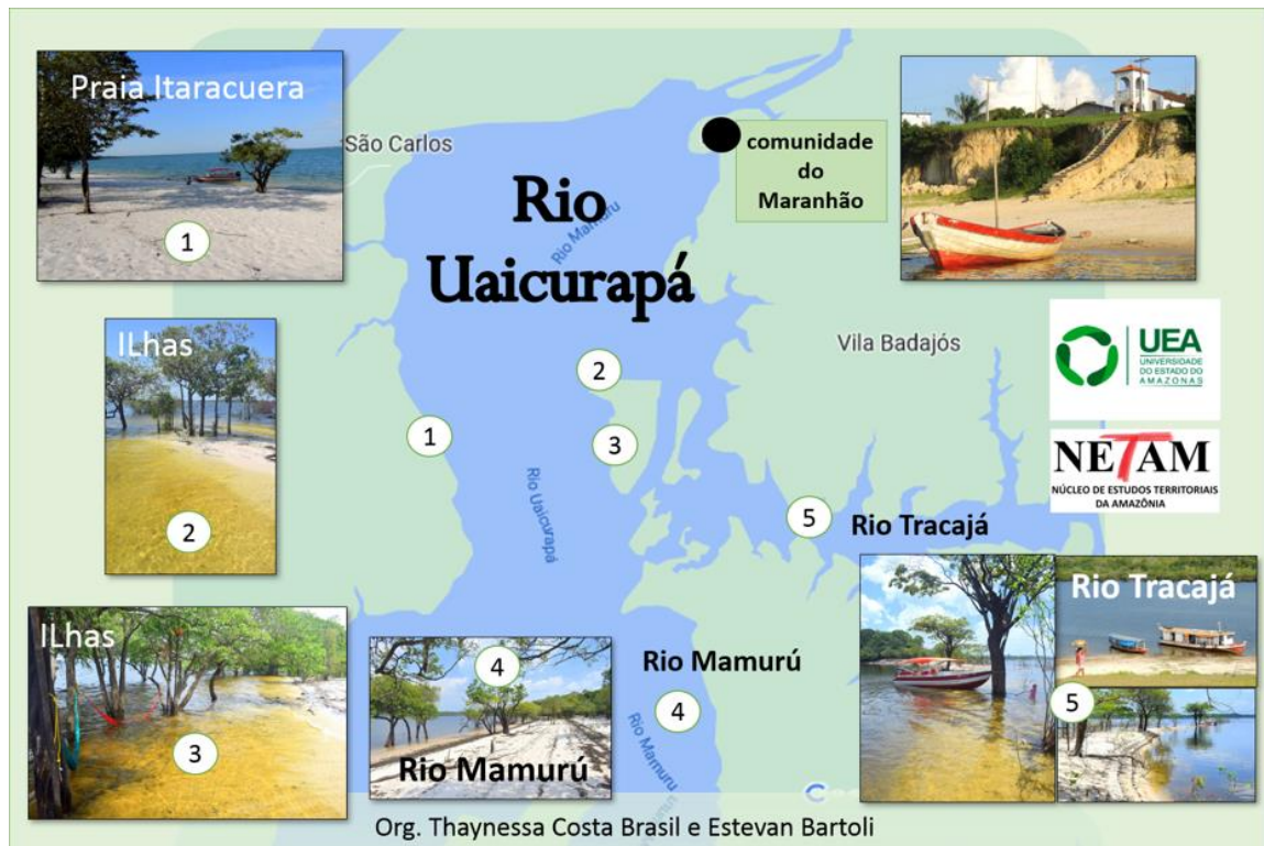
Figura 5: Mapa de Atrativos Naturais do entorno da Comunidade do Maranhão/PIN

Para quem deseja estender e conhecer outras áreas naturais, pode visitar as ilhas do rio Mamarú (ponto 2, 3 e 4) e do rio Tracajá (ponto 5), que compõe belíssimas pontas de praias.