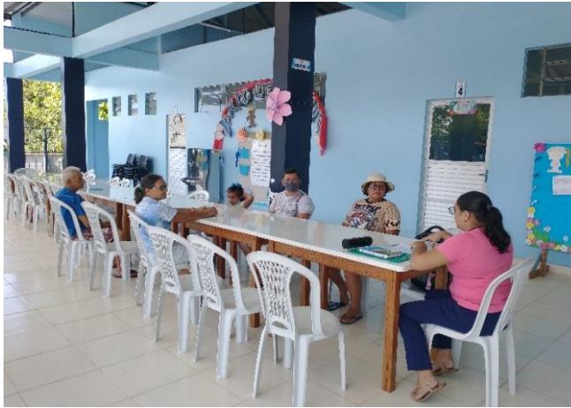
Figuras 2 e 3: Roda de Conversa na Comunidade do Maranhão/Parintins