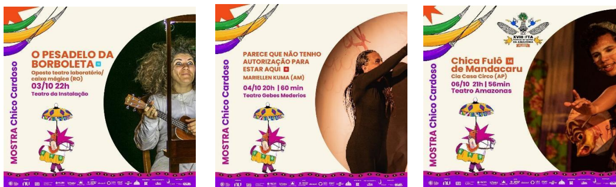
Figuras 5, 6, 7, 8, 9 e 10: Acervo pessoal, 2024

“Nepal” (MT) “Amazônia em Sonho” (PA), “Chica Fulô de Mandacaru” (AP), “Tiquim” (RR), “O Pesadelo da Borboleta” (RO) e “Parece que não tenho autorização para estar aqui” (AM).