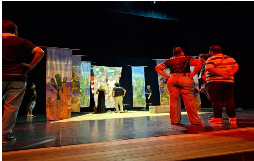
Figura 19: Acervo pessoal, 2024

Este espetáculo foi o mais tranquilo possível. Devido à montagem simultânea com o espetáculo “ Nepal ”, não consegui acompanhar a montagem presencialmente, mas fiquei tranquilo, pois já conhecia a equipe do festival de 2022. O elenco é formado por um casal que veio acompanhado da filha. A única dificuldade foi encontrá-los para entregar o kit do festival, que todos os artistas receberam, mas isso ocorreu devido à correria e aos desencontros.