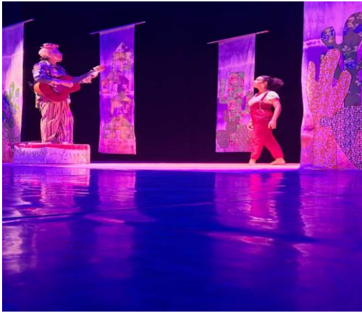
Figura 11: Acervo pessoal, 2024