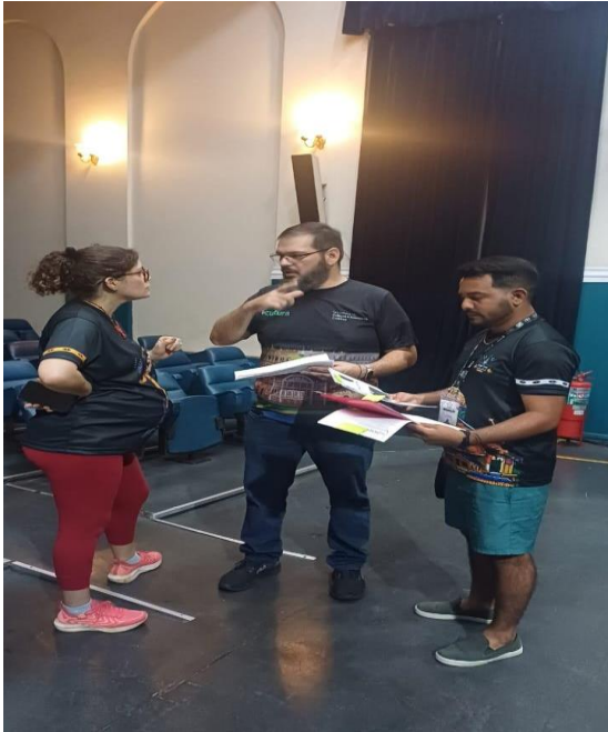
Figura 17: Acervo pessoal, 2024

Espectáculo “O Pesadelo da Borboleta” é um monólogo de Porto Velho.