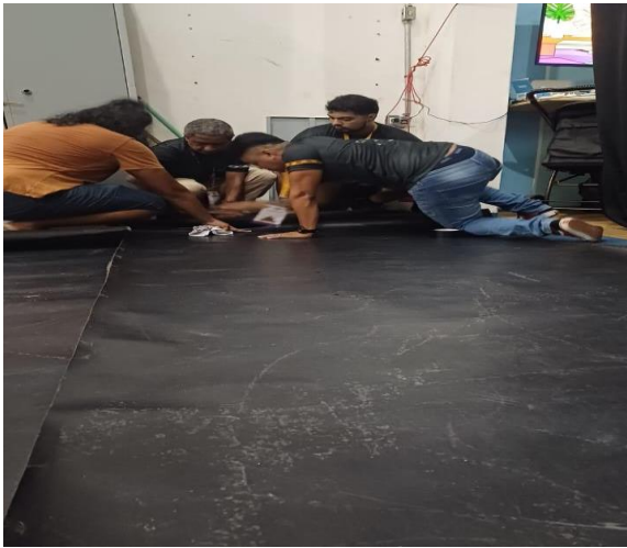
Figura 20: Acervo pessoal, 2024