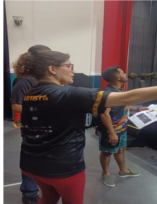
Figura 18: Acervo pessoal, 2024

A atriz chegou a Manaus sozinha e grávida de oito meses. Fiquei surpreso com o avançado estágio da gestação e pela precariedade da estrada; ela trouxe todo o seu cenário no maleiro do ônibus. Ela usava uma grade de palete, onde ficava presa pelos pés por correntes. Do camarim para o palco, ela tinha que esperar o público entrar. Como precisava estar no palco quando a plateia chegasse, ela teve que se preparar bem antes de o público começar a chegar. Além disso, como havia bebido água antes e grávida precisa ir ao banheiro com mais frequência, me bateu a preocupação com o bem-estar da artista, dada a condição em que se encontrava.