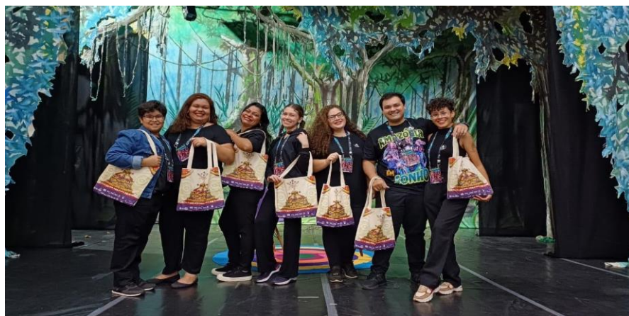
Figura 23: Acervo pessoal, 2024

Houve pedidos de mudanças na logística depois que o festival já havia começado, o que afetou o planejamento. O elenco era grande, e eu quase não consegui contato imediato com a diretora, o que foi necessário quando uma decisão rápida precisava ser tomada. A diretora pediu que a logística fosse alterada, preferindo que o elenco fosse buscado no hotel para o espetáculo, ao invés de ser deixado na rodoviária quando fosse sair da cidade. Esse pedido foi atendido, mas havia uma van disponível, e ela estava em outro local cumprindo outra demanda. Como o horário da apresentação estava apertado e eu era o responsável pelo primeiro espetáculo da Mostra, chamei a equipe e organizamos carros de aplicativo. Porém, a demora em atender e sinaliza os carros, causou alguns cancelamentos, dificultando a chegada do elenco ao Barra Vento (espaço circense onde a apresentação ocorreu). A apresentação atrasou 10 minutos, mas, no final, foi um sucesso, com casa cheia e grande satisfação para todos.