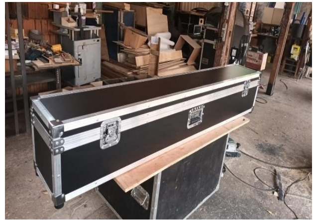
Figura 16:

Quando as informações fluem de maneira eficiente nos bastidores, as equipes conseguem antecipar e atender às suas necessidades com mais agilidade. Esse processo é fundamental para o sucesso do evento, pois minimiza problemas operacionais e permite que todos trabalhem de forma integrada e alinhada.