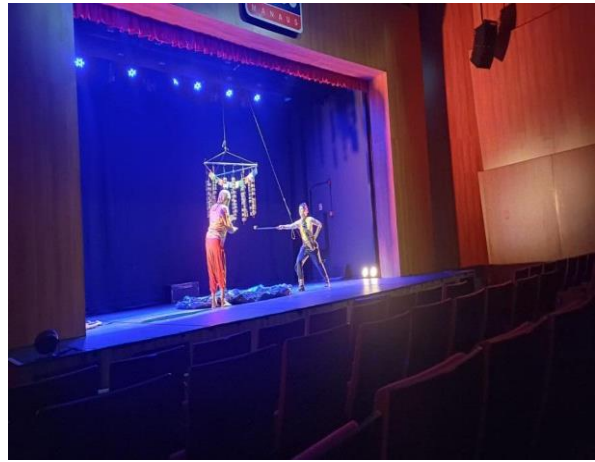
Figura 12: Acervo pessoal, 2024

A solução encontrada foi dividir a equipe: enquanto eu permanecia no Icubeu, um dos assistentes de direção ficou encarregado da montagem no Teatro Amazonas, acompanhado de outros dois staffs que garantiam o andamento do processo. Essa decisão exigiu confiança na equipe e comunicação eficiente. Mesmo com uma organização prévia sólida, a tensão pessoal era inevitável, devido à responsabilidade compartilhada e à necessidade de uma comunicação precisa para garantir que tudo acontecesse conforme o planejado.