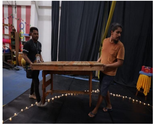
Figura 21: Acervo pessoal, 2024

Houve pedidos de mudanças na logística depois que o festival já havia começado, o que afetou o planejamento. O elenco era grande, e eu quase não consegui contato imediato com a diretora, o que foi necessário quando uma decisão rápida precisava ser tomada. A diretora pediu que a logística fosse alterada, preferindo que o elenco fosse buscado no hotel para o espetáculo, ao invés de ser deixado na rodoviária quando fosse sair da cidade. Esse pedido foi atendido, mas havia uma van disponível, e ela estava em outro local cumprindo outra demanda. Como o horário da apresentação estava apertado e eu era o responsável pelo primeiro espetáculo da Mostra, chamei a equipe e organizamos carros de aplicativo. Porém, a demora em atender e sinaliza os carros, causou alguns cancelamentos, dificultando a chegada do elenco ao Barra Vento (espaço circense onde a apresentação ocorreu). A apresentação atrasou 10 minutos, mas, no final, foi um sucesso, com casa cheia e grande satisfação para todos.