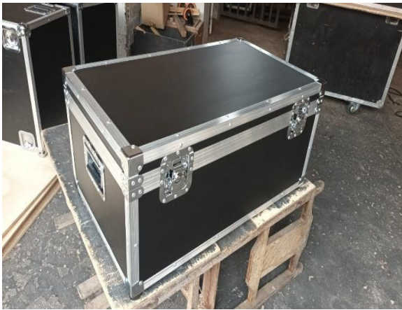
Figura 15: Acervo pessoal, 2024