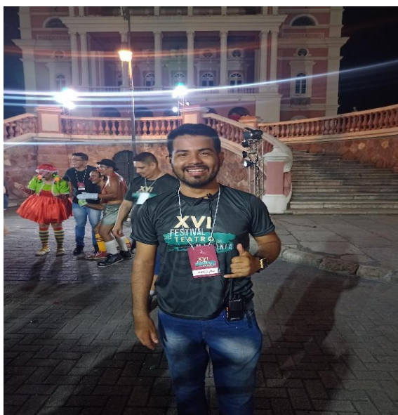
Figura 2: Acervo pessoal, 2022

Em determinado momento, houve a necessidade de realocar um elenco para outro camarim, e foi prestado todo o suporte necessário, garantindo que a mudança ocorresse sem problemas. Além disso, era responsável por verificar todas as tardes a lista de convidados e federados 17 , enviando-a por e-mail ao Teatro Amazonas e entregando uma cópia impressa para o receptivo.