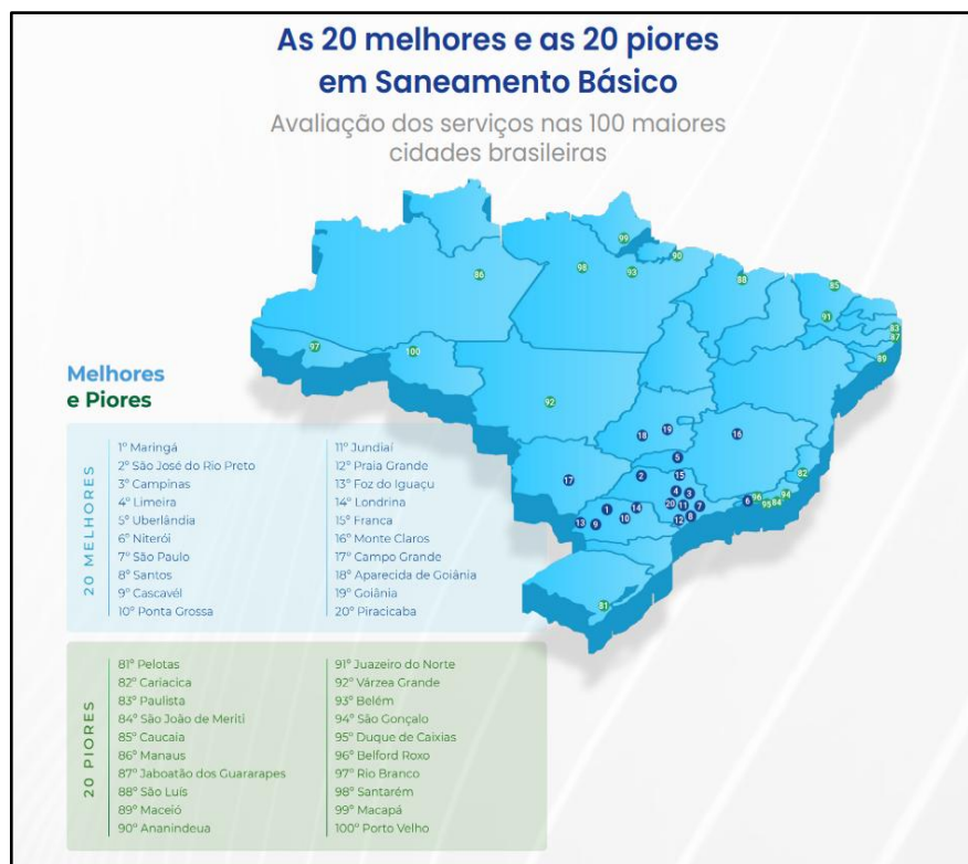
Figura 2- Ranking Saneamento Básico