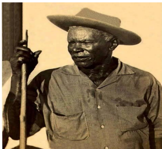
Figura 01: Mestre Irineu com bastão e chapéu

A história de vida do negro maranhense e seringueiro Raimundo Irineu Serra (1892 – 1971), este que chamava a atenção das pessoas por ter dois metros de altura, retrata a história da fundação da religião do Santo Daime, pois foi com sua migração do Maranhão para se refugiar na Amazônia, no período da extração da borracha, na década de 1920, que Irineu obteve seu primeiro contato com a ayahuasca, consumindo a bebida diretamente das mãos de um curandeiro peruano, na região da fronteira entre Brasil e Bolívia.