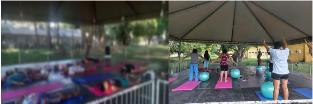
Imagem 6 e 7 - Momento matinal de conexão entre corpo e mente através de exercícios físicos

Exposição de quadros pintados pelos próprios usuários do CPAS II, esta atividade de pintura conta com instrução de um facilitador do SENAC, que em parceria com a SEMSA desempenha seu trabalho instruindo sobre as técnicas de pinturas em quadros. Esta atividade foi idealizada pelos pedagogos e foi desenvolvida sob a coordenação dos mesmos. Com isso percebe-se uma significativa melhora nos pacientes que tem esquizofrenia, pois conseguem passar um pouco de sua realidade através das telas de pintura. “A arte é uma maneira alternativa de comunicar algo que não conseguimos colocar em palavras” (CARREY, 2004).