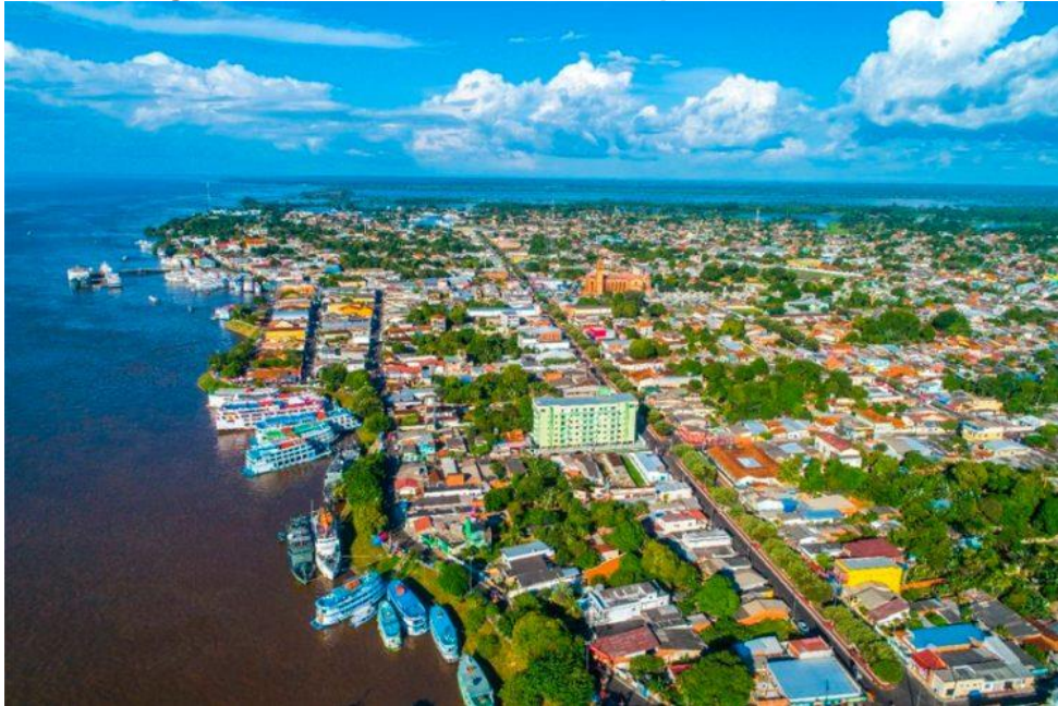
Imagem 2 – Vista de cima do município de Parintins/AM