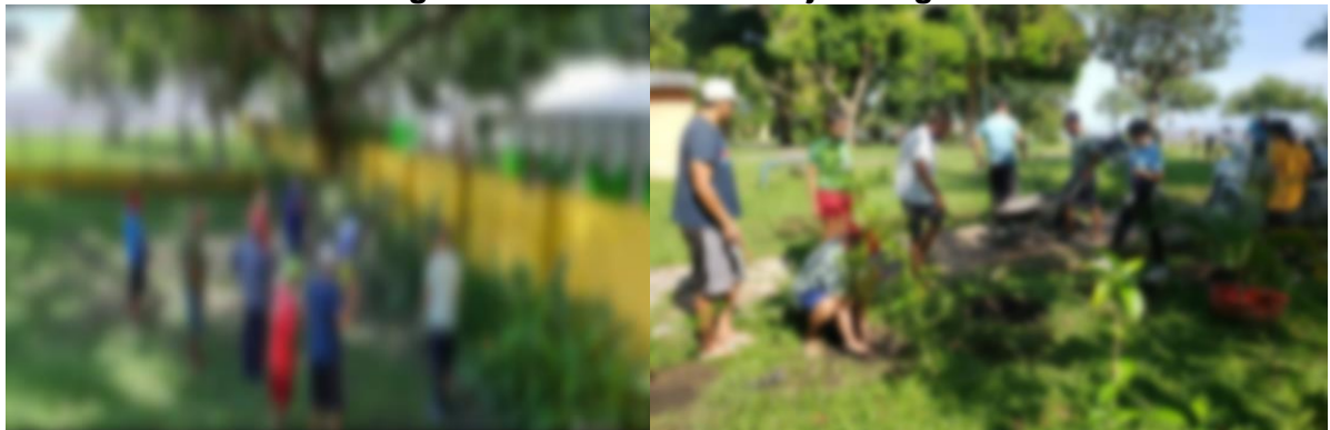
Imagem 9 e 10 - Momento de jardinagem

Quando há a necessidade de se confeccionar suas indumentárias, os pacientes participam das atividades auxiliando a costureira no momento da construção de suas roupas.