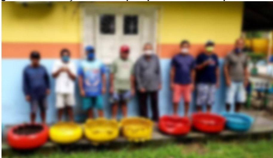
Imagem 12 - Confecção de vasos para plantas utilizando pneus usados

Estas atividades, também sob a responsabilidade dos pedagogos, possuem o intuito de aplicar técnicas de pinturas em tecido. É uma terapia muito importante pois não somente os ajuda a ocupar a mente como também pode ser utilizada para que os pacientes possam obter uma renda extra com a confecção destas peças.