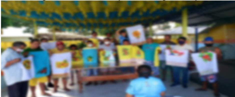
Imagem 11 - Técnicas de pinturas em guardanapos

compartilhado dentro de um grupo de aprendizagem, de relacionamento, de compromisso e de trabalho em prol de um objetivo comum”.