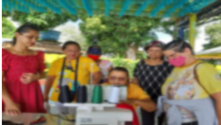
Imagem 8 - Momento de confecção das roupas para usarem na festa junina