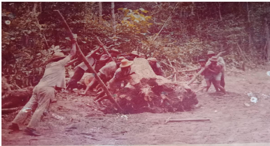
Figura 02: Abertura da estrada Colônia Santa Fé

máquinas e usavam apenas terçado, machado, enxadas, pedaços de madeiras e muito esforço físico, (figuras 02 e 03).