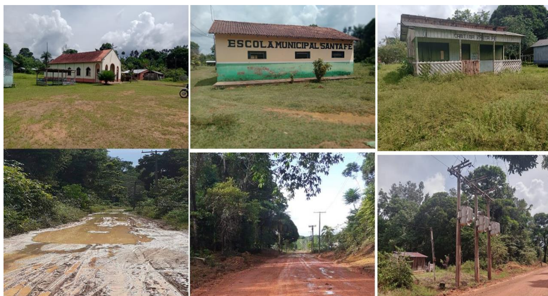
Figura 04: Igreja Católica, Escola Municipal e demais áreas da comunidade