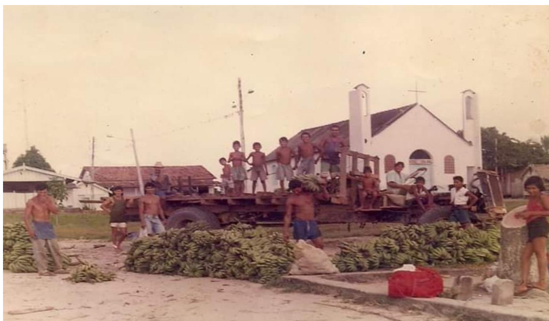
Figura 03: Transporte da produção na década de 90 – Comunidade Santa Fé