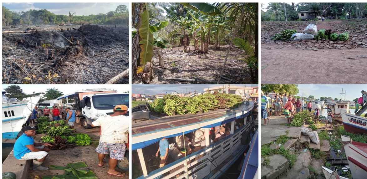
Figura 05: Preparação do solo para plantio, plantações, colheita e transporte dos produtos da comunidade Santa Fé