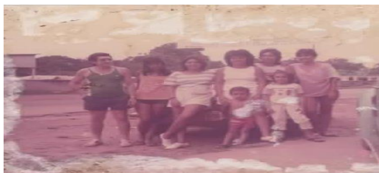
Figura 3 – Foto da Família em frente à rua Torquato Tapajós, anterior a construção da Avenida, 1985.