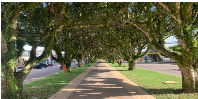
Figura 1 – Avenida Parque atualmente, 2024