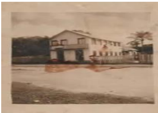
Figura 5 – Foto da Residência da Família, 1962.