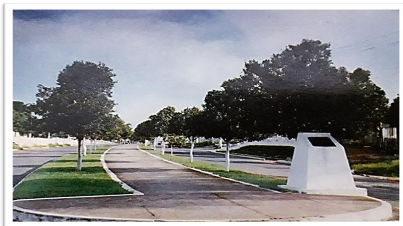
Figura 2 – Cartão Postal Avenida Parque, 1992