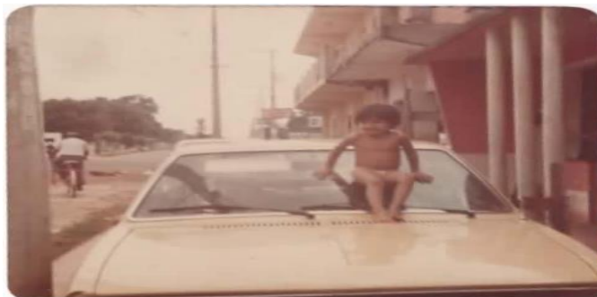
Figura 4 – Foto da Infância, em frente a residência da família, 1970.