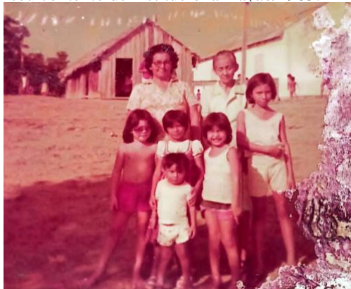
Figura 1: Vista parcial da comunidade após seu contexto de institucionalização/1983.