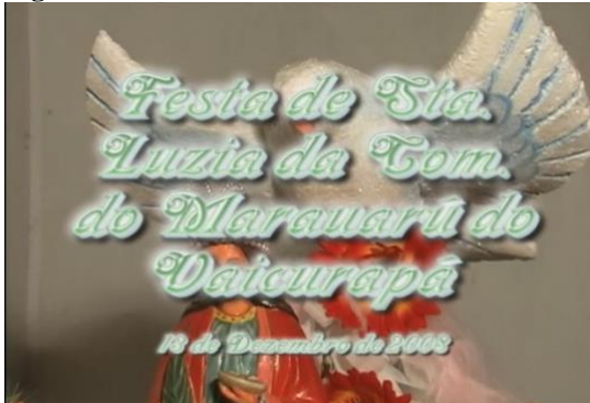
Figura 01: Andor de Santa Luzia.