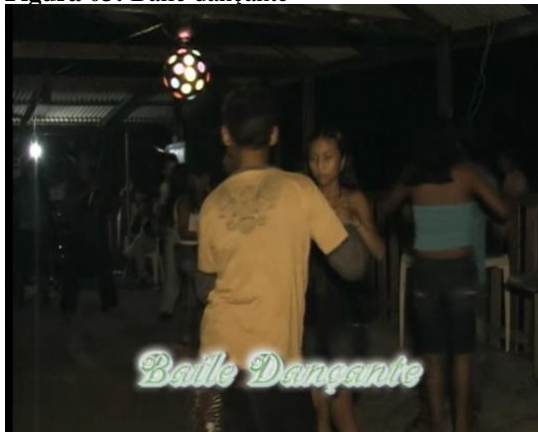
Figura 03: Baile dançante