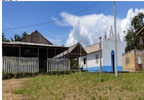
Figura 2: vista parcial do quadro da comunidade em 2024.