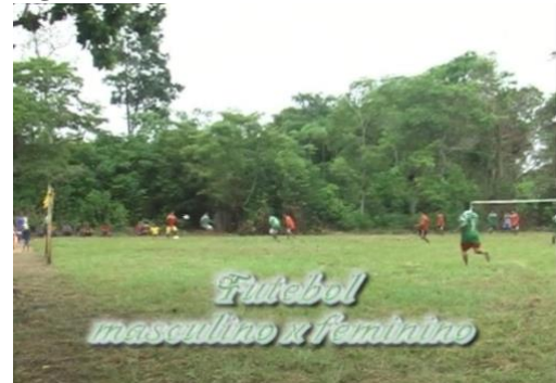
Figura 02: Torneio de futebol.