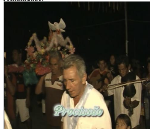
Figura 04: Procissão pelo quadro da comunidade.