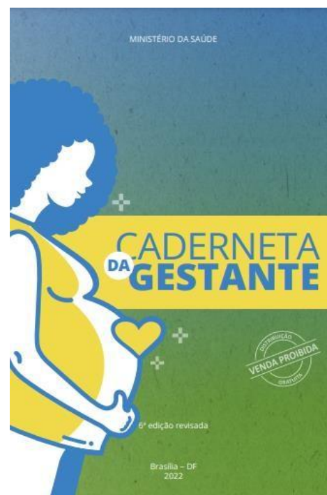
Figura 5. Caderneta da Gestante, 2022.

Faz-se importante ressaltar o ponto levantado por Gonçalves; Abreu (2018), reafirmado por Bravo; Salvador; Bianchetti (2023) a reforma administrativa implementada por Temer dissolveu ministérios, por exemplo, a Secretaria de Política para as Mulheres e os temas relacionados à igualdade racial e aos direitos humanos fora incorporada no Ministério da Justiça e Cidadania, bem como em seu discurso no dia internacional da mulher, seu posicionamento sobre as demandas das mulheres fica ainda mais acentuada, pois reduz o papel das mulheres ao pertencimento do espaço doméstico e sua manutenção, como cuidar da casa e dos filhos (Gonçalves; Abreu, 2018).