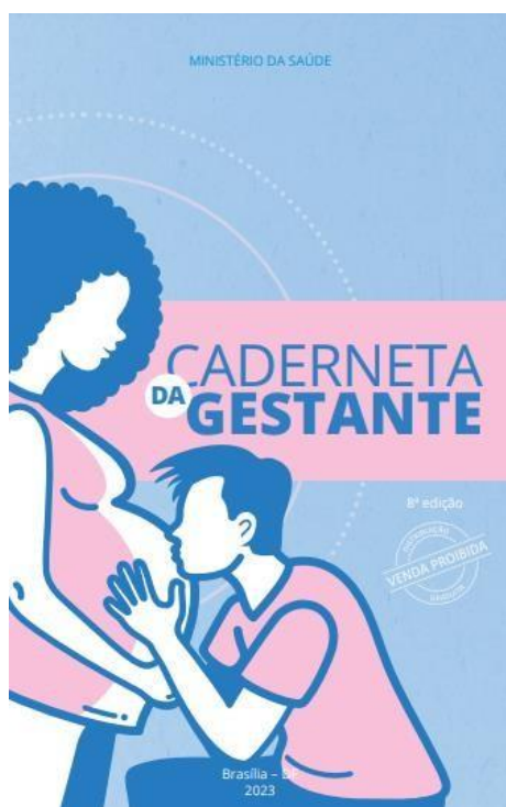
Figura 6. Caderneta da Gestante, 2023.

também retoma a importância da participação parental na capa, como pode ser observado na imagem abaixo: