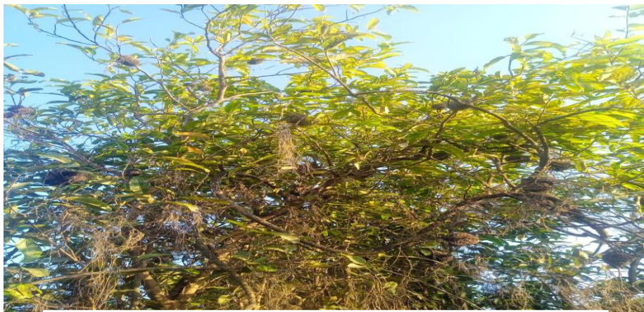
Figura 5: Arvore analisada na coleta

É importante ressaltar que as amostras coletadas apresentaram uma grande variedade de habitat onde foram encontradas, tais como: rochas, substratos de áreas lânticas e de áreas com características de ambientes lóticos. Também foram observadas e associadas a folhas, raízes e, principalmente, nos galhos das árvores.