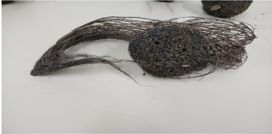
Figura 6: Amostra das esponjas de análise

espécies Drulia brownii é uma das espécies mais encontrada na Amazônia. Como geralmente formam aglomerados, podemos observar sua maioria presente em arbustos que ficam sazonalmente submergidos durante a cheia dos rios.