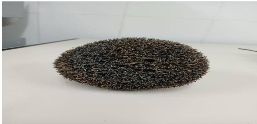
Figura 7: Objeto de análise: Gêmula redonda

Nos materiais coletados não haviam crostas evidentes presentes, acredita-se que essas estruturas, mais distantes do corpo principal, acabam se desprendendo e caindo no substrato, dando continuidade ao seu ciclo em outro local levado pelos cursos d'água, o que garante a dispersão geográfica da espécie, dificultando sua extinção.