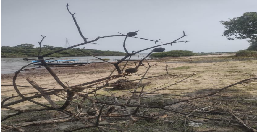
Figura 3: Área de coleta

partir da análise criteriosa das características morfológicas externas, conforme os parâmetros estabelecidos para a taxonomia de poríferos dulcícolas.