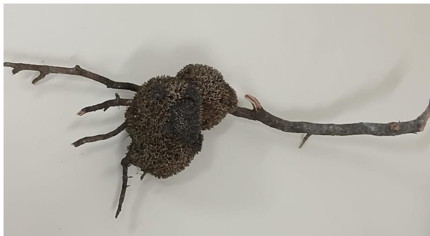
Figura 1: Exemplar coletado: Gêmula aderida ao substrato

Por esta razão, no momento da coleta, houve a precaução de coletar os indivíduos certificando-se que gêmulas não ficassem aderidas ao substrato, sabendo que elas são formadas na parte basal da esponja, próximas ou mesmo aderidas ao substrato