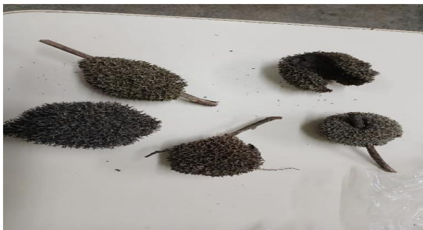
Figura 4: Exemplo do objeto de análise: Gêmulas

A identificação das esponjas de água doce baseou-se na observação de elementos estruturais específicos. Tais como, a conformação do corpo, a textura, a organização do esqueleto formado por fibras de esponjina e, sobretudo, na presença, disposição e morfologia das gêmulas. As gêmulas são estruturas de resistência e de extrema importância taxonômica, uma vez que sua posição nas fibras, sua quantidade e suas características morfológicas são elementos diagnósticos essenciais para a diferenciação das espécies.