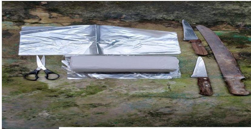
Figura 2: Materiais utilizados na coleta

Nas coletas foi utilizada uma faca com lâmina delgada e afiada; tesoura para seccionar partes de vegetação; facão para corte de galhos árvores ou pequenos troncos submersos nas margens; papel filtro (papel toalha); caderno de campo para anotações; sacos plásticos para armazenamento.