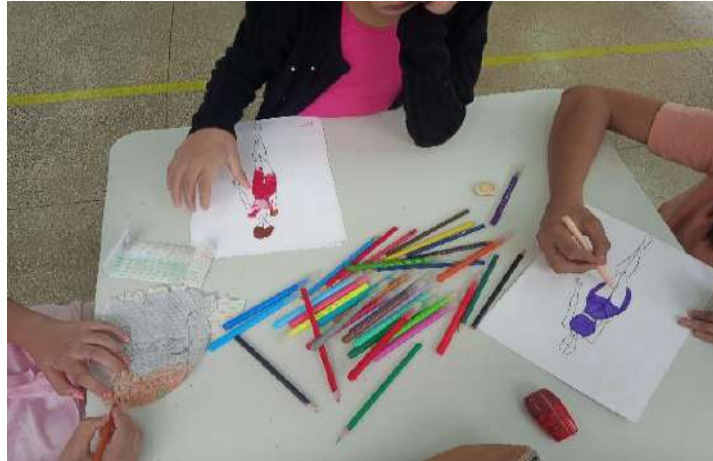
Figura 15 – Oficina de croqui tema princesas dançarinas.

proposta. Esse exercício de criação prática permitiu que as alunas compreendessem o impacto do figurino na cena, o que está alinhado com a análise de (Lobo e Novas, 2008) sobre como a composição teatral, incluindo o figurino, é fundamental na criação de uma linguagem artística que envolva não apenas o movimento, mas também a percepção visual do público.