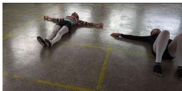
Figura 1 – Aplicação da aula 1 uma introdução a dança somática