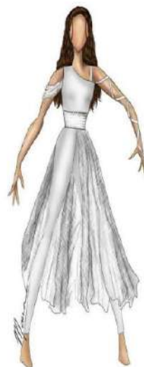
Figura 11 – Imagem ilustrativa do Pinterest para aborda um entendimento significativo.