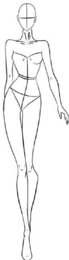
Figura 13 – Imagem de croqui tirado do Pinterest

Cada uma recebeu duas imagens e foi convidada a criar e colorir seu próprio figurino, com base no que achavam que seria adequado para a apresentação