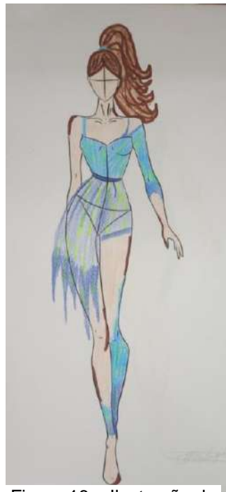
Figura 16 – Ilustração da pesquisadora

movimento, mas envolve uma história não só por trás dos gestos, mas também do figurino em si”. A11 expressou seu encanto com o papel do figurino no universo da dança, comentando: “Professora, acho lindo o figurino no palco... Quando crescer, quero ser estilista.” Sua fala refletiu um olhar admirado e um sonho em formação, despertado pela conexão entre arte e moda. A18, por sua vez, destacou seu interesse pelo processo criativo, afirmando: “Professora, acho interessante a forma de criar um figurino para determinado espetáculo.” Essa observação revelou sua curiosidade em compreender como o figurino é pensado e adaptado para narrativas específicas, mostrando um envolvimento crítico com a temática apresentada. Esse feedback reflete a importância do figurino não apenas como elemento estético, mas como uma parte fundamental da narrativa e da construção do significado cênico, conforme explorado por (Oliveira e Castilho, 2008), que apontam o figurino como uma ferramenta essencial para comunicar identidade e contexto na performance.