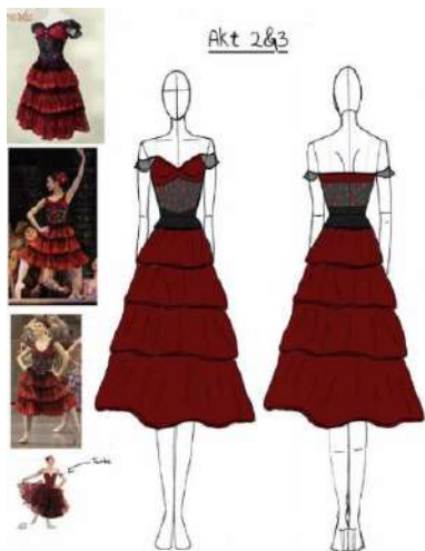
Figura 12 – Imagem ilustrativa do Pinterest para aborda um entendimento significativo.