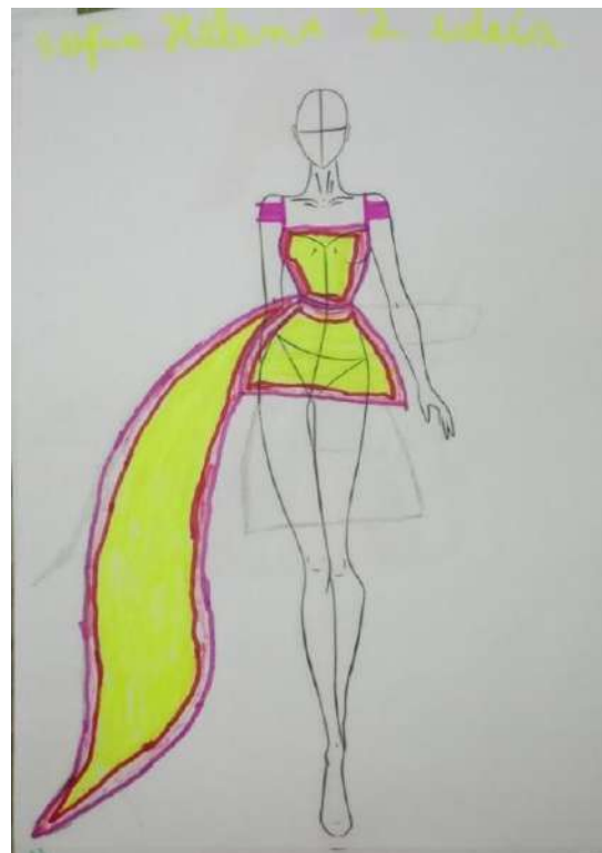
Figura 17 – Criação exclusiva de A9 com o tema da aula princesa dançarina inspiração em A Bela Adormecida.

A9 compartilhou sua segunda ideia com entusiasmo: “Pensei em uma princesa que é independente. Ela usa um vestido curto com uma cauda longa, que serve para ajudar uma senhora a se locomover, como no Tarzan, e depois pode ser reutilizada para dançar.”