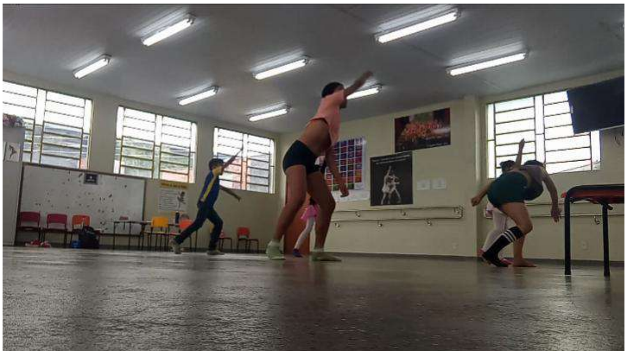
Figura 22 – Aula 4 processo de criação contínua, cada movimento feito com a perspectiva e o empenho de cada aluna.

Essas vivências demonstraram não apenas a riqueza dos repertórios corporais de cada aluna, mas também a capacidade de transformar gestos simples em expressões artísticas. Essa prática está alinhada à visão de Silva, que afirma: “A composição improvisada é um processo de ressignificação, em que os gestos cotidianos ganham novos significados ao serem inseridos no contexto da dança” (SILVA, 2011, p. 72). Essa ressignificação permitiu que as alunas estabelecessem uma relação entre corpo, memória e narrativa.