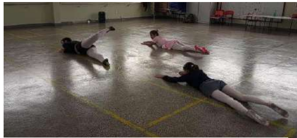
Figura 6 – Foto sinaliza a aplicação da aula 2 abordando Klauss Vianna e Laban.