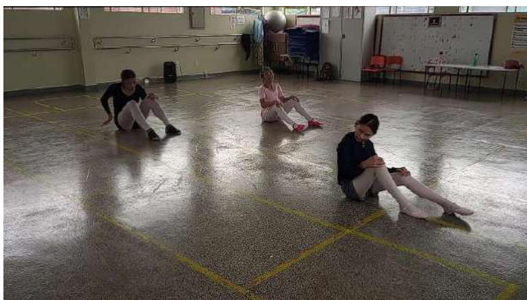
Figura 4 – Reaplicação da aula 1 com as alunas trazendo percepções e se observando