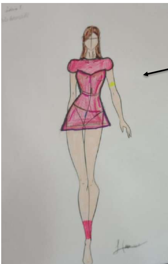
Figura 19 – Criação exclusivamente de autoria da A11 inspirada na princesa A Bela Adormecida

Pessoalmente, essa experiência também ampliou minha visão sobre a importância da interdisciplinaridade no ensino da dança e da arte em geral, e como recursos simples, como croquis e discussões sobre tecidos e história, podem abrir novas formas de expressão e entendimento para os alunos. Isso me incentivou a continuar buscando maneiras criativas e acessíveis de integrar outros elementos cênicos no processo de aprendizagem, além da dança em si, o que, sem dúvida, será uma base valiosa para futuras experiências pedagógicas.