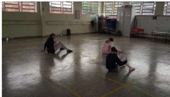
Figura 7 – Foto sinaliza a aplicação da aula 2 abordando Klauss Vianna e Laban.

reconhecimento das diferenças entre as abordagens e um interesse em expandir sua visão sobre a dança.