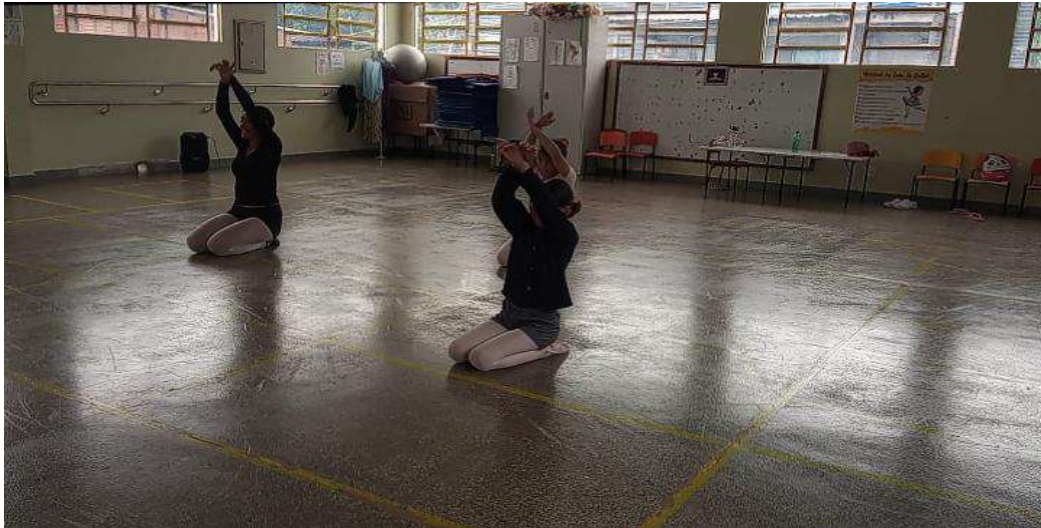
Figura 8 – Reaplicação da aula 2 com três alunas.

quando percebidos e ressignificados, possibilitam uma maior liberdade e autonomia no movimento” (MILLER, 2013).