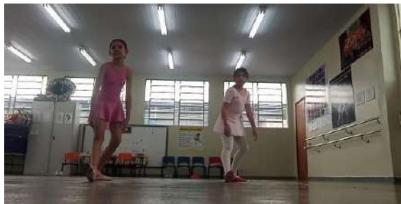
Figura 5 – Reaplicação da aula 1 com as alunas trazendo percepções e se observando