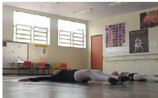
Figura 2 – Aplicação da aula 1 uma introdução a dança somática

Esse pensamento dialoga com as reflexões de Lenira Rangel, que afirma: A dança deve ser pensada como uma atividade que considera o corpo em sua totalidade, articulando movimento, emoção e percepção, contribuindo para o desenvolvimento integral do indivíduo” (RANGEL, 2008, p. 45). Assim, ao trabalhar a conectividade entre corpo e mente/corpo conectivo 2 , a proposta busca criar uma vivência que integre as dimensões física, cognitiva e emocional, em consonância com os princípios defendidos pela autora.