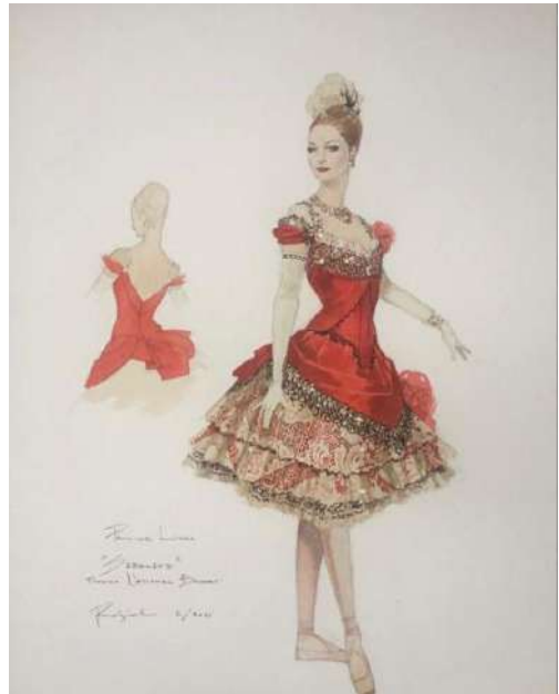
Figura 9 – Imagem ilustrativa do Pinterest para aborda um entendimento significativo.