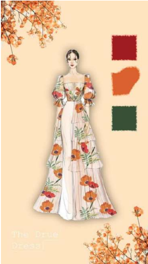
Figura 10 – Imagem ilustrativa do Pinterest para aborda um entendimento significativo.