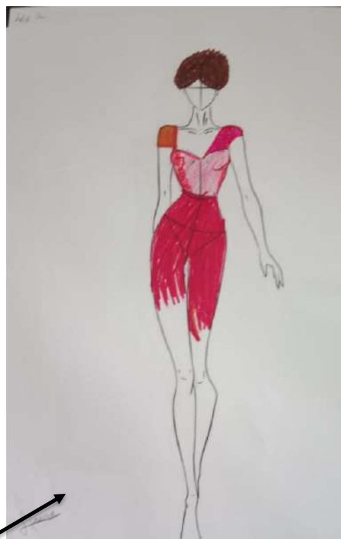
Figura 20 – Criação exclusivamente de autoria da A11 inspirada na princesa A Bela Adormecida

A11 compartilhou suas ideias com entusiasmo. “Minha primeira ideia foi trazer a Bela Adormecida, mas em uma versão rapariga, mais atual e descolada.”