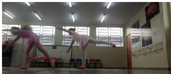
Figura 3 – Reaplicação da aula 1 com as alunas trazendo percepções e se observando

Ao final da aula, abri um espaço de diálogo para ouvir as percepções das alunas sobre a experiência. Elas relataram que gostaram da atividade, a A9 compartilhou sua experiência com entusiasmo, dizendo: “Professora, observei meu corpo durante o dia e tentei colocar em prática o que aprendi na última aula.” Sua fala evidenciou o impacto das atividades realizadas e o interesse em aplicar o aprendizado no cotidiano. Por outro lado, A18 trouxe uma reflexão mais desafiadora ao comentar: “Professora, apesar de ser algo novo, achei difícil conectar meu corpo com a minha mente.” A participante A11 comentou “que nunca havia pensado no corpo como algo singular e dotado de uma percepção própria, pois acreditava que todos os corpos funcionavam e reagiam da mesma forma ao dançar.” Esse relato destacou as diferentes maneiras como as alunas estavam lidando com os exercícios propostos, revelando tanto o envolvimento quanto as dificuldades individuais no processo de conscientização corporal. Esse momento foi significativo, pois evidenciou o impacto do processo na desconstrução de ideias prévias sobre o corpo e a dança, permitindo que as alunas começassem a explorar a individualidade e as potencialidades de seus movimentos. Essa experiência reforçou a importância de criar um ambiente seguro e estimulante, onde cada participante possa reconhecer a singularidade de sua corporeidade e ampliar sua relação consigo mesma e com o mundo ao seu redor.