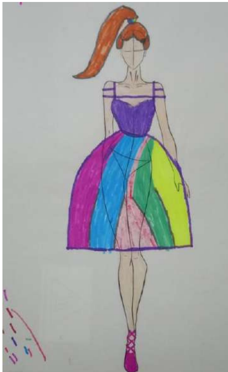
Figura 18 – Criação exclusiva de A9 com o tema da aula princesa dançarina inspiração em A Bela Adormecida.

A9 compartilhou sua ideia ao explicar seu desenho: “Minha primeira ideia foi para uma princesa que usa todas as cores, como um arco-íris.”