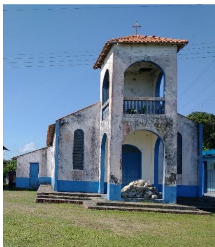
Figura 3: Primeira capela de “Nossa Senhora das Graças” (a esquerda). A direita, a atual igreja

Considerando o histórico de fundação da localidade oriundo de comunidades rurais de Base da Prelazia de Parintins, mais tarde por volta de 1959, surge “Nossa Senhora das Graças” que deu origem a Congregação Mariana e posteriormente a comunidade. A data de fundação, em geral, marca o reconhecimento oficial da comunidade, que quase sempre coincidiu com a capela (figura 3) pelo menos provisória; n’alguns casos até aponta o tempo em que se construiu a capela de alvenaria. (CERQUA, 1980).