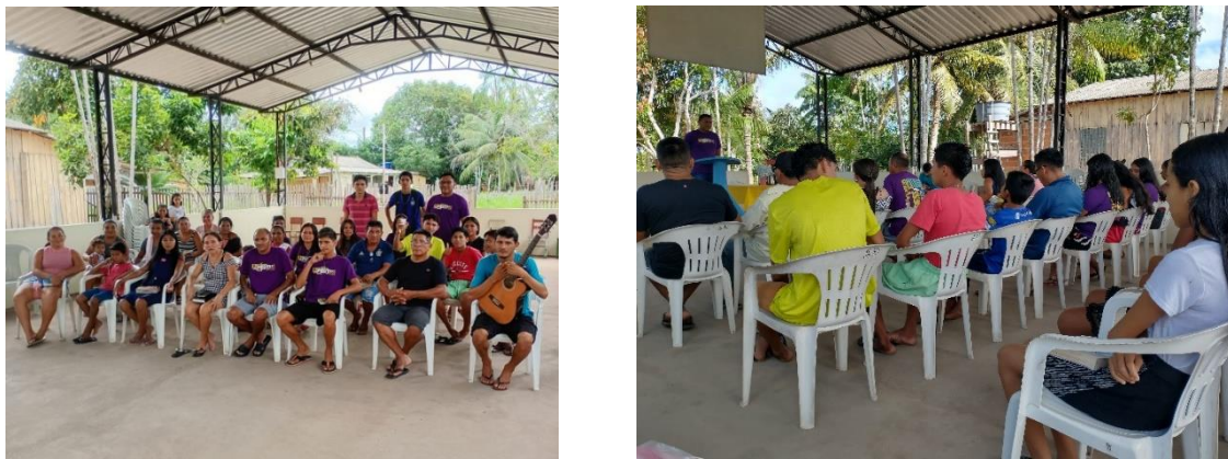
Figura 6: Sede da “Congregação Nova Jerusalém” da Comunidade do Maranhão