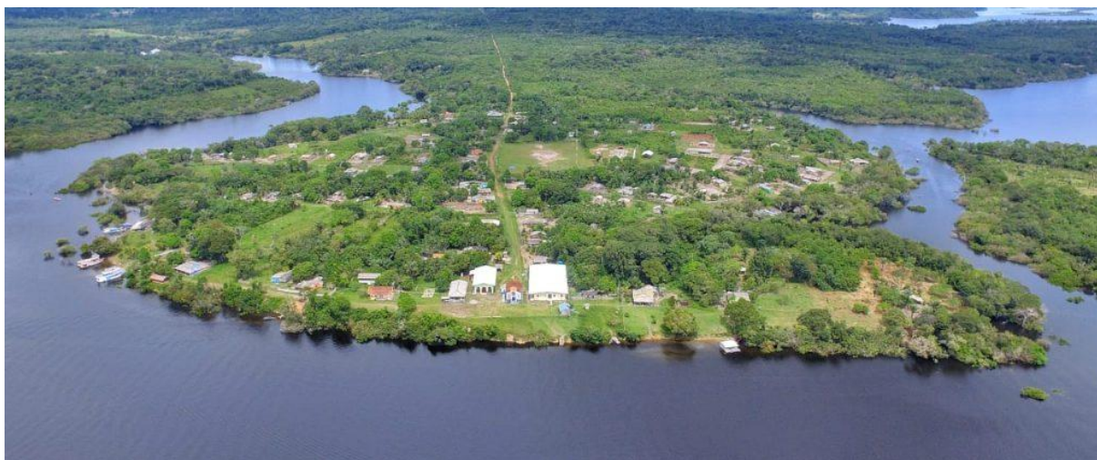
Figura 1: Vista panorâmica da Comunidade do Maranhão