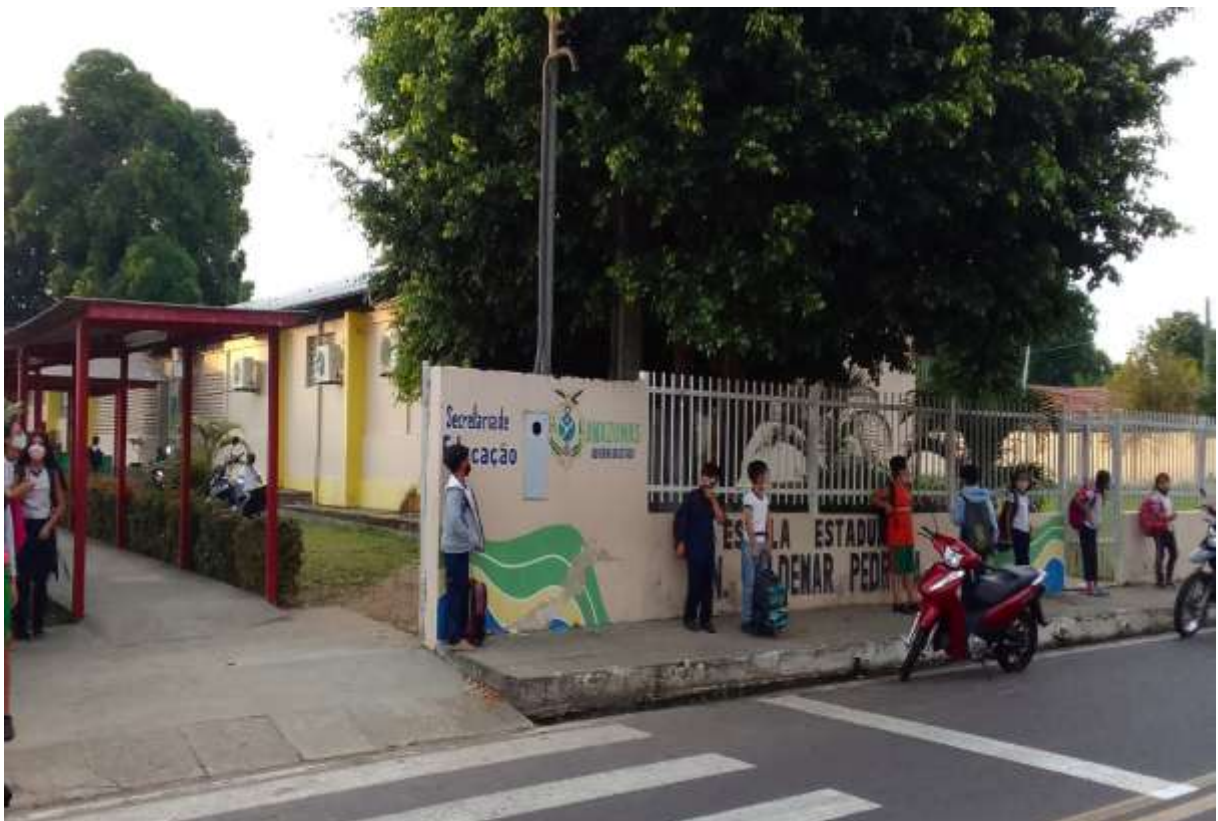
Figura 01: Contexto da pesquisa

Atende demanda de alunos que estão no Ensino Fundamental I, nos turnos matutino e vespertino. Os alunos possuem realidade socioeconômica distinta uns dos outros, uma vez que a escola atende crianças de todos os bairros de Parintins, inclusive das áreas de ocupações. Dessa forma os alunos trazem seus diferentes traços culturais e sociais para o âmbito escolar. A escola dispõe de professores qualificados para atender todos os alunos, e para os alunos com necessidades educacionais especiais tem professores auxiliares que fazem o acompanhamento dentro da sala de aula.