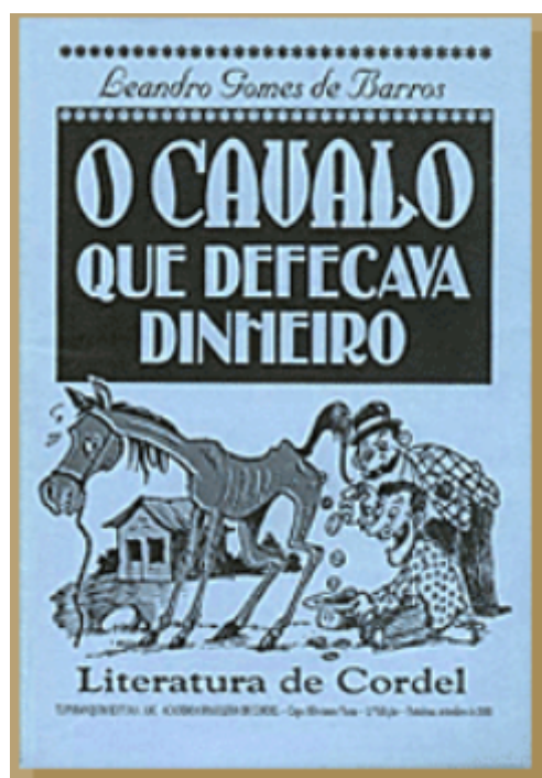
ANEXO 2 - Figura 11: Cordel “O cavalo que defecava dinheiro”