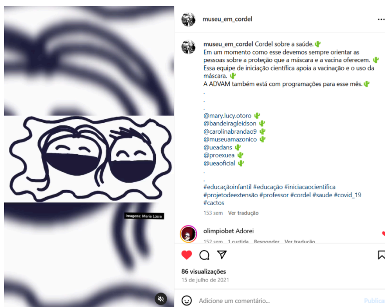
Figura 5: Segundo vídeo publicado nomeado “Cordel da saúde”