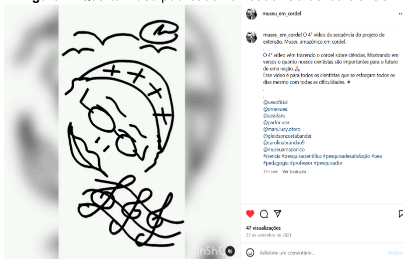
Figura 7: Quarto vídeo publicado nomeado “Cordel da ciência”

O entrevistado lembrou que: “Na época fizemos uma reunião de alinhamento e uma das discussões era para falarmos da ciência que está ao nosso redor e como o investimento na ciência é também para o futuro” (Aluno voluntário, 2024).