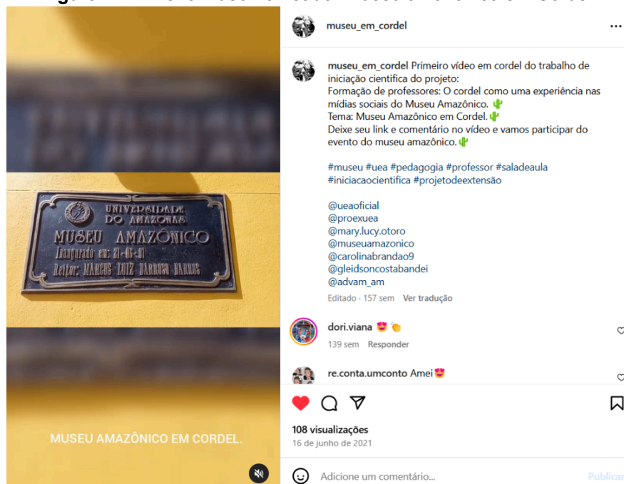
Figura 4: Primeiro vídeo nomeado “Museu amazônico em Cordel”

O aluno entrevistado compara o cordel e o Instagram a algo que ele trabalha há muito tempo, que é o rádio. Para o entrevistado, este é um meio de difusão que divulga informações tanto quanto o Instagram e a linguagem do cordel. No terceiro bloco de entrevistas, foi feita uma discussão sobre o cordel e seu avanço nas tecnologias digitais, que busca responder ao questionamento: “Como o uso da tecnologia pode potencializar o ensino da literatura de cordel?”. O entrevistado pontuou: “O projeto cordel utilizou-se muito das redes sociais e pode ser um grande exemplo de como podemos unir a literatura de cordel, as tecnologias e o ensino, principalmente no Instagram ” (Aluno voluntário, 2024).