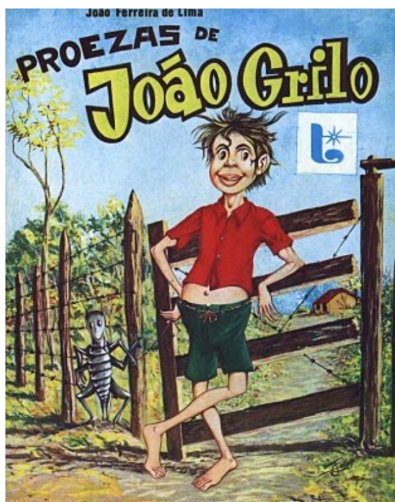
ANEXO 1 - Figura 10: Cordel “Proezas de João Grilo”